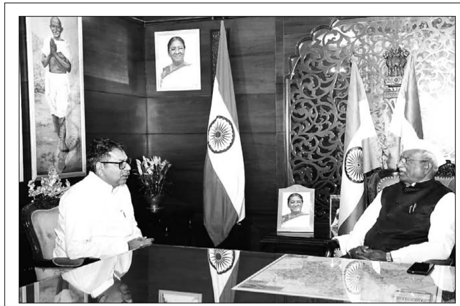
भाजपा हरियाणा प्रभारी व भाजपा राजस्थान पूर्व प्रदेशाध्यक्ष डॉ. सतीश पूनिया ने शनिवार को राजभवन पहुंचकर राज्यपाल हरिभाऊ किसनराव बागड़े से शिष्टाचार भेंट की।

इस अवसर पर मुख्यमंत्री ने कहा कि ऊर्जा के साधनों का विवेकपूर्ण उपयोग करने और पर्यावरण संरक्षण के लिए सभी को मिलकर प्रयास करने होंगे। इस दौरान मुख्यमंत्री निवास स्थित विभिन्न कार्यालयों में लाइट एवं उपकरण बंद रहे और कार्मिकों ने मोमबत्ती की रोशनी में कार्य किया।