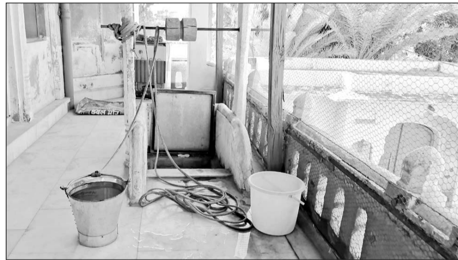
मंदिर परिसर में बना कुंड मंदिर की छत से बारिश का पानी नालियों के जरिए एकत्र करता है।

में बने विशाल कुंड में एकत्र बारिश का पानी भगवान के अभिषेक, भोग तैयार करने और मंदिर के अन्य नित्य कर्म में इस्तेमाल किया जाता है। यह प्रथा न केवल पुरखों की दूरदर्शिता को दर्शाती है, बल्कि आज के जल संकट के दौर में एक सबक भी देती है। शेखावाटी में वर्षों पहले बने धार्मिक स्थलों में बनाए गए वाटर स्ट्रक्चर आज भी पानी बचा रहे हैं। इससे साबित होता है कि पानी के मूल को हमारे पुरखों ने बहुत अच्छे से जान लिया था। झुंझुनू स्थल में पुराना पोस्ट ऑफिस के पास स्थित 106 साल पुराने लक्ष्मीनाथ मंदिर में बरसात के पानी से ही भगवान का भोग लगाया