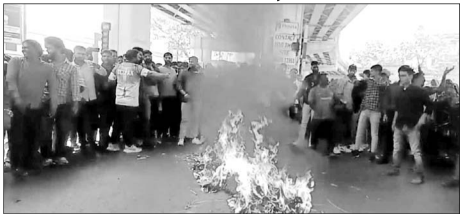
अस्थाई सफाई कर्मचारियों ने टायर जलाकर विरोध प्रदर्शन किया।

अजमेर, (कासं)। पांच सूत्रीय मांगों को लेकर हड़ताल पर चल रहे अस्थाई सफाई कर्मचारियों का आंदोलन छठे दिन भी जारी रहा। शनिवार को गांधी भवन चौराहे पर निगम प्रशासन व ठेकेदार का पुतला फूँककर कर्मचारियों ने विरोध दर्ज कराया और नगर निगम प्रशासन से जल्द उनकी मांगें पूरी करने की मांग की। डोर-टू-डोर कचरा उठाने वाले टेंपो चालकों ने भी काम बंद रखा है, जिससे शहर में सफाई व्यवस्था प्रभावित हो रही है। गांधी भवन चौराहे पर प्रदर्शन के दौरान कर्मचारियों ने जमकर नारेबाजी