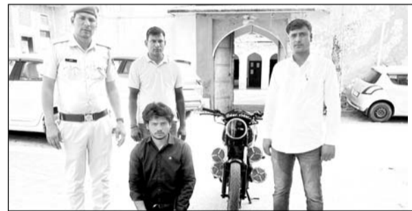
पुलिस ने युवक को शांतिभंग में गिरफ्तार किया।

ऐसी ही कई रील पुलिस के सामने आई, जिसमें यह युवक मॉडिफाइड कर बाइक में लगाए गए तेज आवाज के सिस्टम से राह चलती लड़कियों और महिलाओं को ना केवल डरा रहा था। बल्कि ऐसे स्ट्रे कर रहा था, जिससे वह लाइमलाइट में आ जाए।