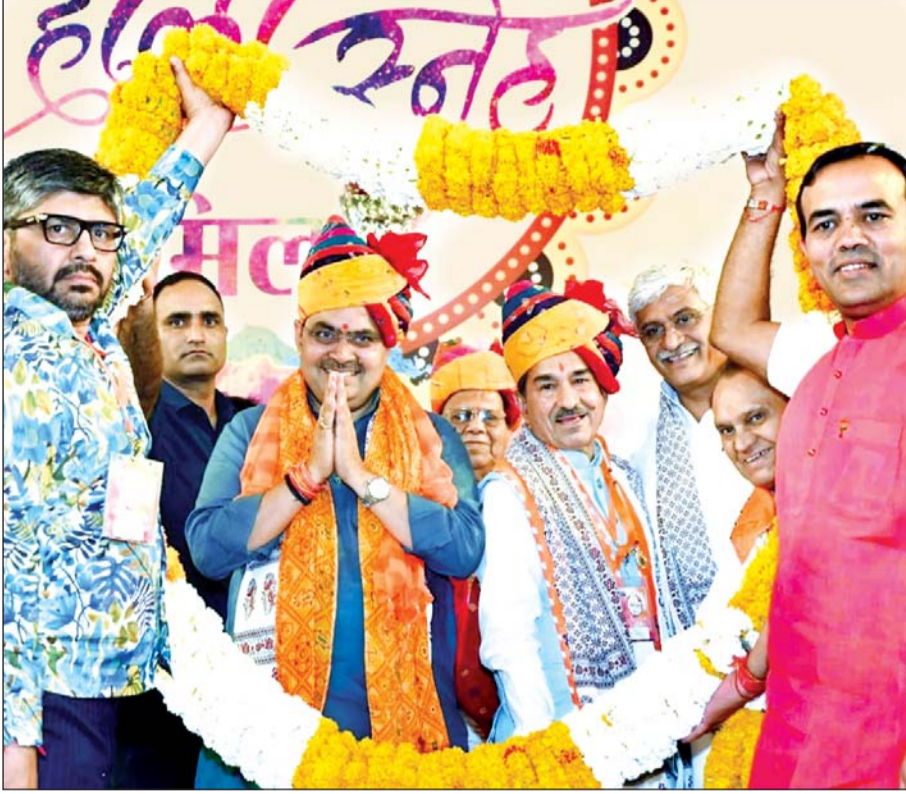
मुख्यमंत्री भजनलाल शर्मा ने भाजपा के होली स्नेह मिलन कार्यक्रम में पार्टी पदाधिकारियों व कार्यकर्ताओं को होली की शुभकामनाएं दी।

मुख्यमंत्री भजनलाल शर्मा ने कार्यक्रम को संबोधित करते हुए कहा, आज गाँव-गाँव ढाणी-ढाणी से पधारे हमारे सभी कार्यकर्ताओं का स्वागत है। हमारा अभी संगठन पर्व सम्पन्न हुआ है, जिसमें पार्टी की