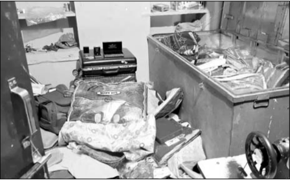
चोरी की वारदात के बाद मकान में सामान बिखरा पड़ा है।

■ पंचायत समिति सदस्य के जेट के घर से 50 लाख से ज्यादा के गहने चुराए