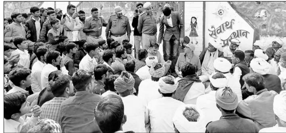
राजकीय उच्च माध्यमिक विद्यालय दुदावा के प्रधानाचार्य के खिलाफ ग्रामीणों ने प्रदर्शन किया।