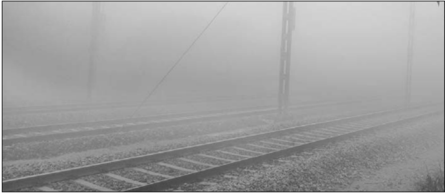
श्रीमाधोपुर में कोहरा छाने से रेल यातायात प्रभावित रहा।

श्रीमाधोपुर, (निसं)। कस्बा श्रीमाधोपुर सहित आसपास के ग्रामीण इलाके में लगातार तीसरे दिन भी शीतलहर व कोहरा जारी रहा जिससे आमजन को कठिनाईयों का सामना करना पड़ा। सर्दी का प्रकोप छाया हुआ है। तीसरे दिने यह कोहरा सर्दी का पहला कोहरा देखने को मिला है। लगातार चल रही सर्द हवाओं तथा पाले के गिरने से सर्दी में बढ़ोतरी हुई है। रविवार सुबह 10 तक कस्बे सहित आसपास का ग्रामीण आंचल क्षेत्र कोहरे के आगोश में लिपटा हुआ नजर आया। वहीं सड़क पर चलने वाले वाहनों को हार्न देकर चलाना पड़ रहा था वहीं आम रास्तों से भी ज्यादा खेतों में कोहरा इतना छाया कि महज 10 मीटर की दूरी पर भी कुछ भी दिखाई देना संभव नहीं था। वाहन चालकों को अपने वाहनों के हेड लाइट जलाकर ही आगे निकलना संभव हो रहा था। वहीं रेलगाड़ी भी धीमी गति से चलती नजर आ रही थी।