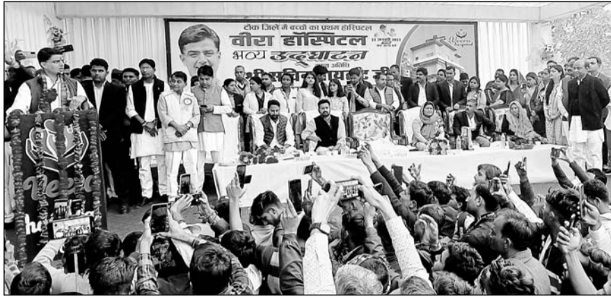
टोंक में हॉस्पिटल के उद्घाटन समारोह को पूर्व उपमुख्यमंत्री सचिन पायलट ने सम्बोधित किया।

पूर्व उपमुख्यमंत्री और टोंक विधायक सचिन पायलट ने कहा कि एक बार भाजपा एक बार कांग्रेस की प्रदेश में चल रही परम्परा को इस बार तोड़ा जाएगा। पायलट सोमवार को सिविल लाइन स्थित नवनिर्मित हॉस्पिटल के उद्घाटन समारोह में मुख्य अतिथि बतौर सम्बोधित कर रहे थे। पायलट ने कहा कि पार्टी में अनुशासन जरूरी है, इसमें कोई भी नेता छोटा या बड़ा नहीं है, अनुशासन सबके लिए बराबर है। उन्होंने कहा कि चुनाव से पहले समय रहते प्रचार जरूरी है। पायलट ने कहा कि 4 साल में भाजपा विपक्ष की भूमिका सही रहनी चाहिए। प्रदेश में 25 सांसद भाजपा के हैं, लेकिन प्रदेश को कुछ नहीं मिला। उन्होंने कहा कि राहुल गांधी की भारत जोड़ो यात्रा के बाद प्रदेश में 26 जनवरी से ऐतिहासिक हाथ से हाथ जोड़ो अभियान शुरू हो रहा है, यह 26 मार्च तक चलेगा।