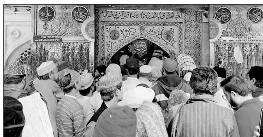
उर्स की विधिवत् शुरुआत के दौरान खोले गए जन्नती दरवाजे से गुजरते जायरीन।

उर्स में शरीक होने के लिए जायरीन के यहां पहुंचने का सिलसिला शुरू हो गया है। जयपुर और आसपास के