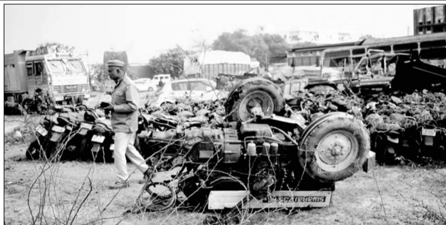
हादसे के बाद पुलिस वाहनों को जब्त कर थाने ले गई।