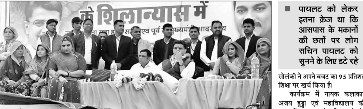
सचिन पायलट ने चाकसू में राजकीय कन्या महाविद्यालय के शिलान्यास समारोह को संबोधित किया।

लागत से कन्या महाविद्यालय के भवन का निर्माण कराया जा रहा है जो क्षेत्र में महिला सशक्तिकरण एवं बालिका शिक्षा की दिशा में महत्वपूर्ण कदम होगा। शिक्षा के माध्यम से समाज को हर वर्ग सशक्त हो सकता है। उपस्थित छात्राओं और महिलाओं को महिला शिक्षा को बढ़ावा देने का आव्हान करते हुए कहा कि शिक्षा के क्षेत्र में जो पैसे सरकारें लगाती हैं मैं इसे खर्च नहीं मानता, इसे निवेश मानता हूं और यह निवेश हुआ है आप लोगों के भविष्य आगे बढ़ने के अवसर मिलने हैं उन पर ध्यान केंद्रित होना चाहिए। राजनीति में दो चीज जोश भी चाहिए होश भी चाहिए। इसलिए सबको साथ लेकर बेहतर राजस्थान का निर्माण हम लोग करें, नौजवानों को अवसर दें और मुझे