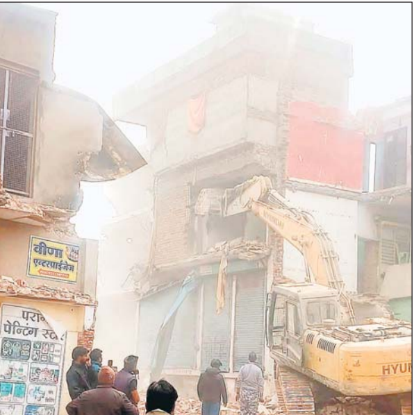
कोटपूतली नगरपालिका ने आजाद चौक पर सड़क किनारे बनी इमारतों और दुकानों को तोड़ने की कार्रवाई की।