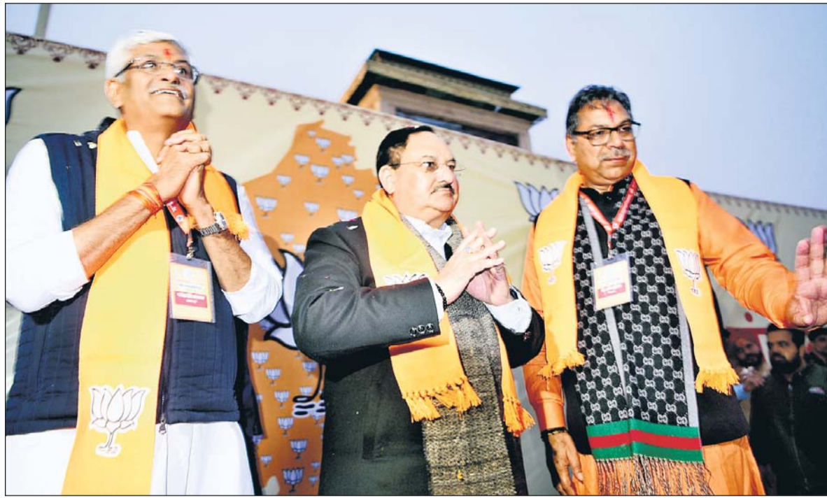
भाजपा के राष्ट्रीय अध्यक्ष जे.पी. नड्डा ने सोमवार को जयपुर में राजस्थान प्रदेश कार्यसमिति की बैठक की। उनके साथ बी.जे.पी. प्रदेशाध्यक्ष डॉ. सतीश पुनिया और केन्द्रीय मंत्री गजेन्द्र सिंह शेखावत भी मौजूद थे।