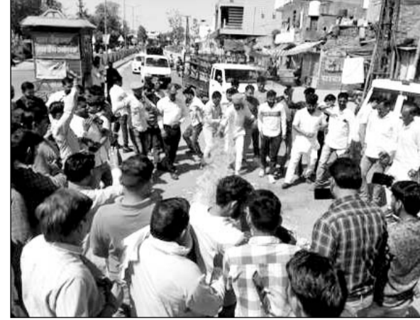
करणी सेना के पदाधिकारियों ने प्रदर्शन किया।

करौली, (निसं)। करौली में श्री राजपूत करणी सेना ने समाजवादी पार्टी के सांसद द्वारा राणा सांगा पर की गई टिप्पणी का विरोध किया। करणी सेना ने राजपूत छात्रावास में बैठक की। इसके बाद रैली निकाली और पुरानी कलेक्ट्रेट चौराहे पर समाजवादी पार्टी के सांसद का पुतला फूँका।