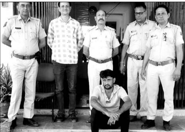
सिंधाना पुलिस ने हथियार के साथ एक जने को गिरफ्तार किया।

■ आरोपी के खिलाफ पूर्व में एक पॉक्सो का मामला दर्ज है, पूछताछ जारी