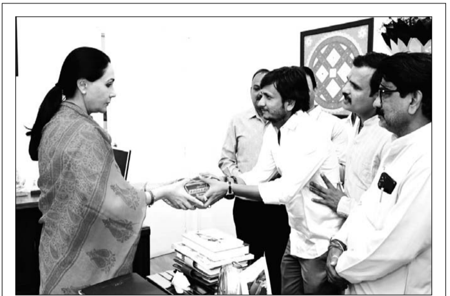
उपमुख्यमंत्री दिया कुमारी से सचिवालय में विद्याधर नगर विधानसभा क्षेत्र के पार्श्वद के साथ अन्य लोगों ने मुलाकात कर उनके द्वारा किये जा रहे विकास कार्यों के लिए उनको गुलदस्ता देकर धन्यवाद दिया।

द्वारा पैकस/लैम्पस के माध्यम से खरीफ-2024 में ऋण प्राप्त करने वाले किसान अब 30 जून, 2025 अथवा ऋण लेने की दिनांक से 12 माह, जो भी पहले हो, ऋण राशि चुका सकेंगे। पूर्व में ऋण चुकाने की अवधि 31 मार्च, 2025 निर्धारित थी, जिसे आगे बढ़ाने की मांग की जा रही थी।