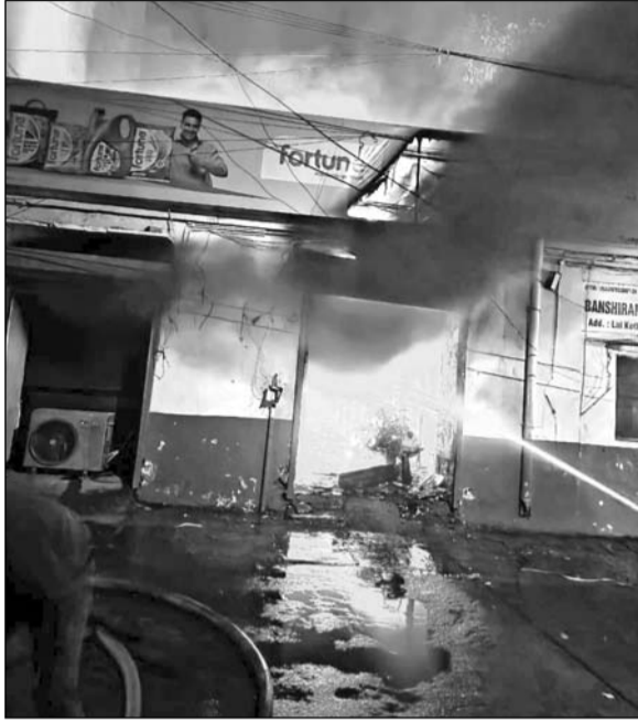
अजमेर के केसरगंज स्थित एक गोदाम में बीती रात शॉर्ट सर्किट से भीषण आग लग गई।

कर्मियों ने कार्रवाई करते हुए दो गाड़ियों को बाहर निकाल लिया। हालांकि एक बाइक और गोदाम में रखा अधिकांश सामान आग की चपेट में आ गया और पूरी तरह जलकर राख हो गया। चार घंटे की मशक्कत के बाद सुबह सात बजे आग पर काबू पाया गया। गोदाम मालिक ने बताया कि इस घटना में उन्हें लाखों रुपए का नुकसान हुआ है। प्रारंभिक जांच में आग लगने का कारण शॉर्ट सर्किट माना जा रहा है, हालांकि पुलिस और अग्निशमन विभाग द्वारा मामले की जांच की जा रही है।