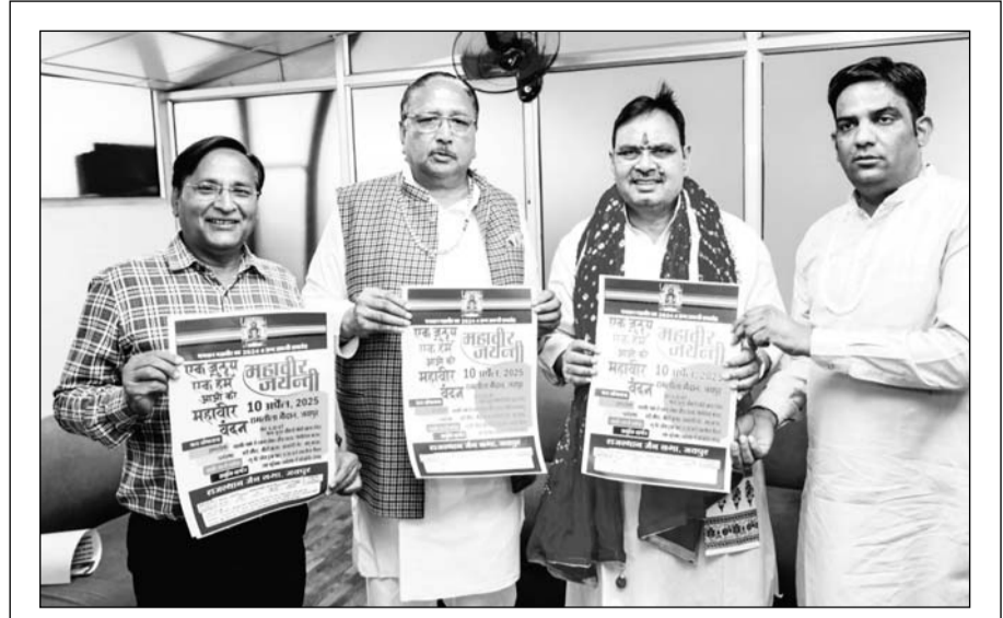
भगवान महावीर स्वामी के 2624 वें जन्म कल्याणक महोत्सव ( महावीर जयंती महोत्सव ) के शुभ अवसर पर मुख्यमंत्री भजनलाल शर्मा ने राजस्थान जैन सभा जयपुर के तत्वावधान में जयपुर में 10 अप्रैल को आयोजित होने वाले महावीर जयंती समारोह के बहुरंगीय पोस्टर का विमोचन किया।

जयपुर। महिला एवं बाल विकास विभाग के निदेशालय समीकित बाल विकास सेवाएं द्वारा 416 महिला पर्यवेक्षक के पदों पर नियुक्ति के आदेश जारी किया गया है। उप मुख्यमंत्री दिया कुमारी के निर्देशन में महिला एवं बाल विकास विभाग का सुदृढीकरण किया जा रहा है। विभाग में कार्मिकों की कमी नहीं होने से कार्य सुगमता से होगा। जिससे महिला एवं बाल विकास की योजनाओं से आमजन सरलता और सुगमता से लाभान्वित हो सकेगा। निदेशक आईसीडीएस ओ पी बुनकर ने बताया कि विभाग में 416 कार्मिकों की पोस्टिंग मिली है। जिसमें से आंगनवाड़ी कार्यकर्ता कोटे से 216 कार्यकर्ताओं की महिला पर्यवेक्षक के रूप में भर्ती की गई है।