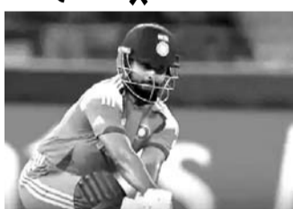
गया था। अख्यर ने चैम्पियंस ट्रॉफी में करीब 49 की औसत से बनाए रन अख्यर चैम्पियंस ट्रॉफी 2025 के 5 पारियों में 79.41 के स्ट्राइक रेट से 243 रन बनाए थे। इस दौरान उन्होंने दो अर्धशतक भी लगाए थे।

नई दिल्ली, 1 अप्रैल। टीम इंडिया के स्टार क्रिकेटर विराट कोहली और रोहित शर्मा के सेंट्रल कॉन्ट्रैक्ट में प्लस ग्रेड में ही रहेंगे। के सूत्रों के मुताबिक, बोर्ड दोनों खिलाड़ियों को टी-20 से रिटायरमेंट के बावजूद प्लस ग्रेड में रखने पर विचार कर रहा है। इस ग्रेड में दोनों प्लेयर्स को सालाना 7 करोड़ रुपए मिलेंगे। बोर्ड का मानना है कि इन दोनों खिलाड़ियों को वह सम्मान मिलना ही चाहिए, जिसके वे हकदार हैं। सूत्रों ने बताया कि टीम इंडिया के नंबर 4 बल्लेबाज और पंजाब क्रिकेट के कप्तान श्रेयस अख्यर की सेंट्रल कॉन्ट्रैक्ट में वापसी से संकट है। श्रेयस अख्यर को कुछ घरेलू मैच न खेलने की वजह से सेंट्रल कॉन्ट्रैक्ट से हटा दिया