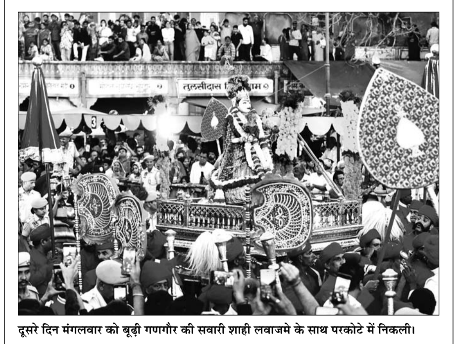
दूसरे दिन मंगलवार को बूढ़ी गणगौर की सवारी शाही लवाजमे के साथ परकोटे में निकली।

मुख्यमंत्री के इस निर्णय से बादरा, टिब्बी, रावतसर, गोलुवाला, इटावा, जैतसर, सादुलशहर एवं श्रीकरणपुर कृषि उपज मंडियों में लगभग 12 करोड़ 4 लाख रुपये की लागत से विभिन्न यार्ड विकास के कार्य किए जाएंगे। कोटपतली, सुभेपुर, सुरतगाढ़, कोटा, श्रीगंगानगर, नागौर और गोलुवाला मंडियों में लगभग 39 करोड़ 98 लाख रुपये की लागत से संपर्क सड़कों का निर्माण करवाया जाएगा।