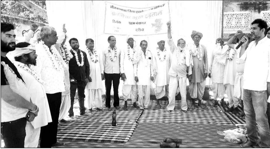
नीमकाथाना जिले को हटाए जाने के विरोध में 49वें दिन भी धरना जारी रहा।