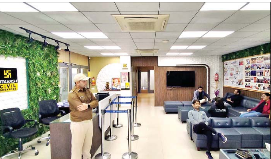
आयकर विभाग ने जयपुर में संचालित उत्कर्ष कोचिंग सेंटर पर छापेमारी की कार्यवाही की।