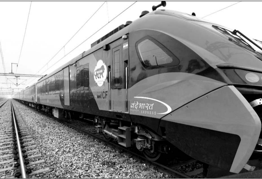
कोटा से लबान तक वन्दे भारत एक्सप्रेस ट्रेन की रफ्तार का ट्रायल हुआ।

■ 30 किलोमीटर की दूरी को 180 किमी प्रति घंटा की रफ्तार से परीक्षण किया