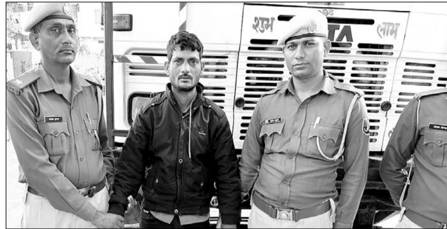
बिजौलिया थाना पुलिस ने भारी मात्रा में अवैध गांजा बरामद कर तस्कर को गिरफ्तार किया।

कोटा से बिजौलिया की ओर आ रहे ट्रक में 665.50 किलोग्राम गांजा बरामद किया