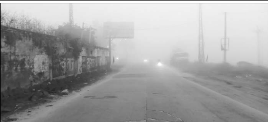
भरतपुर में नए साल के दूसरे दिन भी घना कोहरा छाया रहा।

वाहन चालकों को दिन में भी लाइट जलानी पड़ी