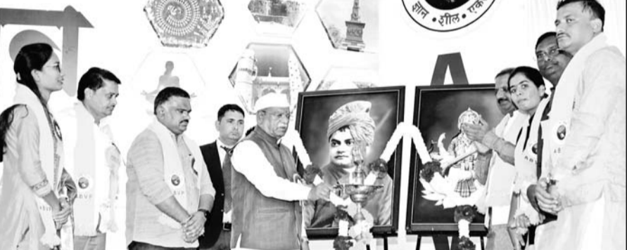
राज्यपाल हरिभाऊ बागडे ने गुरूवार को लातूर में अखिल भारतीय विद्यार्थी परिषद के 59 वें देवगिरी राज्य सम्मेलन का शुभारंभ किया।

जयपुर। राज्यपाल हरिभाऊ बागडे ने गुरूवार को महाराष्ट्र के लातूर में अखिल भारतीय विद्यार्थी परिषद के 59 वें देवगिरी राज्य सम्मेलन का शुभारंभ किया। इस दौरान उन्होंने अखिल भारतीय विद्यार्थी परिषद के युवाओं का आह्वान किया कि वे राष्ट्रीय शिक्षा नीति के आलोक में स्वरोजगार और आत्मनिर्भर भारत से जुड़कर विकसित भारत के संकल्प को पूरा करने में अपनी भागीदारी निभाएं।