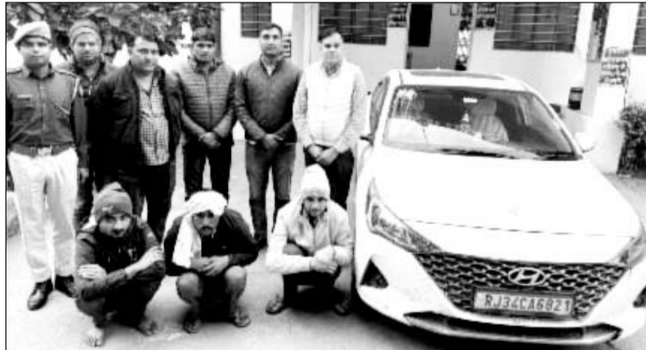
सपोटरा थाना पुलिस ने स्मैक तस्करों को गिरफ्तार किया

उन्होंने बताया कि सपोटरा थाने से स्वयं के नेतृत्व में पुलिस टीम का गठन किया गया। थाना सपोटरा पुलिस द्वारा