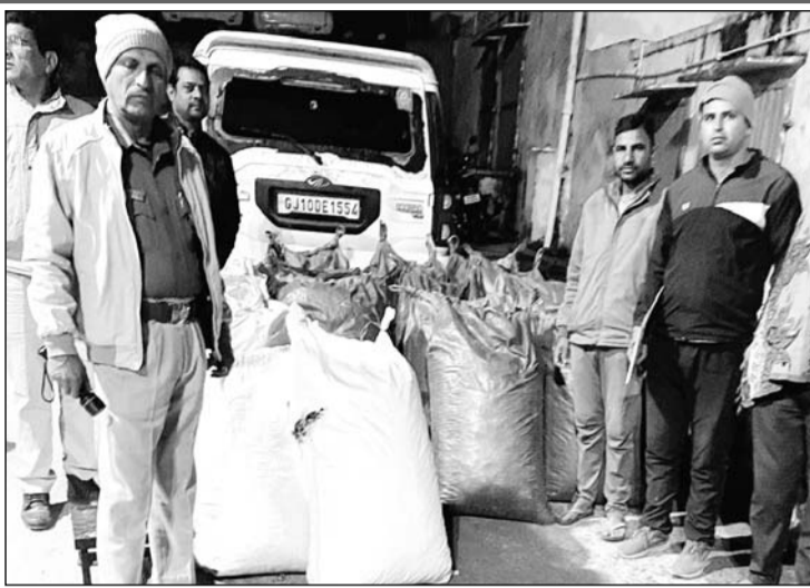
चित्तौड़गढ़ जिले की राशमी थाना पुलिस ने नाकाबंदी के दौरान एक स्कार्पियो से 440 किलो 695 ग्राम अवैध अफीम डोडा चूरा जब्त किया है।

जयपुर/चित्तौड़गढ़। चित्तौड़गढ़ जिले की राशमी थाना पुलिस ने नाकाबंदी के दौरान एक स्कार्पियो से 440 किलो 695 ग्राम अवैध अफीम डोडा चूरा जब्त किया है। जप्त मादक पदार्थ की अंतरराष्ट्रीय बाजार में कीमत करीब 66 लाख रुपए है। नाकाबंदी तोड़कर भाग रहे तस्करों का पीछा करने पर बरसाती नाले में पलटी खाने के बाद स्कार्पियो में सवार दोनों तस्कर अंधेरे और जंगल का फायदा उठाकर फरार हो गए, जिनकी सरगामी से तलाश की जा रही है।