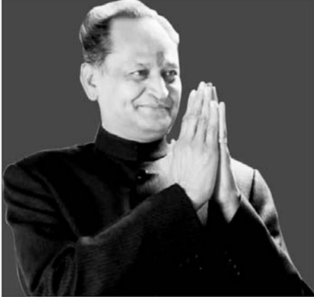
श्री अशोक जी गहलोत विधायक सरदारपुरा एवं पूर्व मुख्यमंत्री राजस्थान सरकार

अपनी विधानसभा से चुनाव के बाद से लापता है।