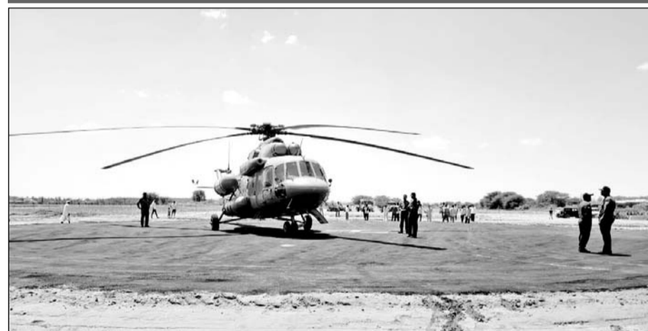
दिल्ली से डिग्गी पहुंचे वायु सेना के हेलीकॉप्टर ने तीनों हेलीपैडों पर अलग-अलग समय पर लैंडिंग कर पूर्वाभ्यास किया।

उपराष्ट्रपति जगदीप धनकड़ पांच सितम्बर को आयेंगे