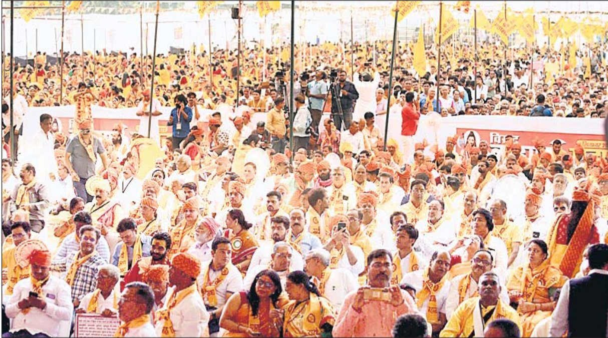
जयपुर के रामनिवास बाग में आयोजित ब्राह्मण महासंगम में देश-विदेश के हजारों लोगों का जनसैलाब उमड़ा।

जयपुर, (का.सं.) आज जयपुर में ब्राह्मण समाज ने अपनी ताकत दिखाई। लाखों ब्राह्मण प्रदेश भर से आये। एक ही नारा जय परसुराम जय परसुराम के नारे लगे। राजनीति पार्टियों के प्रमुख नेता ब्राह्मण महासंगम में हुए शामिल। स्वस्तिवाचन और शंखनाद से प्रारम्भ हुये इस ब्राह्मण महासंगम में जनसैलाब उमड़ा। ब्राह्मण महासंगम जयपुर में एक ऐतिहासिक आयोजन रहा। इस समारोह में घंटे-घडियाल बजाते हुए और धोती कुर्ता पहने हुए ब्राह्मण समाज के लोगों ने