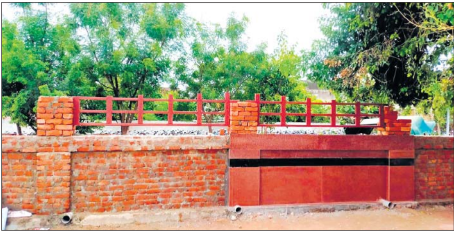
अमृत भारत स्टेशन योजना के अंतर्गत फुलेरा रेलवे स्टेशन का पुनर्विकास कार्य किया जा रहा है।