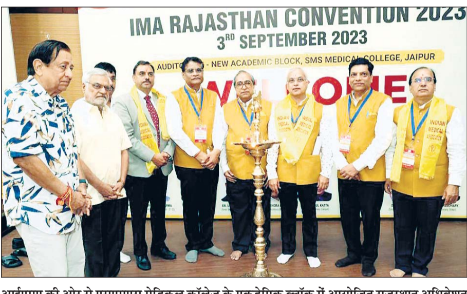
आईएमए की ओर से एसएमएस मेडिकल कॉलेज के एकडेमिक ब्लॉक में आयोजित राजस्थान अधिवेशन 2023 का विधानसभा अध्यक्ष डॉ.सी.पी.जोशी ने शुभारंभ किया।

जयपुरा प्रदेश भर के डॉक्टरों ने रविवार को जयपुर में आरटीएच बिल, फायर नेशनअसो, अस्पतालों को मिल रही मंहगी बिजली सहित कई समस्याओं के समाधान पर चर्चा की। आईएमए की ओर से एसएमएस मेडिकल कॉलेज के एकडेमिक ब्लॉक में राजस्थान अधिवेशन 2023 का आयोजन किया गया। इसमें 500 से अधिक डॉक्टरों ने भाग लिया। अंदाजाना महानदी की घोषणा के साथ ही 200 से अधिक चिकित्सकों ने अग्रदान की शपथ ली। इस अधिवेशन में आईएमए से जुड़े चिकित्सकों ने भाग लिया। इससे पहले आईएमए के पदाधिकारियों ने सीएमआर पर सीएमएस अशोक गहलोत से मिलकर डॉक्टरों के विभिन्न मुद्दों पर चर्चा की। इस पर सीएमए ने डॉक्टरों की समस्याओं का उचित समाधान निकालने को लेकर आश्वासन दिया।