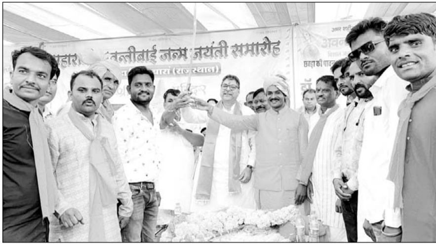
समारोह में भाजपा के पूर्व प्रदेशाध्यक्ष सतीश पूनियां का स्वागत किया।

तमिलनाडु के मुख्यमंत्री एमके स्टालिन के बेटे एवं तमिलनाडु सरकार में मंत्री उदयनिधि स्टालिन द्वारा सनातन