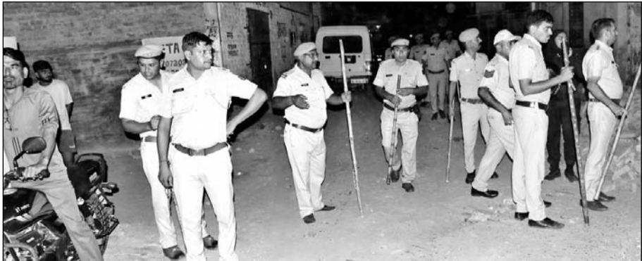
चूरू के वार्ड नम्बर एक में दो समुदायों के बीच हुई पत्थरबाजी के बाद पुलिस बल तैनात रहा।

चूरू, (कासं)। शहर के वार्ड एक में शनिवार देर रात दो पक्षों में हुई पत्थरबाजी के बाद पुलिस ने मामले में 14 जनों को गिरफ्तार करके न्यायालय में पेश किया। जानकारी के अनुसार पुलिस मौके के वीडियो के आधार पर लोगों को चिन्हित कर रही है। यहां कोतवाली थाने के सीआर अरविंद भारद्वाज ने बताया कि वार्ड संख्या एक में दो पक्ष में हुए झगड़े