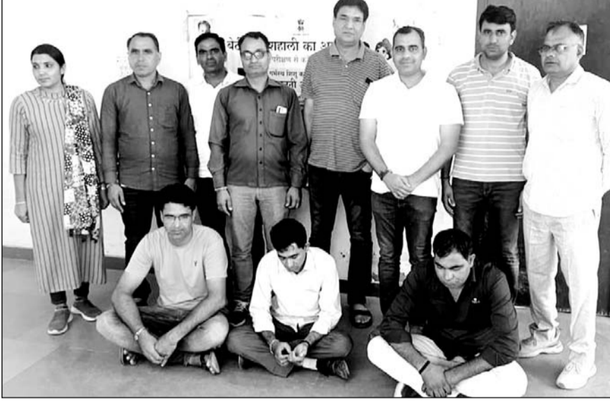
भ्रूण लिंग परीक्षण के नाम पर धोखाधड़ी के आरोपियों को गिरफ्तार किया।