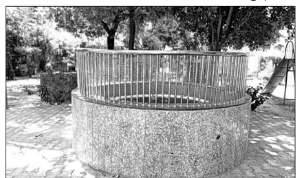
पार्क की शोभा बढ़ाने के लिए लगाया गया फव्वारा पूरी तरह से नकारा पड़ा हुआ है।

सांभरझील, (निसं)। यहां कटला बाजार स्थित गांधी बालबाड़ी का तीन साल बाद भी सौंदर्यीकरण का काम अधूरा पड़ा है। पार्क की शोभा बढ़ाने के लिए लगाया गया फव्वारा कुछ समय तो लोगों के आकर्षण का केंद्र रहा लेकिन बाद में देखरेख व असांभाल के तत्वों की वजह से आज यह पूरी तरह से नकारा पड़ा हुआ है। फव्वारे की खूबसूरती में चार चांद लगाने के लिए इसके चारों ओर लगाई गई स्टील की जालियों के बाद भी किसी ने अंदर से इसका नोजल खोलकर निकाल लिया है, करीब डेढ़ साल से यह फव्वारा अब शांपीस बना हुआ है। फव्वारे के अंदर बारिश का पानी भर रहा है जो सड़ांध मार रहा है जिसे निकालने के लिए कोई कदम नहीं उठाए जा रहे हैं, पानी में कार्ड जम गई है और मच्छर भी भिनाभिना रहे हैं।