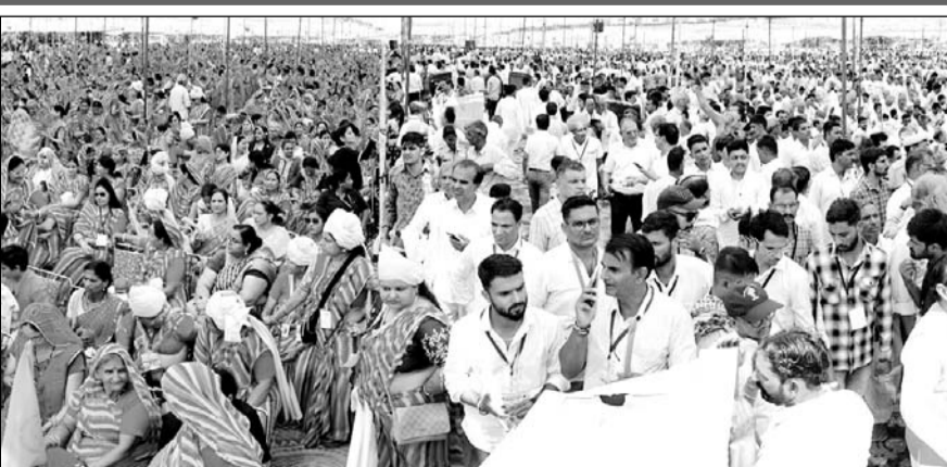
अखिल भारतीय जांगिड ब्राह्मण महासभा की ओर से विद्याधर नगर स्टेडियम में महाकुंभ आयोजित हुआ।