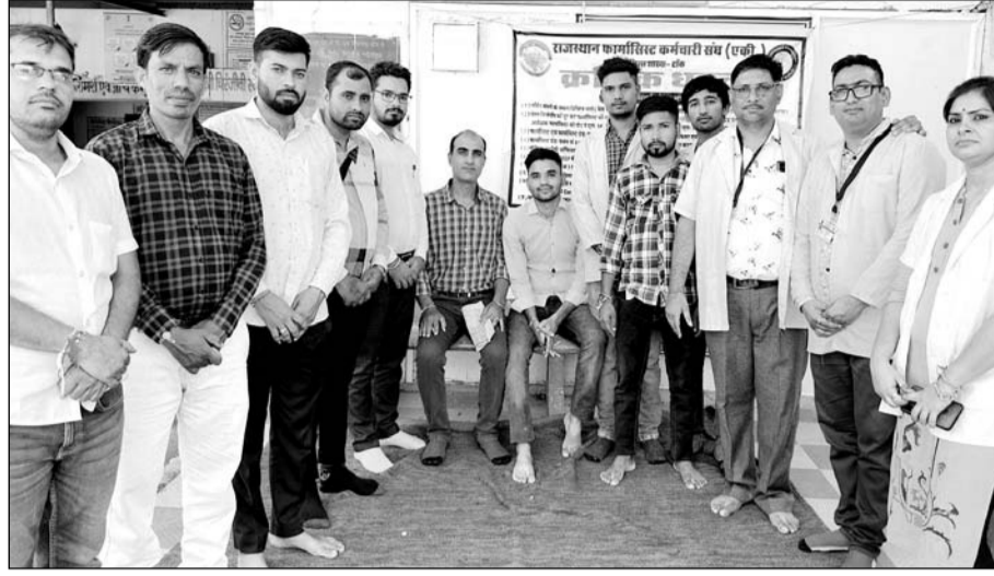
निवाई में फार्मासिस्ट कार्यों का बहिष्कार करके एक दिवसीय धरने प्रदर्शन पर रहे।

ऑफलाइन रिक्तों संधारण बंद किया जाए सभी डॉटासी काउंटर पर नियमित फार्मसी हेल्पर नियुक्ति हो। 2023 भारती को जल्द से जल्द पूर्ण किया जाए। यूटीबी फार्मासिस्ट को नियमित नियुक्ति होने पर जिले में रिक्त पद पर समाहित किया जाए। संविदा फार्मासिस्ट की भांति यूटीबी