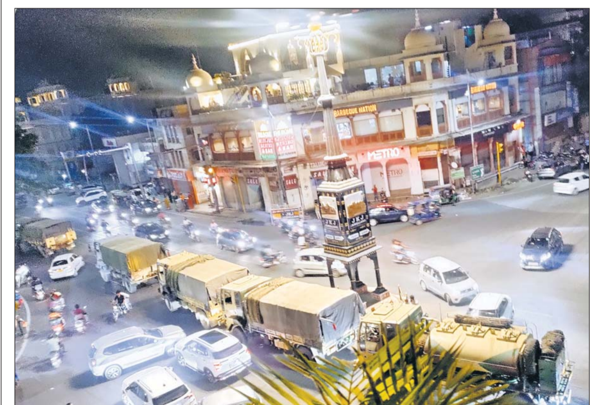
जयपुर में पांच बत्ती के पास रविवार रात 10 बजे आर्मी के एक ट्रक के खराब हो जाने से लंबा जाम लग गया। इससे आम लोगों को काफी परेशानी का सामना करना पड़ा।