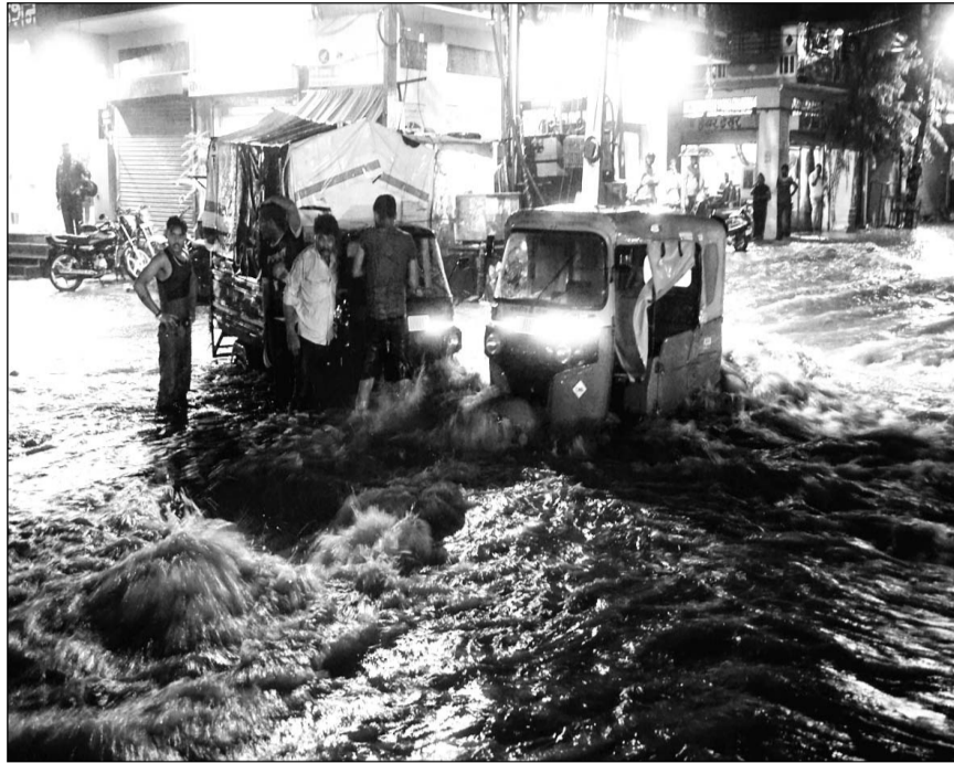
सीकर रोड पर बी.आर.टी.एस. कॉरिडोर और उसके दोनों तरफ पानी भरने से दोपहिया व तीन पहिया वाहन चालक फंस गये।

जयपुर में सुबह 9 बजे से रात 8 बजे तक 4 इंच से ज्यादा बारिश दर्ज की गई। सबसे ज्यादा जे.एल.एन. मार्ग पर 111.50 मिमी (करीब 4 इंच), सांगानेर में 74 मिमी, कलेक्टर पर 55 मिमी, चौम में 27 मिमी और आमेर में 12 मिमी बारिश हुई। इसके अलावा जयपुर के नरना में 20 तथा फागी में 12 मिमी बरसत दर्ज हुई।