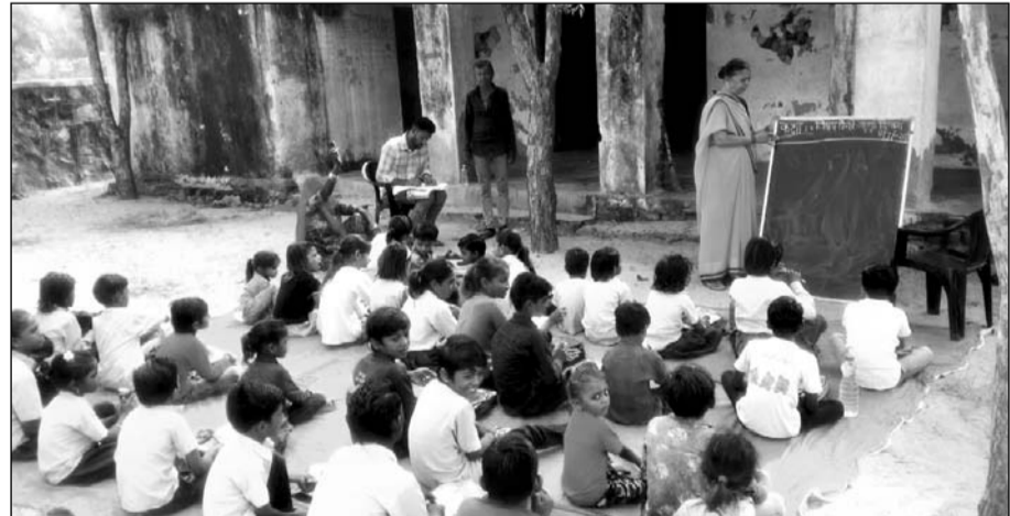
भीनमाल के निकटवर्ती सेवड़ी गांव स्थित मामाजी का घोरा प्राथमिक विद्यालय में बरामदे के बाहर बच्चों को पढ़ाया जा रहा है।

व एक छोटा सा कार्यालय का निर्माण शिक्षा विभाग द्वारा करवाया गया था। उसके बाद वर्ष 2005 में वर्ष 2011 में एक एक कमरे का निर्माण भी शिक्षा विभाग द्वारा करवाया गया था। वर्तमान में हालत यह है कि 2011 में बना कमरा तो पूर्ण रूप से जर्जर हो चुका है तथा इस कक्ष को हर वक्त बंद ही रखा जाता है। इस कक्ष के ऊपर रखी गई पट्टियों की दरारें सीमेंट से नहीं भरे जाने के कारण बारिश में पूरी बरसती रहती है। न ही इस कक्ष के बाहर की ओर प्लास्टर करवाया गया है। जबकि इससे पूर्व में बने दोनों कमरों में प्लास्टर पूर्ण रूप से उखड़ गया है। विद्यालय का कार्यालय, बरामदा व