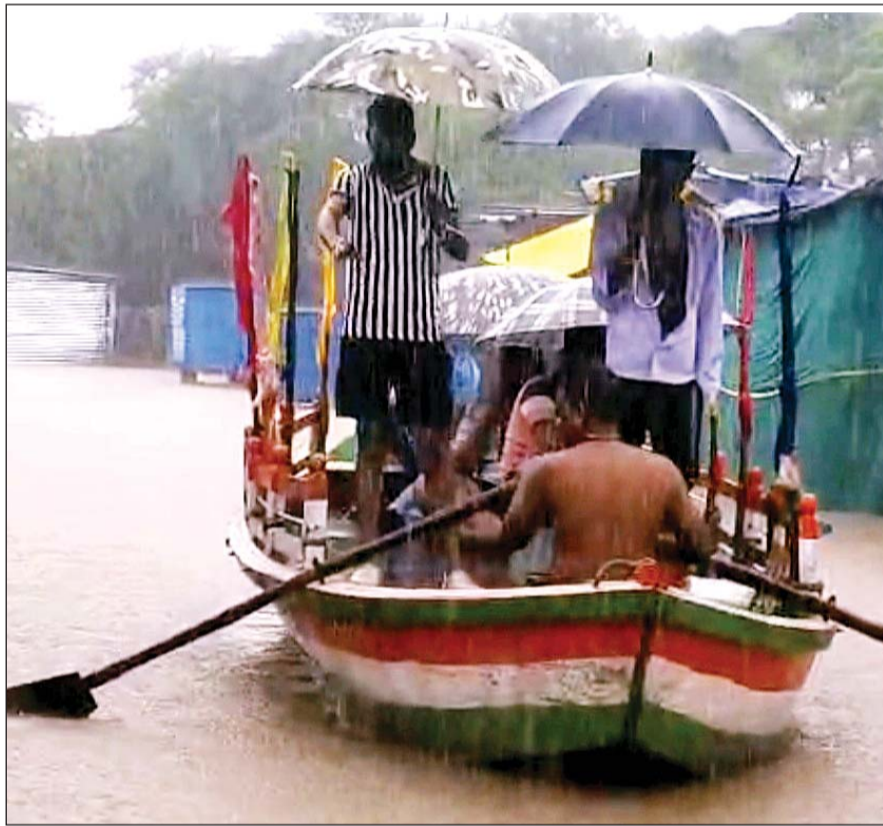
बिजौलियां के तिलस्वां में भारी बारिश से एरु नदी में उफान आ गया जिससे बाढ़ के हालात बन गये। सड़कों पर चार से पांच फीट पानी भर जाने से सड़क पर नाव से लोगों का रस्क्यू किया गया।

मांडलगढ़ में लगातार बारिश के दौर और नदियों के उफान और कई बाँधों की चादर चलने से सड़कों की पुलियाओं पर पानी आ गया है, जिससे बरुनंदनी, जोजवा, मानपुरा, श्यामपुरा सहित दो दर्जन से अधिक गाँवों का सड़क सम्पर्क टूट गया है। मैनाली, बेडुच, बनारस नदी का जल स्तर भी बढ़ गया है। मांडलगढ़ के पास नदी नैनी पुलिया पर पानी का तेज बहाव होने के बावजूद एक ट्रेलर चालक जान जोखिम में डाल कर ट्रेलर नदी में जा रहा था और हादसा हो गया। पुलिया के पानी में फिसल कर ट्रेलर नदी में जा गया, गनीमत रही कि ट्रेलर का चालक तैर कर बाहर निकल गया, जिससे उसकी जान बच गई।