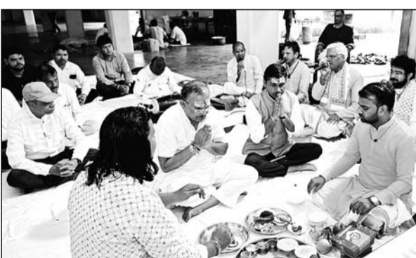
विधानसभा अध्यक्ष देवनानी (बीच में) ने शिव जलाभिषेक, सहस्र घट, रुद्राभिषेक करके महाआरती की शुरुआत की।

जयपुर। राजस्थान विधानसभा परिसर स्थित विधानेश्वर महादेव मंदिर में श्रावण मास के सोमवार के पावन पर्व पर सहस्र घट, रुद्राभिषेक और महाआरती का आयोजन किया गया। यह आध्यात्मिक अनुष्ठान विधानसभा अध्यक्ष वासुदेव देवनानी की प्रेरणा और