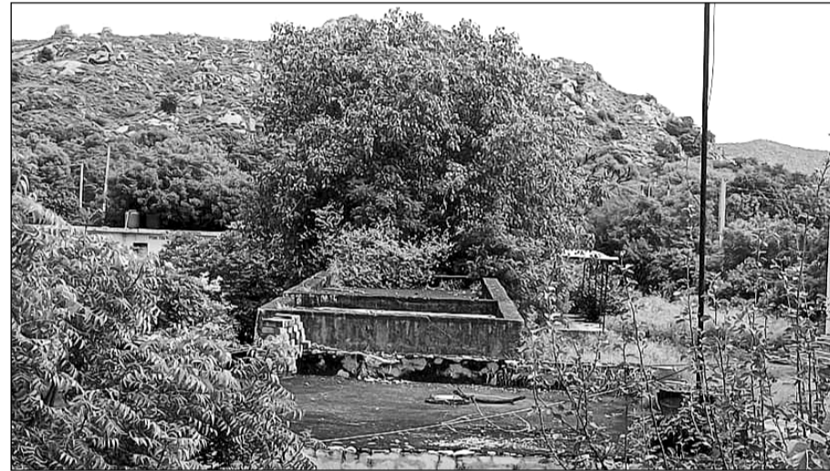
विराटनगर के ग्राम पापड़ा में संचालित महात्मा गांधी रा. उ. मा. स्कूल के कमरों के हालात खराब हैं।

लगभग 80-90 वर्ष पूर्व विद्यालय में सात कमरों का निर्माण कराया गया था, ज्योकि वर्तमान में क्षतिग्रस्त हो गए हैं और कभी भी गिर सकते हैं। इन कमरों की जर्जर अवस्था को देखते हुए व किसी घटना की आशंका से प्रधानाचार्य द्वारा इन क्षतिग्रस्त सात कमरों को बंद कर दिया है। ये सात कमरे पूरी तरह से जर्जर होने के कारण सुरक्षा के लिहाज से बंद कर दिये गये हैं, ये कभी भी जमींदोज हो सकते हैं। ग्रामीणों ने मुख्यमंत्री राजस्थान सरकार को पत्र लिखकर इन क्षतिग्रस्त सात कमरों को हटवाने की मांग की है। ग्रामीणों ने बताया कि पूर्व में भी कई बार स्कूल के हालात को उच्च अधिकारियों व जनप्रतिनिधियों के सामने रखा