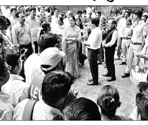
उपमुख्यमंत्री दिया कुमारी (बीच में) ने सिविल लाइंस स्थित कार्यालय में जनसुनवाई की।

■ जनसुनवाई में आए लोगों ने मुख्य रूप से बिजली, पानी, सड़क, नाली और स्थानीय प्रशासन से जुड़ी समस्याएं रखीं।