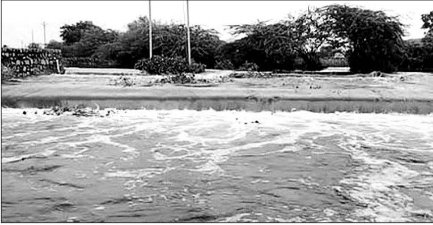
अजमेर में भारी बरसात से कई नदी-नालों में पानी की आवक हुई।

सोमवार को अजमेर शहर सहित जिलेभर में तेज बारिश का अलटं जारी किया गया था। तेज बारिश से पहाड़ों का पानी बांडी नदी के जरिए आनासागर झील से लगातार आ रहा है, जिससे झील से प्रशासन द्वारा निरंतर पानी की निकासी की जा रही है। एक्केप चैनल में तेज