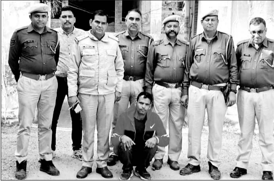
युवक की हत्या के मामले में शाहपुरा पुलिस ने आरोपी को गिरफ्तार किया।