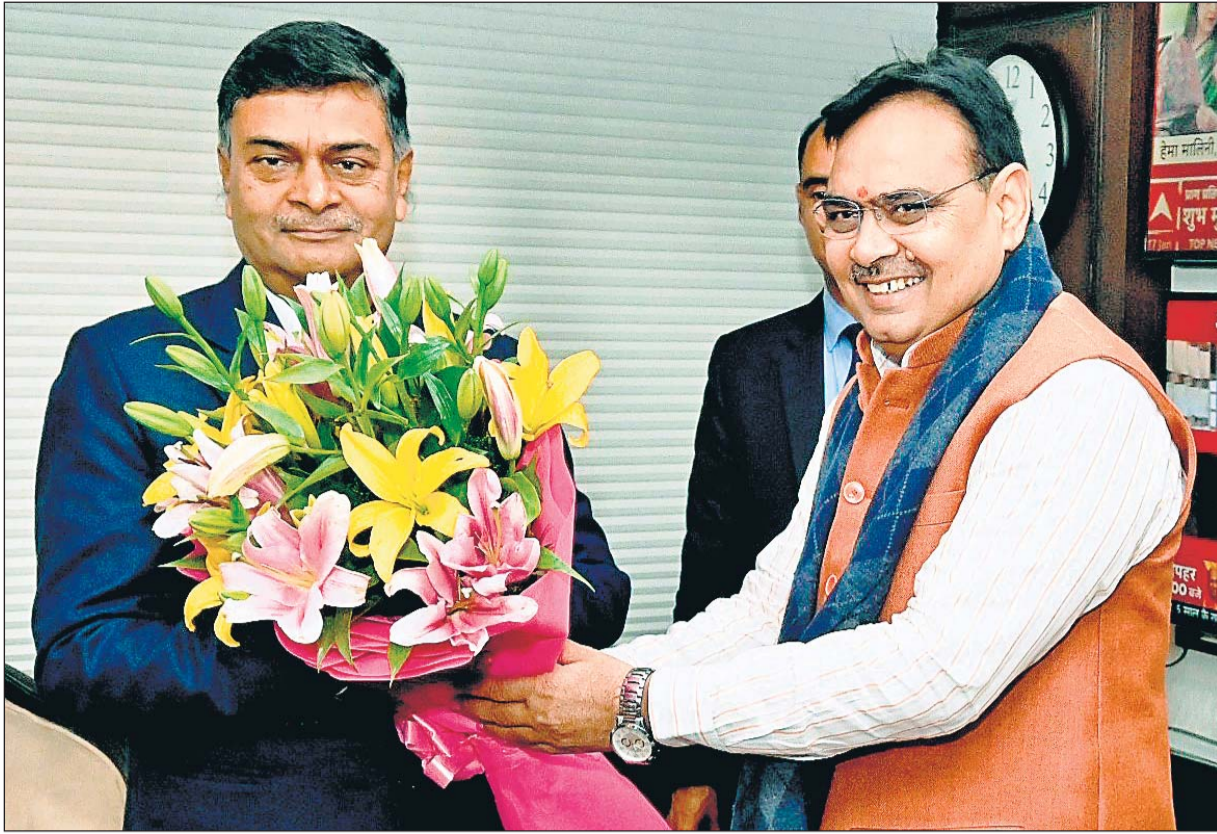
मुख्यमंत्री भजनलाल शर्मा ने बुधवार को नई दिल्ली के श्रम शक्ति भवन में केन्द्रीय ऊर्जा मंत्री आर.के. सिंह से मुलाकात की।