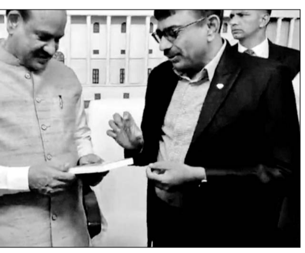
लोकसभा अध्यक्ष ओम बिरला ने पुस्तक 'डिकोडिंग द वेदिक' पुस्तक का अवलोकन किया गया।

फलस्वरूप, सनातन धर्म प्रासंगिकता बहुत बढ़ गई है। लेखक ने वैज्ञानिक और तार्किक आधार पर वैदिक ज्ञान और सनातन धर्म की प्रासंगिकता पर इसके महत्व और ज्ञान पर विस्तृत रूप में लिखने का उल्लेखनीय प्रयास किया है।