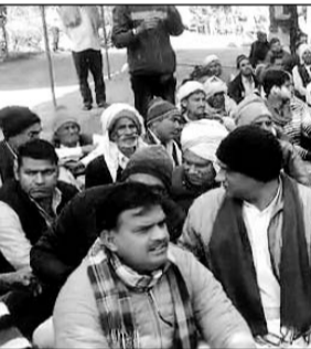
भरतपुर-धौलपुर के जाट समाज को आरक्षण के लाभ की मांग को लेकर महापड़ाव शुरू हुआ।

भरतपुर, (निसं)। भरतपुर-धौलपुर के जाट समाज को केंद्र में ओबीसी के आरक्षण के लाभ की मांग को लेकर बुधवार से जयचौली स्टेशन के पास महापड़ाव शुरू हो गया है। जाट समाज के लोगों ने गांव जयचौली में महापड़ाव डाल दिया है।