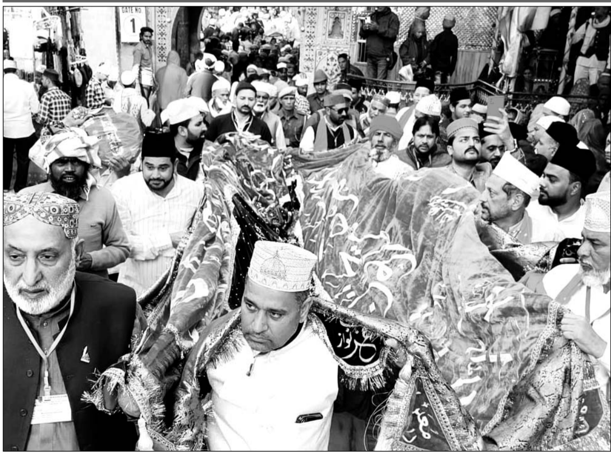
पाकिस्तानी जायरीन की ओर से मखमली चादर और अकीदत के फूल पेश किए गये।

पाकिस्तानी जायरीन ने दोनों मुल्कों के आपसी रिश्तों के लिए दुआ मांगी