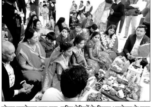
मोशन एजुकेशन द्वारा मूक-बधिर बेटियों के विवाह आयोजन के तहत विनायक स्थापना की गई।