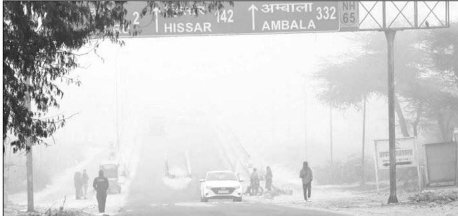
शेखावाटी में सवेरे दस बजे तक कोहरा छाया रहा। साथ ही यहां कंपकंपा देने वाली सर्दी रही।

सेल्सियस की बढ़ोतरी हुई है। मौसम विभाग के अनुसार बुधवार को चूरू में अधिकतम तापमान 22.6 डिग्री सेल्सियस और न्यूनतम तापमान 6.6 डिग्री सेल्सियस दर्ज हुआ है। यहां शाम ढलने से पहले एक बार सर्दी ने अपने तेवर दिखाते शुरू कर दिए। शेखावाटी में किसानों को बारिश का इंतजार है। बारिश के अभाव में विरानी चने की फसल दिनों-दिन खराब हो रही है। किसान चिंतित दिखाई देने लगे हैं।