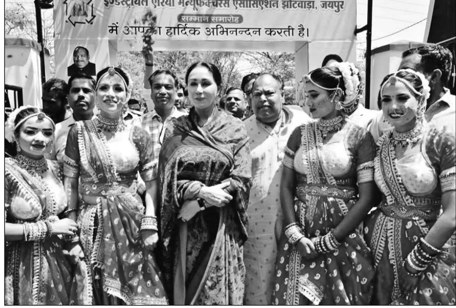
उपमुख्यमंत्री दिया कुमारी ने सोमवार को इंडस्ट्रियल एरिया मैनुफैक्चरिंग एसोसिएशन झोटावाड़ा के होली मिलन सम्मान समारोह में शामिल हुईं।

जयपुरा उ.प. मुख्यमंत्री दिया कुमारी ने आज झोटावाड़ा इंडस्ट्रियल एरिया मैनुफैक्चरिंग एसोसिएशन के सम्मान समारोह में शिरकत की। यह सम्मान समारोह होली मिलन और बजट में बेहतरतम घोषणाओं के लिए अभिवादन स्वरूप रखा गया था। इस दौरान उद्योगियों और व्यापारियों ने अपनी तमाम मांगे उपमुख्यमंत्री के समक्ष रखीं, साथ ही बजट में उद्योगों के लिए की गई घोषणाओं पर धन्यवाद भी ज्ञापित किया। खास तौर पर वेयरहाउस को उद्योगों का दर्जा मिलने को लेकर व्यापारी काफी खुश नजर आए। साथ ही साथ विद्याधर नगर विधानसभा क्षेत्र के इलाकों में पानी भरने की समस्या को लेकर डूनेज सिस्टम को सुधारने के प्रयासों के लिए सभी ने उपमुख्यमंत्री को धन्यवाद दिया। इस दौरान उपमुख्यमंत्री और व्यापारियों के बीच एक सौहार्दपूर्ण संवाद भी हुआ, जिसमें उन्होंने कहा कि 2014 के बाद जो निर्णय लिए गए हैं वह निर्णय लेने में पिछली सरकारों नाकामयाब रही और हिम्मत नहीं दिखा पाई। चाहे वह वक्रफ बोर्ड का मामला हो, राम मंदिर का मामला हो, 370 का मामला हो, महिला