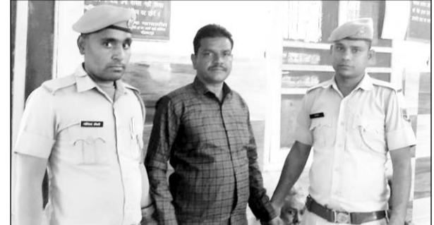
पुलिस ने डोडा-चूरा तस्करी के आरोपी को कोर्ट में पेश किया।