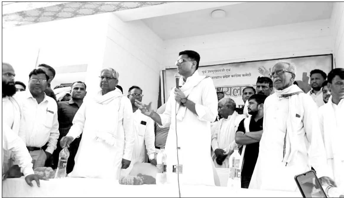
पाटन में कार्यकर्ताओं को पूर्व उप मुख्यमंत्री सचिन पायलट ने संबोधित किया।

पाटन, (निर्स)। उदयपुरवाटी में स्थित मनसा माता की पहाड़ी में टेक्टर-टोली पलटने से गंभीर हादसा हो गया था जिसमें आधा दर्जन से अधिक लोगों की मौत हो गई थी। उन सभी मृतकों के परिजनों को ढांडस बंधाने जाते हुए पूर्व उपमुख्यमंत्री सचिन पायलट नीमकाथाना रोड पर स्थित तहसील कार्यालय के पास बने नवनिर्मित अंबेडकर छात्रावास में कार्यकर्ताओं से मिले और उनकी समस्याएं सुनीं।