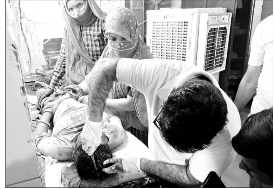
घायलों का अस्पताल में उपचार किया गया।

प्राथमिक उपचार के बाद एक घायल को टॉक से जयपुर रेफर किया