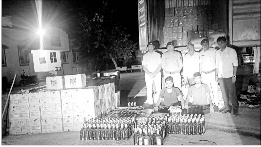
मंडार के निकट गुजरात बॉर्डर पर अवैध शराब सहित दो आरोपियों को गिरफ्तार किया।

मंडार के समीप गुंदरी चेक पोस्ट पर पाथावाडा पुलिस ने नाकाबंदी के दौरान की कार्रवाई