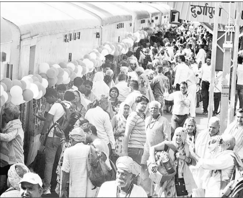
जयपुर के दुर्गापुरा रेलवे स्टेशन से वरिष्ठ नागरिक तीर्थ यात्रा योजना के तहत रामेश्वरम्-मुदरई जाने वाले यात्रियों को परिचय देने के लिए यात्रा शुरू की गई।

जयपुर। मुख्यमंत्री अशोक गहलोत ने कहा कि वरिष्ठ नागरिक हमारी अमूल्य धरोहर हैं। भारतीय संस्कृति में बुजुर्गों को विशेष आदर और सम्मान दिया जाता है। इन्हें भावनाओं के साथ हमने जिम्मेदारी निभाते हुए अगस्त, 2013 में वरिष्ठ नागरिक तीर्थ यात्रा योजना की शुरुआत की थी। उस समय 41 हजार यात्रियों को विभिन्न स्थलों पर भेजकर दर्शन कराए गए। अब तक