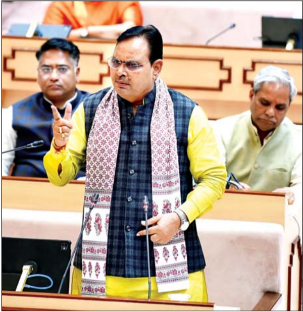
मुख्यमंत्री भजनलाल शर्मा के प्रयासों से सदन में सात दिनों से चल रहा गतिरोध खत्म हो गया है। मुख्यमंत्री ने कहा सदन चलना सत्ता और विपक्ष दोनों की जिम्मेदारी है।

मुख्यमंत्री भजनलाल ने सदन में कहा कि जनप्रतिनिधि के प्रति जनता में जो भाव है, उसे ध्यान में रखना होगा। हमारे किसी सदस्य के मुंह से गलत बात निकलती है तो उसको भी रात को नींद नहीं आएगी, उसे पश्चाताप होता है। हम कुछ भी बोलें, सोच विचार कर बात रखनी चाहिए। शर्मा ने कहा कि सदन चलना सत्ता और विपक्ष दोनों की जिम्मेदारी है। मैं तो कहता हूँ, 200 विधायकों की जिम्मेदारी है। मुख्यमंत्री ने कहा कि विपक्ष का हमारा कोई विधायक अगर अच्छा बोलता है तो मैं उसे फोन करके बधाई देता हूँ। मैंने नेता