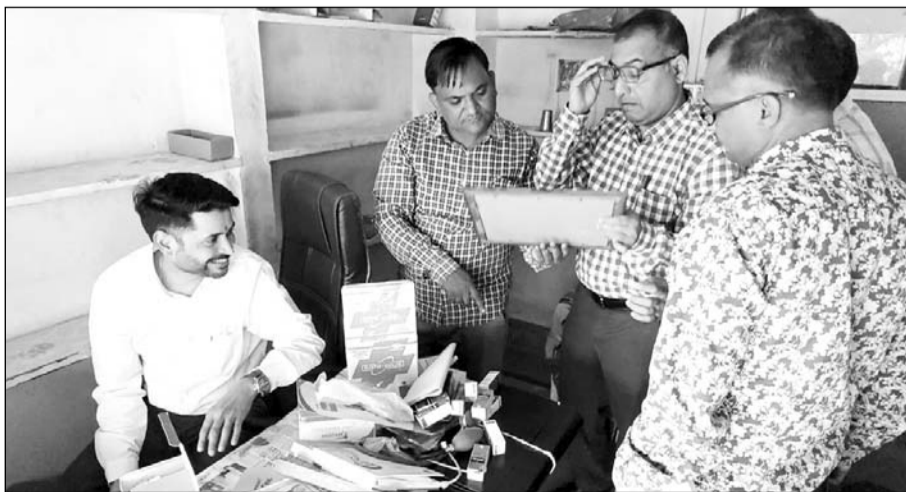
भीलवाड़ा। सोनोग्राफी सेंटर पर छापा मारकर जांच की।