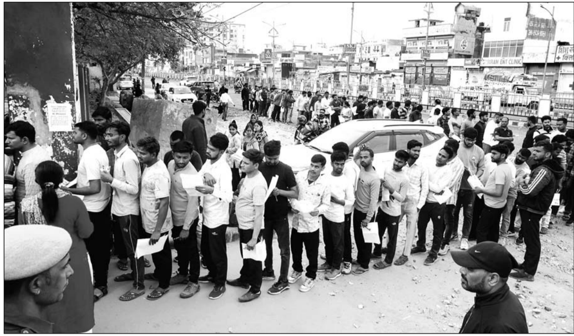
राजस्थान अध्यापक पात्रता परीक्षा रीट 2024 गुरुवार को दो पारियों में आयोजित की गई। परीक्षा सेंटर पर पहुंचने में स्टूडेंट्स को बहुत परेशानी का सामना पड़ा क्योंकि सहर की सड़कें विकास कार्यों के चलते इर तरफ खोद के छोड़ दी गई हैं। एरजाम शुरू होने से एक घण्टे पहले एंटी बंद करने से कुछ भागकर पहुंचे तो कुछ रह गए। लंबी लाइन भी लगी।