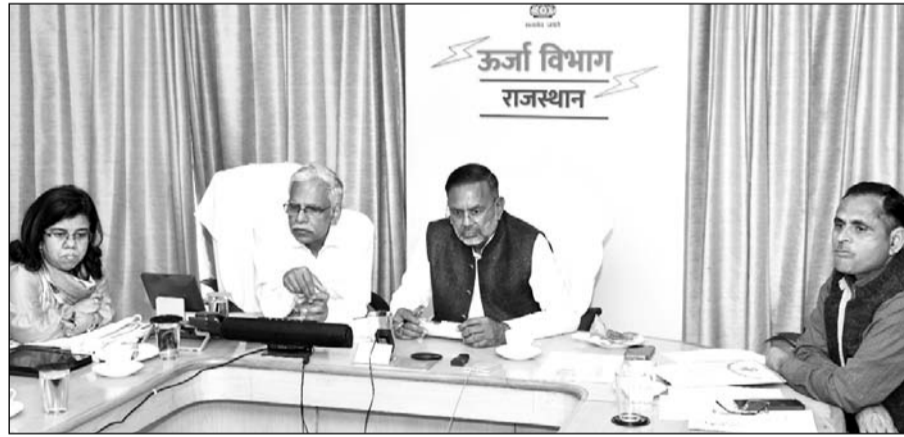
ऊर्जा राज्यमंत्री हीरालाल नागर ने गुरुवार को विद्युत भवन से वीडियो कॉन्फ्रेंस के माध्यम से 'वॉयबिलिटी ऑफ डिस्ट्रीब्यूशन यूटिलिटीज' विषय पर मंत्री समूह की बैठक को संबोधित किया।

नागर गुरुवार को विद्युत भवन से वीडियो कॉन्फ्रेंस के माध्यम से 'वॉयबिलिटी ऑफ डिस्ट्रीब्यूशन यूटिलिटीज' विषय पर मंत्री समूह की बैठक को संबोधित करते थे। केन्द्रीय नवीन एवं नवीकरणीय ऊर्जा राज्यमंत्री श्रीपाद यशो नायक की अध्यक्षता में मुम्बई के सहयात्री विश्रांतिगृह में हुई