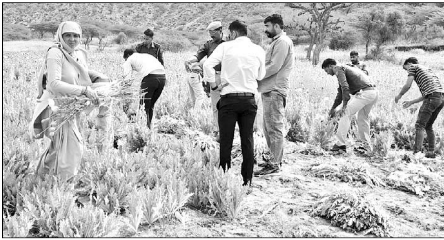
परबतसर पुलिस ने खेत में की जा रही अफीम की खेती को जप्त किया।