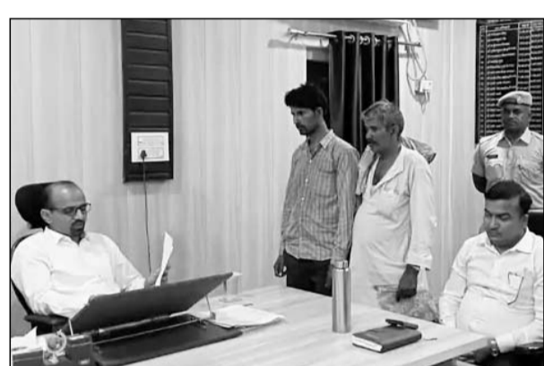
गंगापूर सिटी में जन सुनवाई करते जिला कलेक्टर।