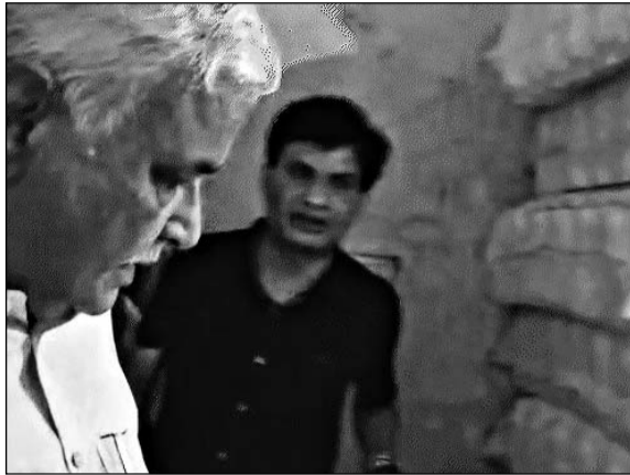
कृषि मंत्री डॉ. किरोड़ीलाल मीणा ने गुरुवार को कानोता क्षेत्र स्थित हीरावाला रीको औद्योगिक क्षेत्र में संचालित 'जयपुर बायो फर्टिलाइजर्स' इकाई पर औचक निरीक्षण कर कार्रवाई की।

-कार्यालय संवाददाता- जयपुर। प्रदेश में नकली खाद और बीज के कारोबार के खिलाफ चलाए जा रहे विशेष अभियान के तहत कृषि मंत्री डॉ. किरोड़ीलाल मीणा ने गुरुवार को जयपुर के कानोता क्षेत्र स्थित हीरावाला रीको औद्योगिक क्षेत्र में संचालित 'जयपुर बायो फर्टिलाइजर्स' इकाई पर औचक निरीक्षण कर बड़ी कार्रवाई की। मंत्री के आचानक पहुंचने