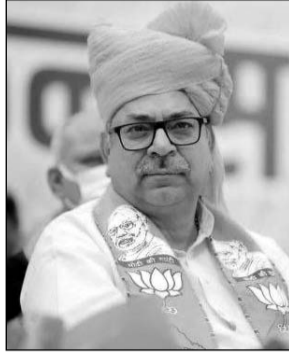
डॉ. सतीश पुनिया

प्रधानमंत्री नरेंद्र मोदी के नेतृत्व में पिछले बारह वर्षों में भारत ने एक विकसित, आत्मविश्वास से लबरेज और दुनिया की आंखों में आंखें डालकर बात करने वाले मजबूत राष्ट्र के रूप में पहचान कायम की है। भारत के आर्थिक, सामाजिक और सांस्कृतिक उथान की गथाएं दुनिया की जुबान पर हैं। अब वह दौर नहीं रहा, जब आतंक फैलाने वाले मुल्क को देश में आतंकी घटनाओं में उसकी स्पष्ट संलिप्तता के बावजूद भी उसे दंडित करने के स्थान पर उसको डोबियर पर डोबियर सीपा जाए, अब सीधी और स्पष्ट कार्रवाई होती है। यह सब संभव हुआ है एक कुशल, विजयी और राष्ट्र प्रथम की भावना वाले नेतृत्व के कारण।