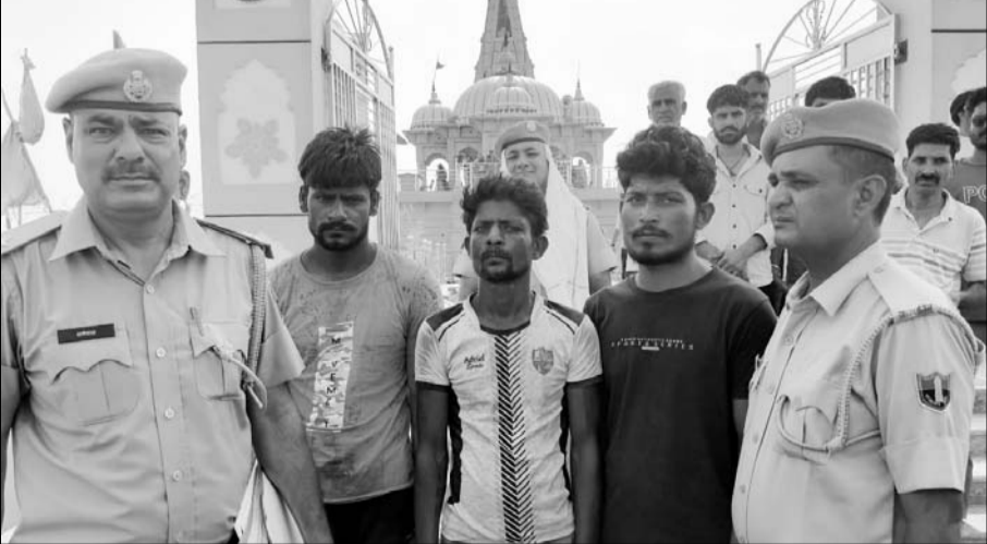
पुलिस ने मौके पर आरोपियों से सीन रिक्रिएशन कराकर साक्ष्य जुटाए और वारदात की तस्वीर की।