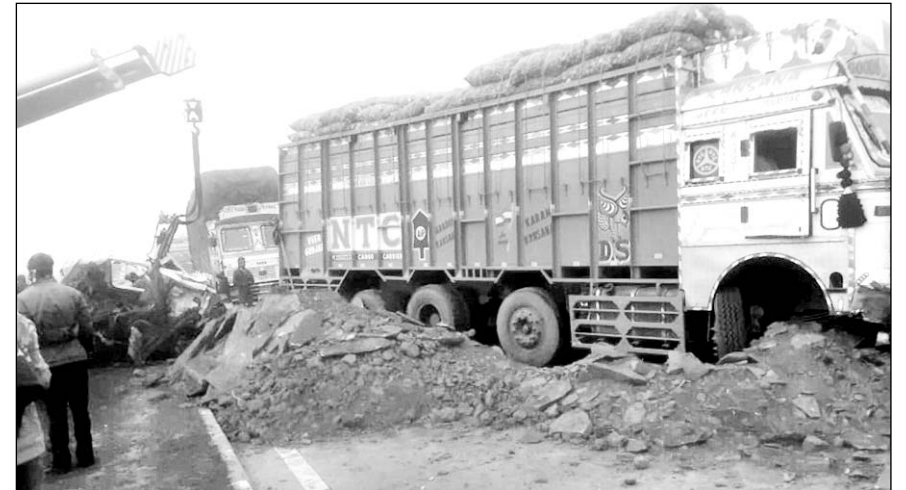
कोटा बाइपास पर हुये सड़क हादसे में एक ट्रक क्षतिग्रस्त हो गया।

कोटा, (निर्सं।) नेशनल हाईवे-27 के कोटा बाइपास पर तीन अलग-अलग हादसे हुए हैं, जहां पर हाईवे पर पड़े मलबे और घने कोहरे के चलते आठ वाहन टकराए गए। इनमें दो ट्रक, एक बलगर, एक ट्रेलर, एक कंटेनर, एक डम्पर, एक कार और एक एंबुलेंस शामिल हैं। इनमें एक ट्रक चालक की मौत हो गई, जबकि अन्य चालक और खलासी सहित वाहनों में सवार कुछ लोग घायल हो गए।