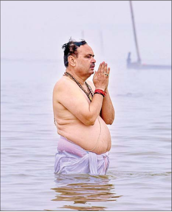
मुख्यमंत्री भजनलाल शर्मा ने रविवार को महाकुंभ में त्रिवेणी संगम घाट पर स्नान किया। उन्होंने सपरिवार मांगंगा की पूजा अर्चना कर देश और प्रदेश में सुख-समृद्धि की कामना की।

मुख्यमंत्री भजन लाल शर्मा ने राजस्थान के यात्रियों को राज्य सरकार द्वारा अल्पकालिक प्रवास के लिए सुविधाएं प्रदान करने के उद्देश्य से निर्मित किये गए राजस्थान मंडप में ही रात्रि