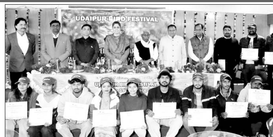
बर्ड फेस्टिवल में विभिन्न प्रतियोगिताओं के विजेताओं को अतिथियों ने सम्मानित किया।