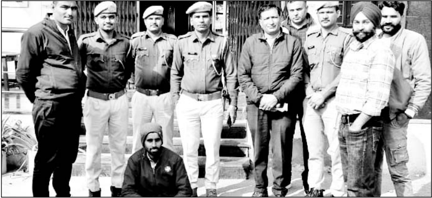
हमीरगढ़ थाना पुलिस ने युवक की हत्या के मामले में साथी युवक को गिरफ्तार किया।

बाद में पता चला कि युवक मूलरूप से उत्तरप्रदेश के अमेठी जिले के पुलिस थाना बाजार शुक्ल के गांव पूरमोला का रहने वाला है। इसके बाद पुलिस ने जांच का दायरा बढ़ाते हुये पड़ताल शुरू की। टीम को अहम सुराग हाथ लगे। टीम को समस्तीपुर, बिहार