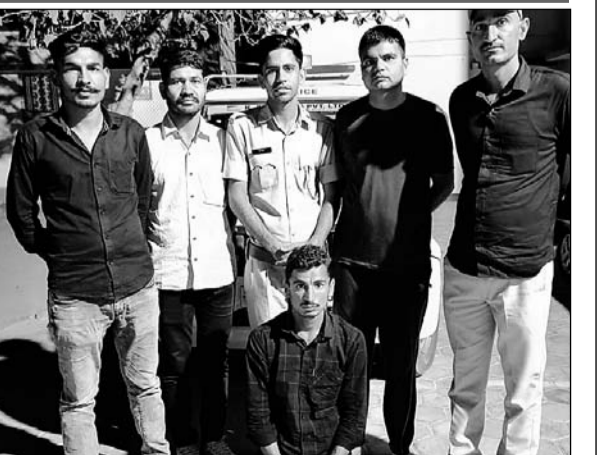
पुलिस ने नकली विग लगाकर परीक्षा देने वाले को गिरफ्तार किया।

■ आरोपी की गिरफ्तारी के बाद नकल के कई मामलों का खुलासा होने की उम्मीद