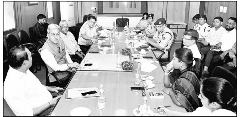
मुख्य सचिव सुधांशु पंत ने मंगलवार को शासन सचिवालय में जयपुर शहर की यातायात व्यवस्था के सम्बन्ध में अधिकारियों की बैठक ली।

जयपुर, (का.सं.)। मुख्य सचिव सुधांशु पंत ने कहा कि जयपुर शहर में ट्रैफिक व्यवस्था को सुगम और सुरक्षित बनाने के लिए सभी सम्बंधित विभागों को सम्बन्धित होकर तेजी से कार्य करना होगा। उन्होंने कहा कि जयपुर की सड़कों पर निर्बाध व सुचारू ट्रैफिक संचालन के लिए विशेष अभियान चलाकर आमजन को जल्द राहत प्रदान करें। पंत मंगलवार को शासन सचिवालय में जयपुर शहर की यातायात व्यवस्था के सम्बन्ध में आयोजित बैठक की अध्यक्षता कर रहे थे। उन्होंने कहा कि शहर में अधिकाधिक नई सार्वजनिक पार्किंग के निर्माण के लिए कार्ययोजना बनाएं और मौजूदा सार्वजनिक पार्किंग स्थानों की पूरी उपयोगिता सुनिश्चित करें। उन्होंने मैरिज गार्डन, होटल्लस, रेस्टोरेन्ट आदि की सुदृढ़ पार्किंग व्यवस्था हेतु आवश्यक कानूनी कार्रवाई अमल में लाने के लिए भी निर्देश दिए।