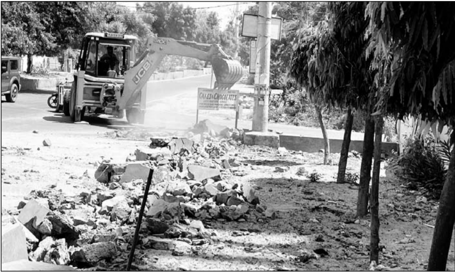
जेसीबी की मदद से करीब पांच स्थानों से अवैध अतिक्रमण हटाने की कार्रवाई को अंजाम दिया।

उपायुक्त ने बताया कि कई समय से एडीए की भूमि पर अतिक्रमण होने की जानकारी मिल रही थी, जिस पर कार्रवाई करते हुए मंगलवार को एडीए पुलिस जाने के साथ पंचशाल स्थित शिव मंदिर के पास लोहे की फेंसिंग को हटाकर लेवलिंग की और विजय सरिता अपार्टमेंट के सामने सड़क भाग में बनाई जा रही चार द्वारी को तोड़ा गया तो वही कोटडा में एडीए की व्यवसायिक भूमि पर कोटडी बनाकर किए गए अतिक्रमण को ध्वस्त किया गया तथा ईडब्ल्यूएस के पास प्राधिकरण की खाली पडी भूमि पर बनी हुई कोटडियों को हटाने की कार्रवाई तो वही हरिभाऊ उपाध्याय स्थित शिव रेजिडेंसी के पास