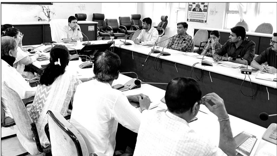
जिला कलेक्ट्रेट सभागार में विभिन्न विभागों की साप्ताहिक समीक्षा बैठक का आयोजन किया गया।

भीलवाड़ा, (निर्स)। जिला कलक्टर नमित मेहता की अध्यक्षता में मंगलवार को जिला कलेक्ट्रेट सभागार में विभिन्न विभागों की साप्ताहिक समीक्षा बैठक का आयोजन किया गया। बैठक में विभिन्न विभागों की फ्लैगशिप योजनाओं, 100 दिवसीय कार्ययोजना की प्रगति, संपर्क पोर्टल पर विभिन्न विभागों के लंबित प्रकरणों, फ्लैगशिप योजनाओं की प्रगति की समीक्षा की गई।