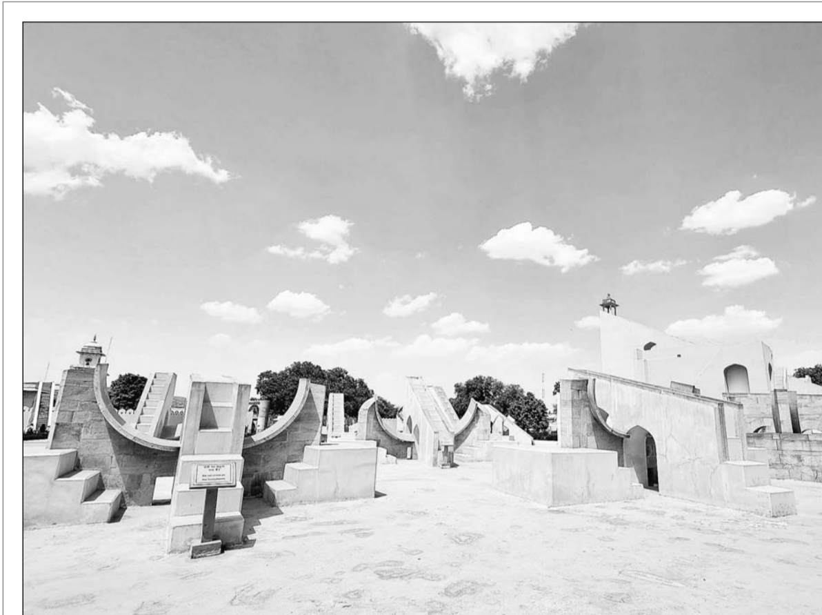
मौसम विभाग ने आगामी तीन दिन तापमान में बढ़ोतरी के साथ हीट वेव की चेतावनी जारी की है। अभी मौसम शुष्क होने से गर्मी में सब जगह सूना-सूना नज़र आ रहा है। जंतर-मंतर जो हमेशा पर्यटकों की आवाजाही से गुलजार रहता था, मंगलवार को खाली-खाली नज़र आ रहा है।