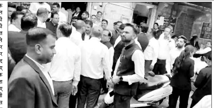
कोर्ट नोटिस की पालना करने के लिए जाते हुए कर्मचारी व वकील।