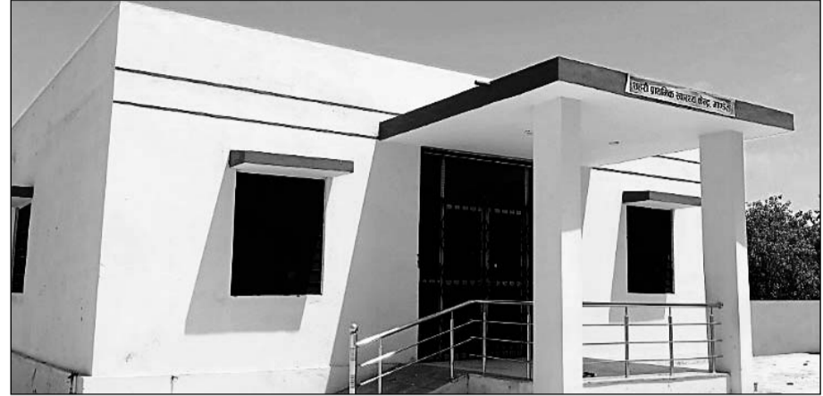
माण्डेता स्थित अस्पताल का नव निर्मित भवन।