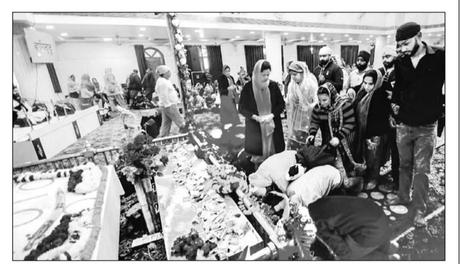
जयपुर के राजापाक गुरुद्वारे में गुरु गोविन्द सिंह जयंती पर विशेष रूप से सजाया गया और विशेष पूजा की गई। वहीं सुबह से ही अटूट लंगर बरताया गया।

जिलों का दर्जा समाप्त कर दिया गया है। गंगपुर सिटी से जिला का दर्जा समाप्त करने के पीछे भी सरकार की राजनीतिक द्वेषता ही है। याचिका में कहा गया कि सरकार ने करीब डेढ़ साल पहले गंगपुर सिटी को जिला बनाया था और उसके बाद यहाँ कई प्रशासनिक नियुक्तियाँ हो चुकी हैं। वहीं विभाग भी बतौर जिला स्तर पर काम कर रहे हैं। कमेटी ने लोगों से आपत्तियाँ मांगने के बाद इसे जिला घोषित किया था। ऐसे में अब महज राजनीतिक द्वेषता के चलते इसे जिला निरस्त करना गलत है। गौरतलब है कि पूर्ववर्ती कांग्रेस सरकार ने अगस्त, 2023 में 3 नए संभाग और 19 जिलों का गठन किया था।