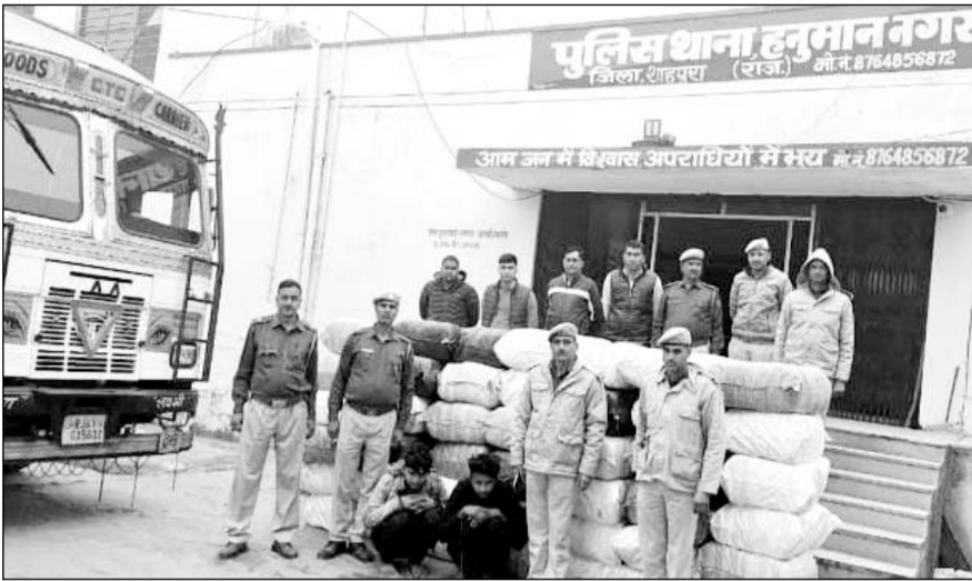
हनुमान नगर थाना पुलिस ने करोड़ों का गांजा बरामद कर तस्करों को गिरफ्तार किया।