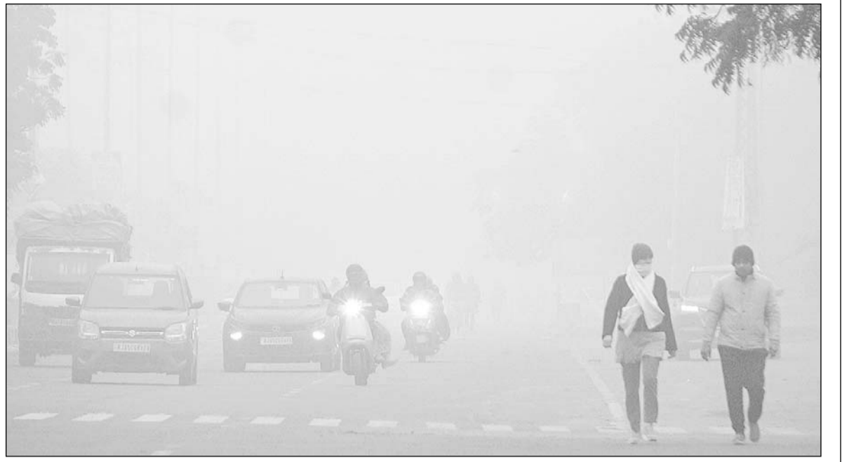
मौसम विभाग ने सोमवार को जयपुर सहित प्रदेश के कई जिलों में कोहरे का ऑरेंज अलर्ट जारी किया था जिसका जयपुर में भारी असर दिखाई दिया। कोहरे के कारण वाहनों की लाइट जलाने के बाद भी विजिलिबिलिटी बहुत कम होने से वाहन रेंग-रेंग कर चलते नजर आये।