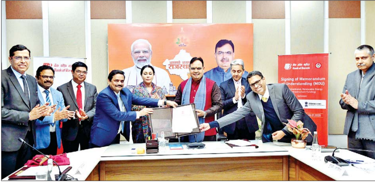
मुख्यमंत्री भजनलाल शर्मा की मौजूदगी में मुख्यमंत्री निवास पर बैंक ऑफ बड़ौदा तथा बैंक ऑफ महाराष्ट्र के साथ एमओयू हुआ। मुख्यमंत्री ने कहा कि राज्य सरकार ने 'विकसित राजस्थान 2047' के तहत पांच वर्षों की कार्य योजना बनाकर 'सर्वजन हिताय' आधारित समावेशी विकास का लक्ष्य रखा है।