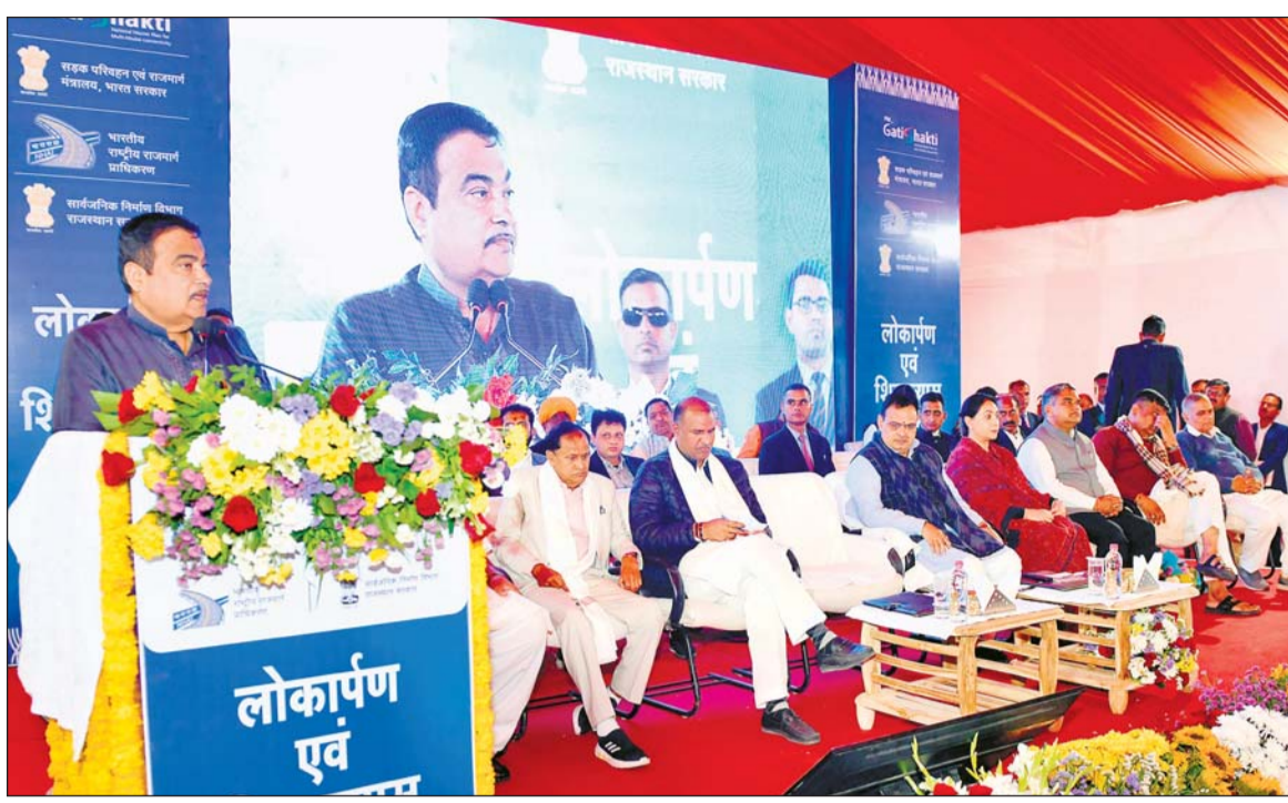
केन्द्रीय मंत्री नितिन गडकरी ने प्रधानमंत्री गति शक्ति परियोजना के तहत प्रदेश की 17 हाईवे एवं सड़क निर्माण परियोजनाओं का उदयपुर में शिलान्यास एवं लोकार्पण किया। इस मौके पर गडकरी ने उदयपुर के संदर्भ में कहा कि, उदयपुर में विकास की अपार संभावनायें हैं तथा इन परियोजनाओं से विशेषतः उदयपुर के एक्सपोर्ट उद्योग को और गति मिलेगी। गडकरी ने अपने संबोधन के दौरान जयपुर से दिल्ली के बीच इलैक्ट्रिक हाईवे बनाने की भी घोषणा की। इलैक्ट्रिक हाईवे के संदर्भ में उन्होंने कहा कि, यह देश में इस प्रकार का पहला हाईवे होगा। इस कार्यक्रम को मुख्यमंत्री भजनलाल शर्मा एवं उप मुख्यमंत्री दिया कुमारी ने भी संबोधित किया।