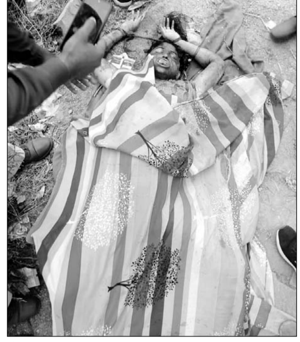
मौके पर पहुंची पुलिस ने शवों को बाहर निकाला।

■ पुलिस ने शवों को शिनाख्त के लिए अस्पताल की मोर्चरी में रखवाया