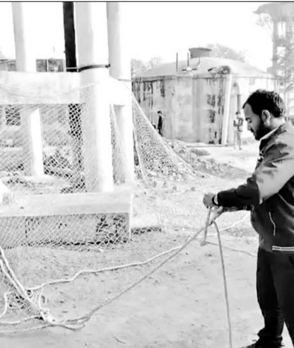
सिविल डिफेंस के कर्मचारियों व पुलिस प्रशासन ने मौके पर पहुंचकर सुरक्षा की दृष्टि से नीचे जाल लगाया।