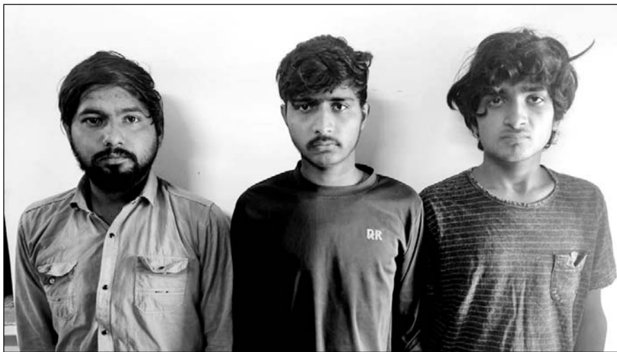
पुलिस ने अवैध पिस्टल व कारतूस के साथ तीन आरोपियों को दबोचा।