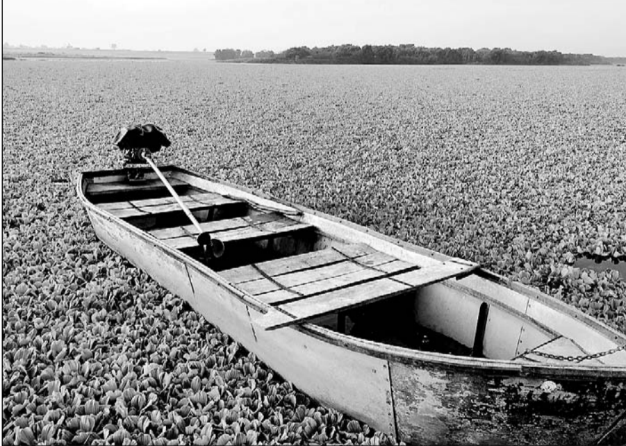
जामुनियां द्वीप पर छाईं जलकुम्भी परेशानी का सबब बन गई है।

बून्दी, (निर्सं) रामगढ़-विषधारी टाइगर रिजर्व के कोर क्षेत्र में बहने वाली सतानीरा चंबल नदी का पानी इन दिनों जलकुम्भी से अट गया है। बहते पानी के साथ यह विदेशी अवांछित जल वनस्पति जलीय जीवों के साथ-साथ नदी किनारे रहने वाले लोगों व जीवों के लिए भी परेशानी का सबब बन गई है।