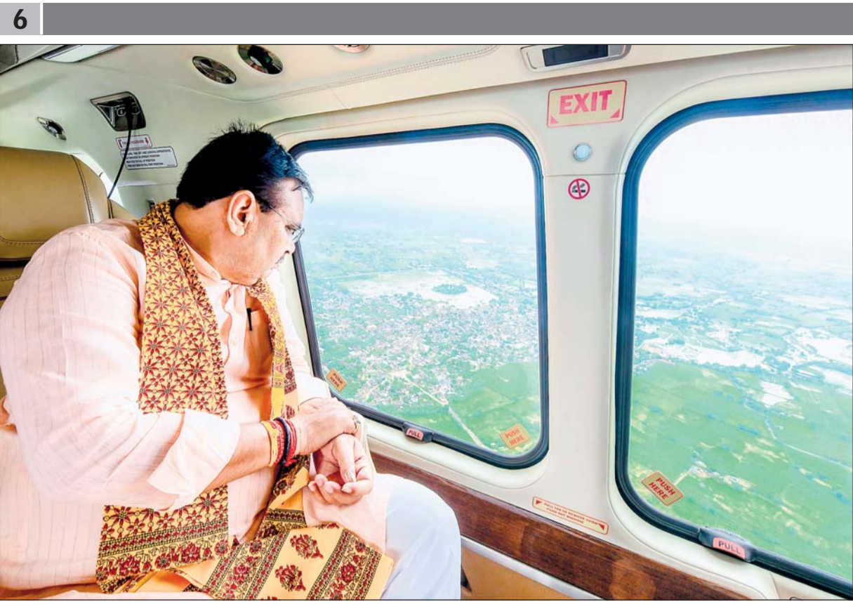
मुख्यमंत्री भजनलाल शर्मा ने मंगलवार को करौली, हिण्डौन व सपोटारा में अतिवृष्टि के कारण जलभराव प्रभावित क्षेत्रों का हवाई सर्वे किया।