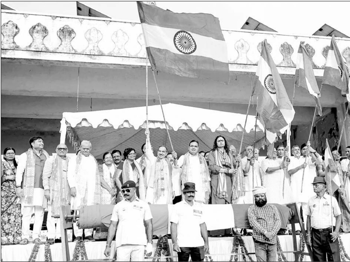
भाजपा की ओर से घर-घर तिरंगा अभियान का शुभारंभ मंगलवार को तिरंगा यात्रा से किया गया। एमआई रोड स्थित रामलीला मैदान में आयोजित तिरंगा यात्रा का शुभारंभ मुख्यमंत्री भजनलाल शर्मा, भाजपा प्रदेशाध्यक्ष मदन राठौड़, भाजपा प्रदेश सह प्रभारी विजया राहटकर ने हरी झंडी दिखाकर किया।

तिरंगा यात्रा के शुभारंभ अवसर पर भाजपा प्रदेशाध्यक्ष मदन राठौड़ ने कहा कि घर घर तिरंगा अभियान के तहत निकाली जा रही तिरंगा यात्रा का उद्देश्य देशवासियों में राष्ट्र प्रेम की भावना जागृत करना, राष्ट्रीय ध्वज के प्रति सद्भाव एवं स्वाधीनता के आंदोलन से जुड़े सेनानियों को याद