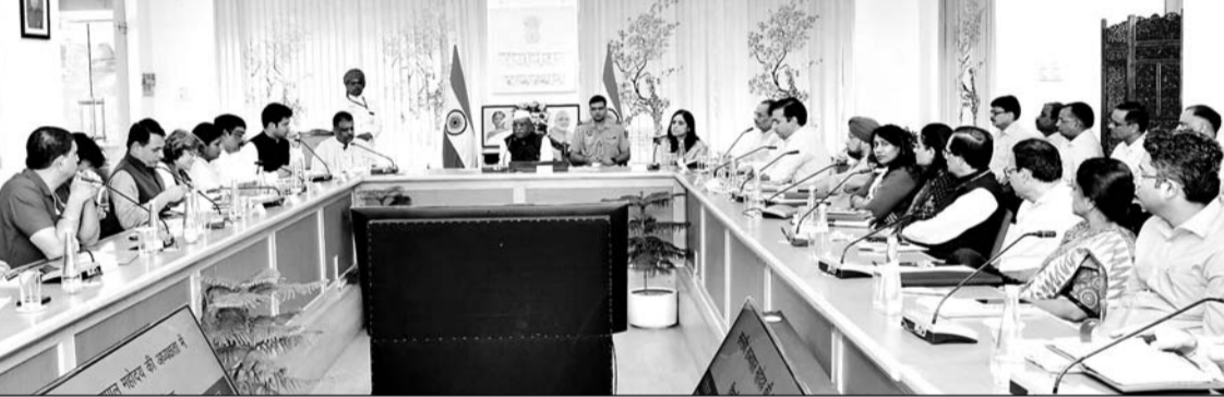
राज्यपाल हरिभाऊ बागड़े ने मंगलवार को राजभवन में चिकित्सा विभाग की समीक्षा बैठक ली। उनके साथ मंत्री गजेन्द्र सिंह खोंवसर और विभाग के आला-अधिकारी मौजूद थे।

तुरंत कार्यवाही करने और पदोन्नतियां भी यथासमय करवाने के निर्देश दिए हैं। राज्यपाल ने टीबी मुक्त राजस्थान के लिए अभियान चलाकर कार्यवाही किए जाने के भी निर्देश दिए हैं। उन्होंने तहसील, गांव और जिला स्तर पर इस संबंध में विशेष कार्य करने और अगले तीन साल में राजस्थान को पूरी तरह से टीबी मुक्त करने के लिए सबको मिलकर प्रयास करने के निर्देश दिए। राज्यपाल ने प्रदेश के जनजातीय और ग्रामीण क्षेत्रों में प्रभावी चिकित्सा सुविधाएं उपलब्ध करवाने का आह्वान किया। उन्होंने चिकित्सकों से गांव,