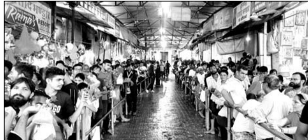
डिग्गी लकड़ी मेले में श्रीजी के दर्शन के लिये आस्था का सैलाब उमड़ा।

मालपुरा, (निर्स) तीर्थ स्थल डिग्गी में चल रहे डिग्गी कल्याण महाराज का 59वां लकड़ी मेला तीसरे दिन मंगलवार को परवान पर रहा। भगवान विष्णु के स्वरूप कल्याणधणी की मनमोहक झाँकी के दर्शन कर चरणों में शीशा झुकाने के लिये कल्याण भक्त अनवरत डिग्गी की ओर बढ़ रहे हैं। कल्याण भक्तों की सेवा-चाकरी की लोगों में होड़ सी मची हुई है। जयपुर रोड बजरी नाँके के पास लगे श्रीजी भंडारा में डिग्गी मोड़ से आगे लगे श्याम मित्र मंडल के भंडारे में अपनी सेवाएं दे रहे सेवक पदायत्रियों में कल्याणधणी का वास मानकर उनके चरण धोने व भंडारे में तैयार किये गये कई प्रकार के व्यंजन भक्तों को परोसकर स्वयं को श्रीजी के समीप होने का अहसास कर रहे हैं। डिग्गी तीर्थ की ओर आने वाले छोटे से बड़े हर