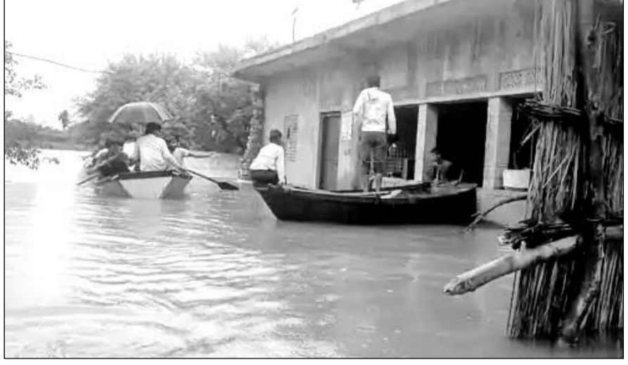
गंगापुर सिटी में बारिश के बाद जल भराव क्षेत्रों में राहत कार्य शुरू किए।