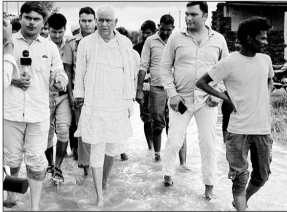
डॉ. किरोड़ी लाल मीणा ने भरतपुर, बयाना, हिण्डौन में जलभराव क्षेत्रों का दौरा किया।

जयपुर, (का.सं.)। भाजपा के वरिष्ठ नेता सवाई माधोपुर विधायक किरोड़ीलाल मीणा जो सुबह तो कैबिनेट मिनिस्टर थे और दोपहर होते-होते विधायक बन गए किरोड़ी का सोशल मीडिया प्रोफाइल बार-बार बदल रहा है। भाजपा प्रदेश अध्यक्ष मदन राठौड़ के बोलने के बावजूद अपने ट्विटर पेज पर खुद को विधायक बता किरोड़ी लाल मीणा ने ये संकेत दे दिए कि अब भी सब कुछ उतना सामान्य नहीं है, जितना बताया जा रहा है। वहीं मंगलवार को किरोड़ी लाल मीणा सड़क मार्ग से दौरा किया।