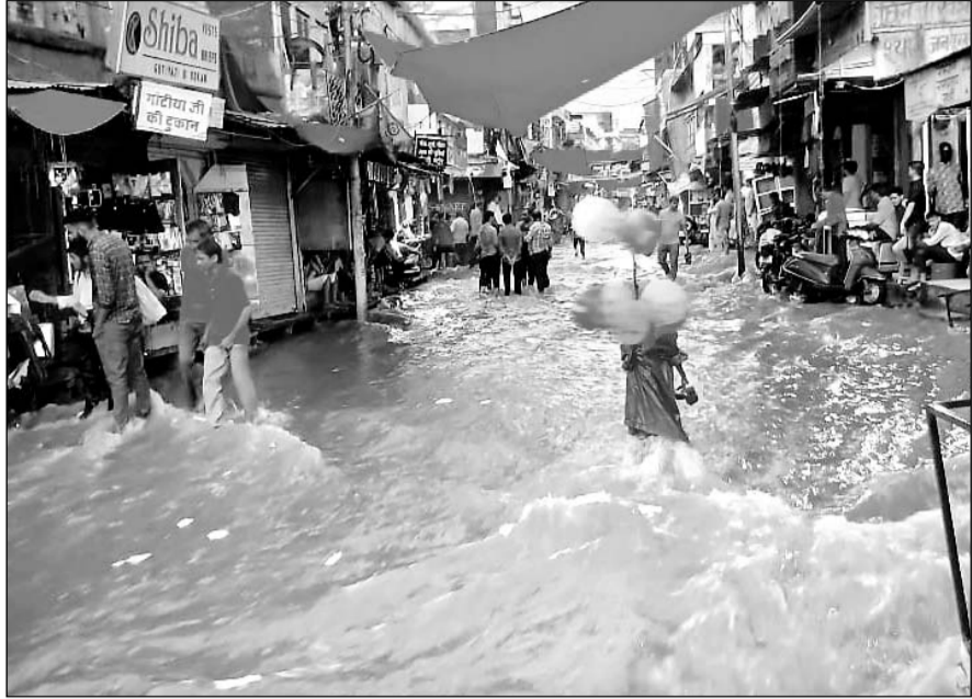
जोधपुर में हुई तेज बरसात के बाद कई जगहों पर सड़कें पानी से लबालब हो गईं।

जोधपुर सहित फलोदी, लोहावट, ओसिया, तिंवरी, नागाना सहित कई क्षेत्रों में बारिश हुई