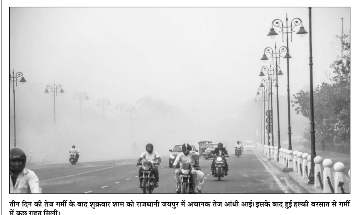
तीन दिन की तेज गर्मी के बाद शुक्रवार शाम को राजधानी जयपुर में अचानक तेज आंधी आई। इसके बाद हुई हल्की बरसात से गर्मी में कुछ राहत मिली।

‘पॉलिसी का शीघ्र कराएं नवीनीकरण’ जयपुर, (का.सं.)। मुख्यमंत्री आयुष्मान आरोग्य योजना में जिन परिवारों की पॉलिसी वैधता अवधि 30 अप्रैल समाप्त हो रही है, वे परिवार शीघ्र पॉलिसी का नवीनीकरण कराएं। पॉलिसी नवीनीकरण होने पर ही उन्हें 1 मई, 2024 से स्वास्थ्य बीमा योजना का लाभ मिल सकेगा।