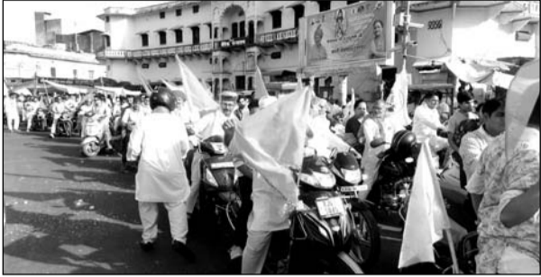
परशुराम की प्रतिमा पर माल्यार्पण करते हुए, निकाली गई शोभायात्रा।

अजमेर, (कास)। भगवान विष्णु के छठे अवतार भगवान परशुराम जी का जन्मोत्सव शुक्रवार को सर्वब्राह्मण समाज की ओर से धार्मिक आयोजित के साथ धूमधाम से मनाया गया। जन्मोत्सव पर परशुराम सिकल स्थित परशुराम जी की प्रतिमा पर ध्वजारोहण, हवन यज्ञ का आयोजन हुआ। समाज के लोगों ने मावे का केक काटकर दूसरे को मुं मीठा कराया। शाम को समाज के प्रतिभावानों को सम्मानित किया गया।