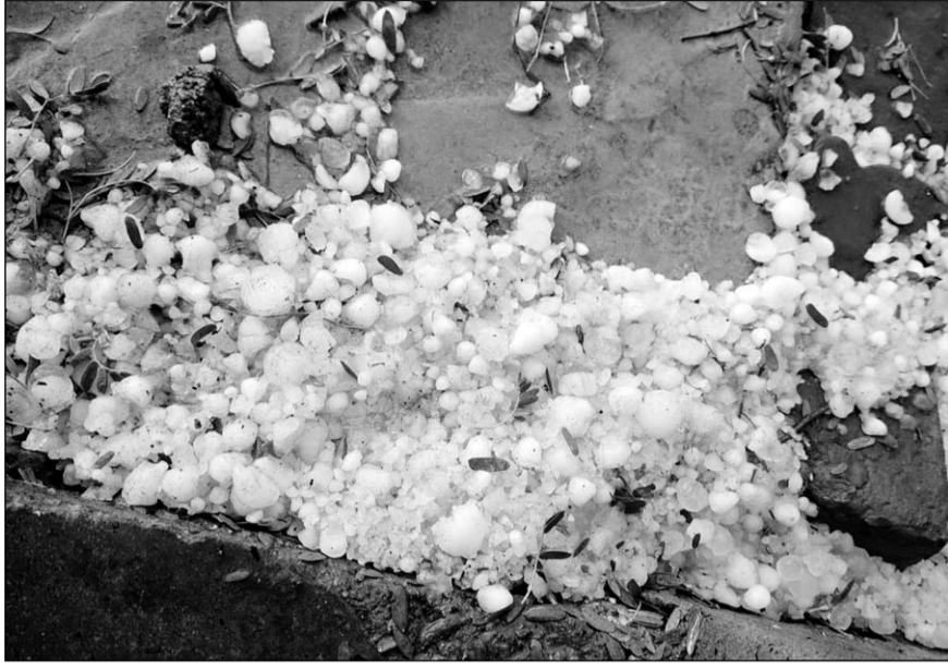
झुंझुनू के कई इलाकों में बारिश के साथ ओले भी गिरे।

गोदा का बास और बुहाना क्षेत्र में शाम को तेज हवाओं के साथ बारिश हुई और ओले गिरे। बारिश के कारण आमजन को गर्मी से राहत मिली। वहीं कई खेतों में किसानों की कटी हुई सरसों की फसल और पशुओं के लिए चारा पड़ा हुआ है, जिसे नुकसान भी हुआ है, लेकिन नुकसान काफी कम है। शुक्रवार को बिगड़े मौसम से उन शादियों के कार्यक्रमों में भी खलल पड़ गया, जिन्होंने अक्षय तृतीया के दिन अबूज सावे को ध्यान में रखते हुए अपने बेटे-बेटियों की शादी करने