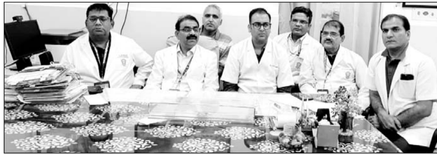
प्रेसवार्ता में जानकारी देते हुए चिकित्सा अधिकारी।