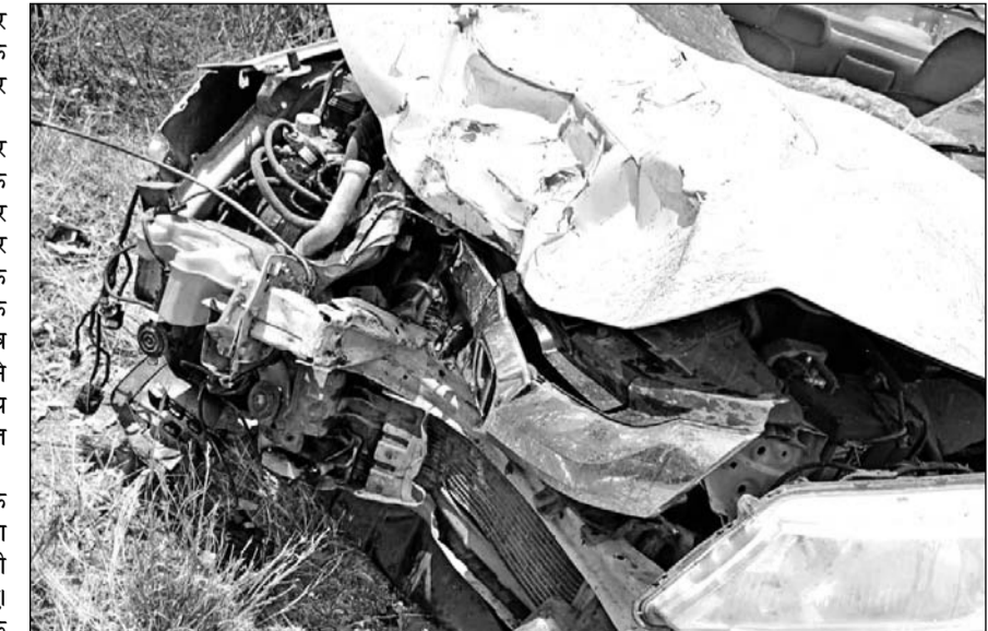
कानोड़ से उदयपुर मुख्य सड़क मार्ग पर हुये हादसे में कार क्षतिग्रस्त हो गई।

इधर कार चालक कार को मौके पर ही छोड़कर फरार हो गया। बताया जा रहा है कि कार में अन्य लोग भी सवार थे जो भी वहां से फरार हो गए। घटना के बाद पुलिस ने कार चालक व अन्य लोगों का कानोड़ और भीड़ चिकित्सालय में पता करने का प्रयास किया लेकिन दोनों ही नजदीकी अस्पतालों में नहीं मिले। वहीं हादसे