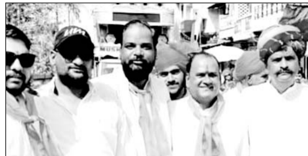
भगवान परशुराम का जन्मोत्सव उल्लास के साथ मनाया गया।