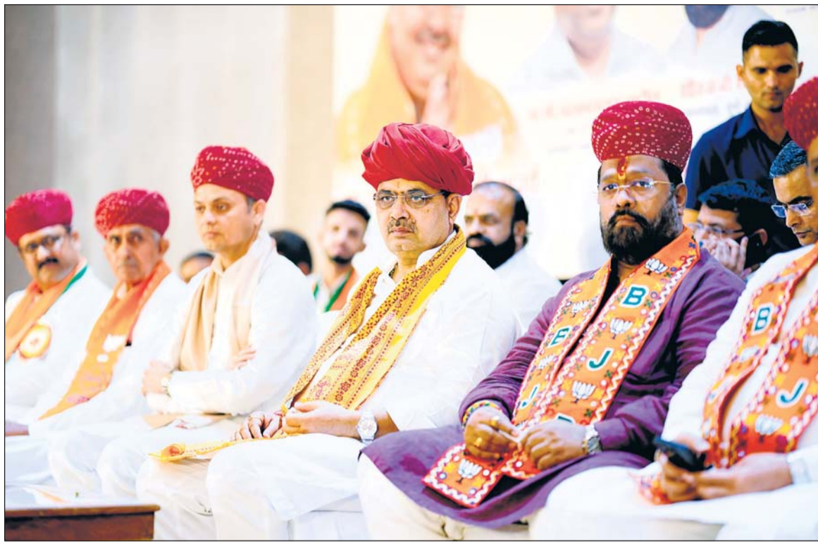
राजस्थान के मुख्यमंत्री भजनलाल शर्मा शुक्रवार को महाराष्ट्र के पुणे शहर में प्रवासी राजस्थानी सम्मेलन में शामिल हुए और साथी राजस्थानियों से पुणे लोकसभा क्षेत्र से भाजपा प्रत्याशी मुरलीधर मोहोले के समर्थन में अधिक से अधिक मतदान करके उन्हें जिताने की अपील की।