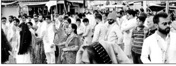
भगवान परशुराम जी के जन्मोत्सव पर शोभायात्रा निकाली।

शाहपुरा, (निस)। कस्बे में भगवान श्री विष्णु के छठवे अवतार भगवान श्री परशुराम जी का जन्मोत्सव धूमधाम से मनाया गया। सर्व ब्राह्मण समाज व्यास - दाधीच समाज, सुखवाल समाज, गुर्जर गौड़ समाज, पारीक समाज, गुजराती समाज आदि गौड़ समाज, पाराशर समाज, पाठक समाज, सारस्वत समाज, आदि