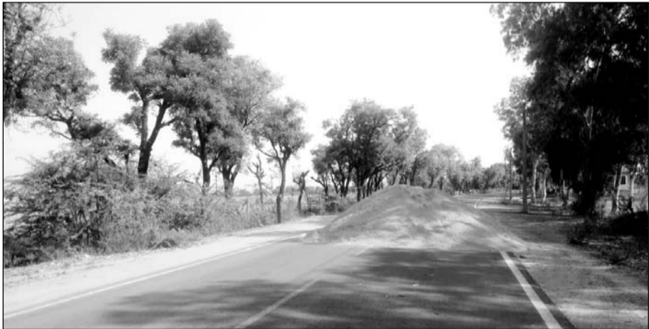
निवाड़ी के मूंडिया गांव में सड़क के बीचों-बीच पड़ी हुई बजरी।

निवाड़ी, (निसं)। गांव मूंडिया में पुलिस की गाड़ी को देखकर एक डंपर के चालक अवैध बजरी को सड़क के बीचों-बीच डालकर डंपर भगा ले गया, जिससे मूंडिया जाने वाले सड़क मार्ग पर आने-जाने वाले वाहन चालकों को परेशानी का सामना करना पड़ रहा है। इसी प्रकार दूसरे डंपर का चालक पुलिस