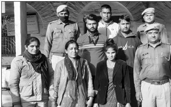
फर्जी दस्तावेजों से जमीन बेचने पर पुलिस ने दो महिलाओं सहित चार आरोपियों को गिरफ्तार किया।