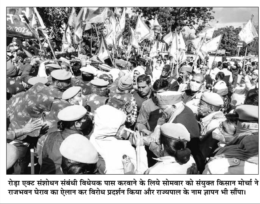
रोड़ा एक्ट संशोधन संबंधी विधेयक पास करवाने के लिये सोमवार को संयुक्त किसान मोर्चा ने राजभवन घेराव का एलान कर विरोध प्रदर्शन किया और राज्यपाल के नाम ज्ञापन भी सौंपा।