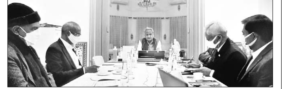
मुख्यमंत्री अशोक गहलोत ने सोमवार को उनके निवास से वीडियो कॉन्फ्रेंस के जरिए एसीबी के कामकाज की समीक्षा की।

जयपुर, (का.सं.)। मुख्यमंत्री अशोक गहलोत ने कहा कि संवेदनशील, पारदर्शी एवं जवाबदेह सुशासन हमारी सरकार का मूल मंत्र है। भ्रष्टाचार के खिलाफ राज्य सरकार की प्रतिबद्धता को देखते हुए एसीबी की महत्वपूर्ण भूमिका है। एसीबी को स्टाफ एवं तकनीकी संसाधनों से सुदृढ़ बनाने के साथ ही पर्याप्त बजट आवंटित किया गया है, ताकि भ्रष्टाचार के प्रति जीरो टोलरेंस की राज्य सरकार की नीति को प्रभावी तरीके से क्रियान्वित करने में एसीबी और मजबूती से काम करे। गहलोत सोमवार को मुख्यमंत्री निवास से वीडियो कॉन्फ्रेंस के जरिए एसीबी के कामकाज की समीक्षा कर रहे थे। गहलोत ने एसीबी की पिछली समीक्षा बैठक में दिये गए निर्देशों की