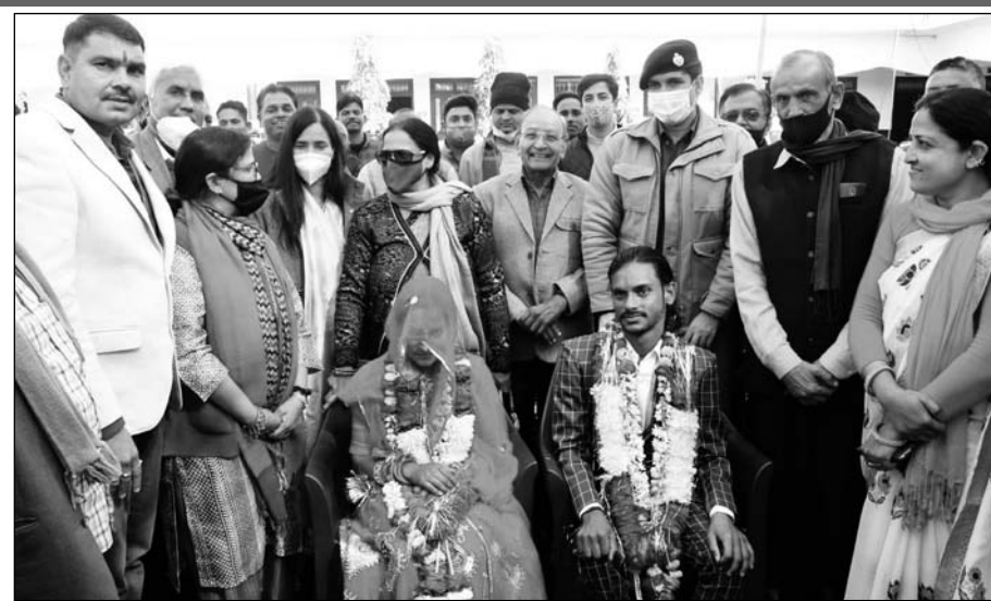
कलेक्टर, एसपी व विभिन्न सामाजिक संगठनों के पदाधिकारियों ने नवविवाहिता को आशीर्वाद दिया।