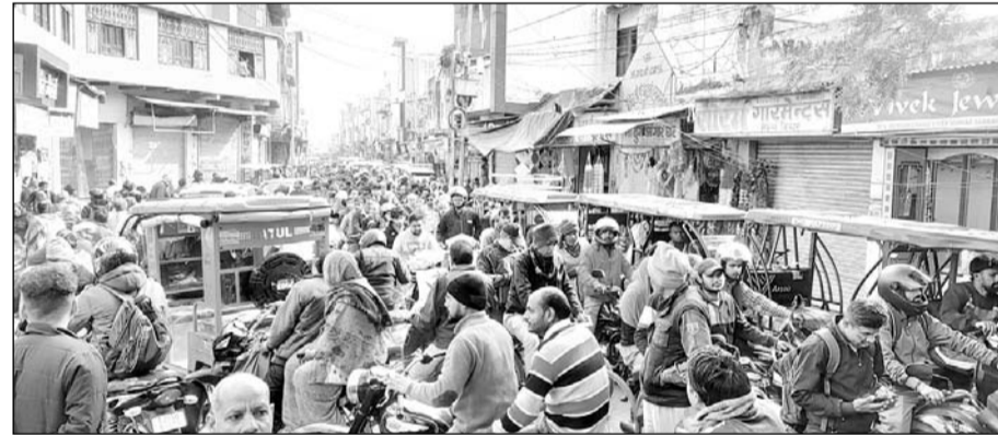
जाम में एम्बुलेंस फंसने से मरीज को परेशानी हुई।

भरतपुर, (निर्स)। शहर के मुख्य बाजार में ट्रैफिक इतना बढ़ गया है कि लोगों को कई घंटे जाम में फंसने को मजबूर होना पड़ता है। सोमवार को मथुरा गेट पुलिस चौकी के पास लम्बा जाम लग गया। करीब दो घंटे से अधिक समय तक लगे इस जाम की वजह से मथुरा गेट क्षेत्र में आवागमन बुरी तरह प्रभावित रहा। वहीं जाम में दो एम्बुलेंस भी फंस गईं। जिन्हें जाम खुलने का इंतजार करना पड़ा।