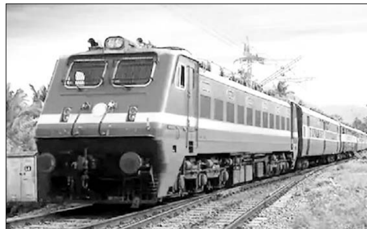
15 जनवरी से 6 मार्च तक नॉन इण्टरलॉकिंग कार्य के कारण रेल सेवा बाधित रहेगी।

रह रेलसेवाएं (प्रारम्भिक स्टेशन से):- गाड़ी संख्या 12414, जम्मूतवी-अजमेर रेलसेवा 06 फरवरी 25 से 06 मार्च 25 तक (29 ट्रिप) रह रहेगी। गाड़ी संख्या 12413, अजमेर-जम्मूतवी रेलसेवा 07 फरवरी 25 से 07 मार्च 25 तक (29 ट्रिप) रह रहेगी। गाड़ी संख्या 19027, बान्ना टर्मिनस-जम्मूतवी रेलसेवा 22 फरवरी 25 व 01 मार्च 25 को (02 ट्रिप) रह रहेगी। गाड़ी संख्या 19028, जम्मूतवी-बान्ना टर्मिनस रेलसेवा 24 फरवरी 25 व 03 मार्च 25 को (02 ट्रिप) रह रहेगी। आंशिक रह रेलसेवाएं (प्रारम्भिक स्टेशन से):- गाड़ी संख्या 19223, गांधीनगर कैपिटल-जम्मूतवी रेलसेवा जो 14 जनवरी 25 से 05 मार्च 25 तक गांधीनगर कैपिटल से प्रस्थान करेगी वह पठानकोट तक संचालित होगी अर्थात् यह रेलसेवा पठानकोट-जम्मूतवी स्टेशनों के मध्य आंशिक रह रहेगी। गाड़ी संख्या 19224, जम्मूतवी-