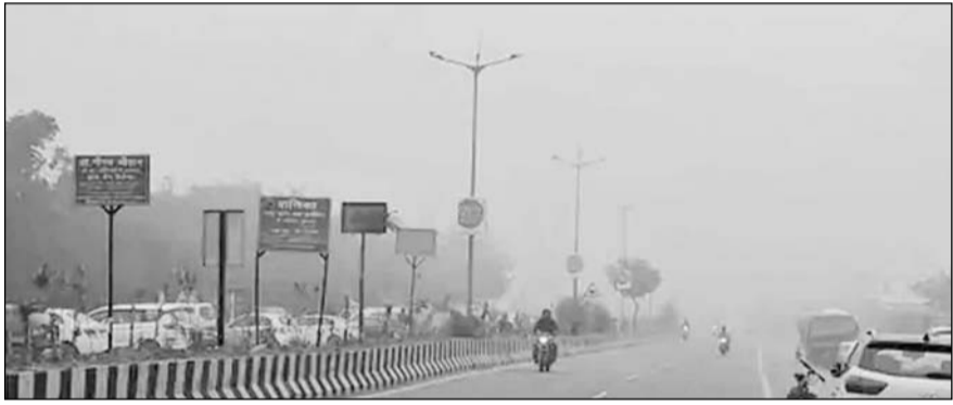
कोहरे की चपेट में अजमेर शहर की सड़कें।

ठंड के कारण लोग घरों में कैद होने को मजबूर हो गए हैं। सोमवार को अजमेर में अधिकतम तापमान 17 डिग्री सेल्सियस और न्यूनतम तापमान 8 डिग्री सेल्सियस रिकॉर्ड किया गया। वहीं आंठरा का स्तर 7.8 प्रतिशत रहा। तेज हवाओं ने ठंड का असर और बढ़ा दिया। सुबह और शाम के समय गलन के कारण टिडरुन और