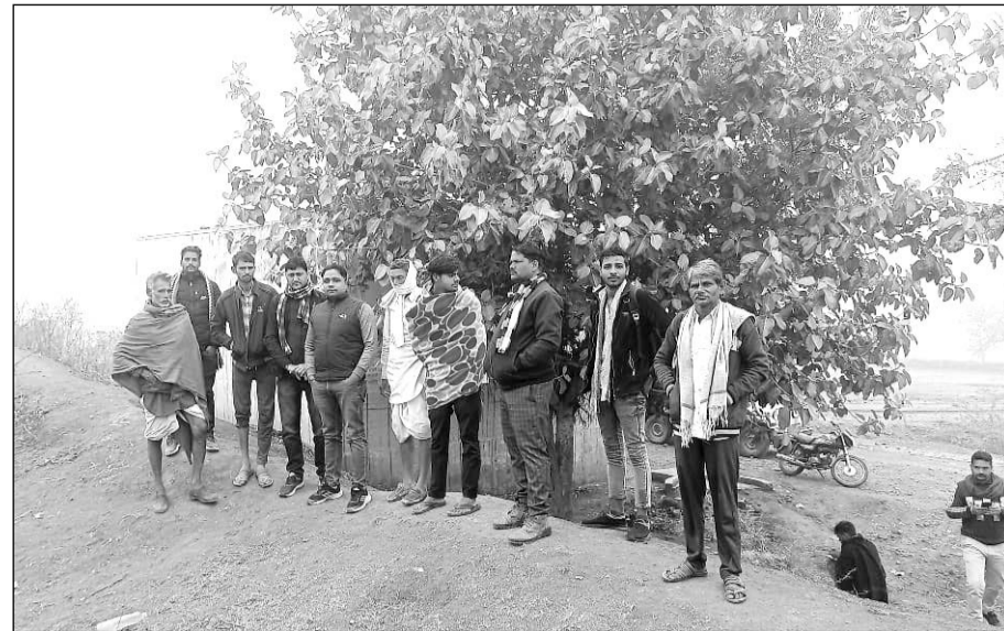
ग्रामीणों को सियार से सतर्क रहने की सलाह वनकर्मियों ने दी है।