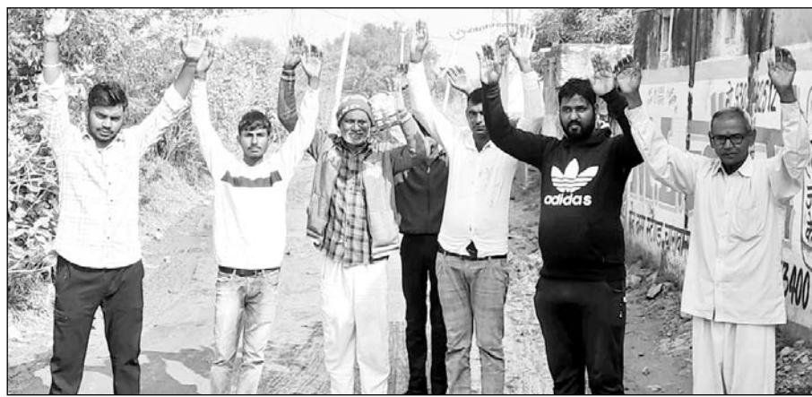
सड़क पर जमा गंदे पानी से परेशान ग्रामीणों ने विरोध प्रदर्शन कर समस्या समाधान की मांग की।

समस्या को लेकर विरोध कर रहे ग्रामीणों ने बताया कि लोयल से चिड़ासन जाने वाली सड़क पर पानी एकत्रित होने से बड़े-बड़े गड्ढे हो रहे हैं, जिनमें बरसात का पानी इकट्ठा हो जाता है। मुख्य रास्ते में पानी जमा होने से आमजन को बहुत परेशानी होती है। वहीं दुपहिया वाहन एवं पैदल आने जाने वाले लोगों को भारी परेशानियों का सामना करना पड़ रहा है। पानी जमा होने व सड़क में गड्ढे दिखाई नहीं देने के कारण कई बार दो पहिया वाहन एवं राहगीर पानी में गिर भी जाते हैं, जिससे उनको गंभीर चोटें आती हैं। ग्रामीणों ने