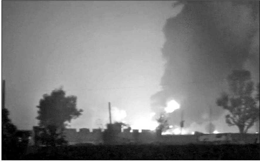
टैंकर में लगी आग दूर तक दिखाई दी।

दिल्ली-जयपुर राष्ट्रीय राजमार्ग स्थित ग्राम पनियाला के पास बैजिल केमिकल से भरा टैंकर पलट गया था