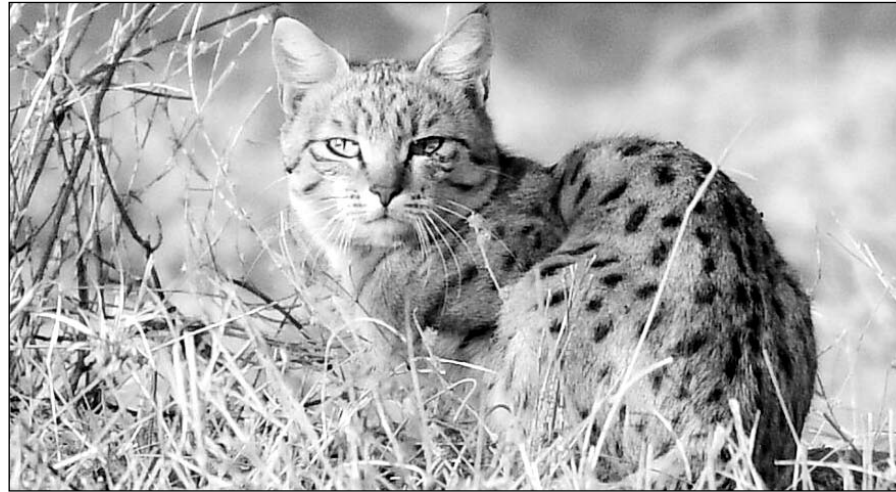
रामगढ़ विषधारी टाइगर रिजर्व के जंगलों में "एशियाई वन बिलाव" दिखाई दिया।

बून्दी, (निसं)। जिले के रामगढ़ विषधारी टाइगर रिजर्व के जंगलों में वन्य जीवों की संख्या व लुप्तप्राय प्रजातियों की उपस्थिति बनी हुई है। हाल ही में टाइगर रिजर्व में दुर्लभ प्रजाति की सियागोश बिल्ली के मिलने के बाद अब यहां "एशियाई वन बिलाव", एशियाई वाइल्ड कैट की भी मौजूदगी दर्ज की गई है। इसे भारतीय रेगिस्तानी बिल्ली, एशियाई जंगली बिल्ली या एशियाई मैदानी जंगली बिल्ली भी कहा जाता है।