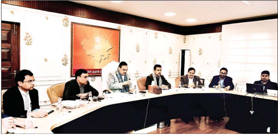
मुख्यमंत्री भजनलाल शर्मा ने जयपुर में प्रस्तावित राजस्थान मंडपम एवं यूनिटी मॉल की कार्ययोजना के संबंध में मुख्यमंत्री कार्यालय में उच्चस्तरीय बैठक ली तथा राजस्थान मंडपम बनाए जाने वाले कन्वेंशन सेंटर, एग्जीबिशन सेंटर, मीटिंग हॉल एवं आंगंतुक पार्किंग के संबंध में आवश्यक दिशा-निर्देश दिये।

जयपुर, 16 जनवरी। मुख्यमंत्री भजनलाल शर्मा ने कहा कि राजस्थान मंडपम विश्वस्तरीय सुविधाओं से युक्त और अन्य राज्यों के लिए अनुकरणीय होगा। उन्होंने कहा कि राजस्थान मंडपम में आवश्यक व्यवस्थाओं एवं सुविधाओं की पुख्ता कार्ययोजना बनाई जाए, ताकि यहां पर बड़े आयोजन सुगमता से हो सकें। शर्मा गुरुवार को जयपुर में प्रस्तावित राजस्थान मंडपम एवं यूनिटी मॉल की कार्ययोजना के संबंध में आयोजित उच्चस्तरीय बैठक को संबोधित कर रहे थे। उन्होंने कहा कि राजस्थान मंडपम