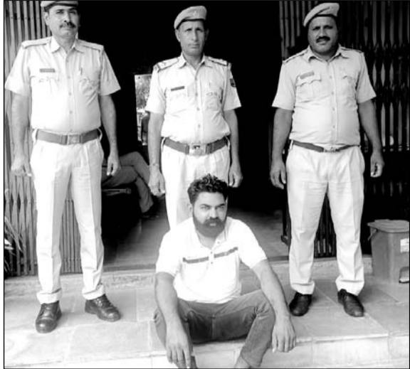
सिंधाना पुलिस ने डीजल व पेट्रोल की खरीद फरोख्त मामले में एक व्यक्ति को गिरफ्तार किया।