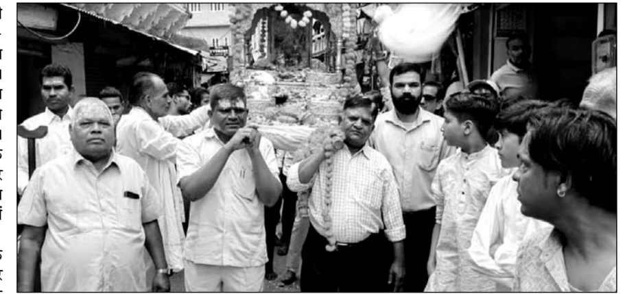
जलझूलनी एकादशी पर्व पर ठाकुरजी का बेवाण निकाला।

अजमेर, (कासं)। जलझूलनी एकादशी पर शनिवार को ढोल-नागाडों और गाजे-बाजे के साथ ठाकुरजी की रेवाडियां निकाली गईं। लोगों ने हाथी-घोड़ा पालकी, जय कन्हैयालाल की के जयकारे लगाते हुए ठाकुरजी को जल विहार कराया। छोटे बच्चों-शिशुओं को रेवाडी के नीचे से निकाल कर, श्रीफल चढ़ाकर घर-परिवार में खुशहाली की कामना की गई। शहर के विभिन्न मंदिरों में धार्मिक आयोजन भी हुए।