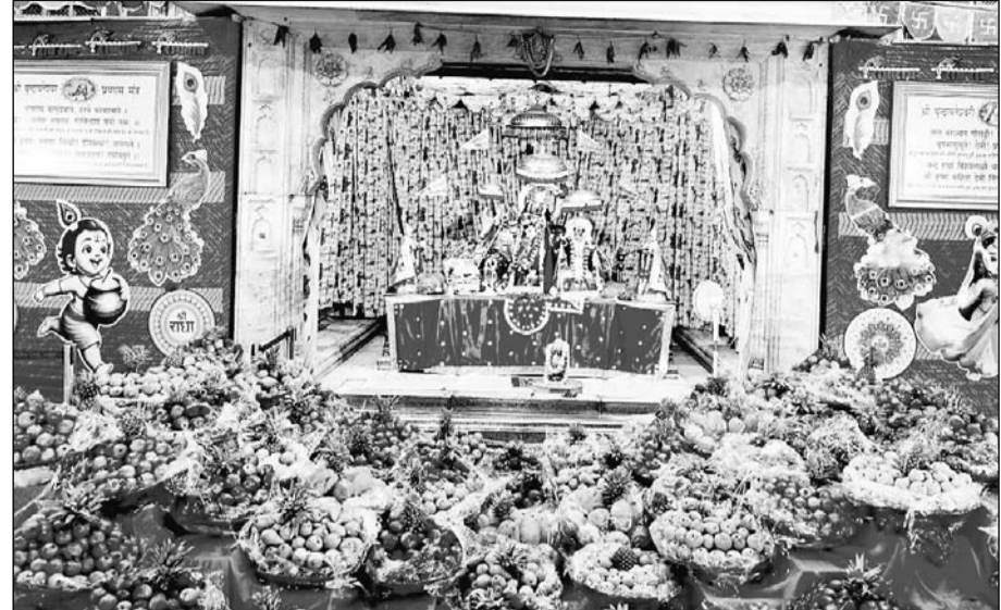
जयपुर के आराध्य देव गोविंददेवजी मंदिर में ठाकुरजी को 1100 किलो फलों का भोग लगाया गया। फलों में विशेष रूप से सेव, नाशपती, पपीता, अनार, अन्नानास व अंगूर शामिल थे।

जयपुर। भाद्रपद शुक्ल एकादशी शनिवार को जलझूलनी एकादशी धूमधाम से मनाई गई। शाम को कॉलोनी के हर मंदिर से डोल निकले। शालिग्रामजी को पालकों में विराजमान कर शंख-घंटा-घडियाल बजाते हुए जयकारों के साथ डोल यात्राएं निकाली गई। श्रद्धालु डोल के नीचे से निकले। ठाकुरजी के दर्शन किए। इसके बाद ठाकुरजी को जल विहार कराया गया।