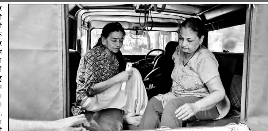
पुलिस ने दोनों महिलाओं को बदमाशों के चंगुल से छुड़वाया।

जानकारी के अनुसार गाड़ी में सवार दो बदमाश मोंके का फायदा उठाकर भाग छूटे, जबकि एक बदमाश पुलिस के हाथ लग गया। पुलिस ने उस एक बदमाश को हिरासत में लेकर