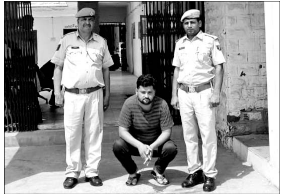
पुलिस ने विधवा महिला को स्लो पॉइजन देने के मामले में आरोपी को गिरफ्तार किया।