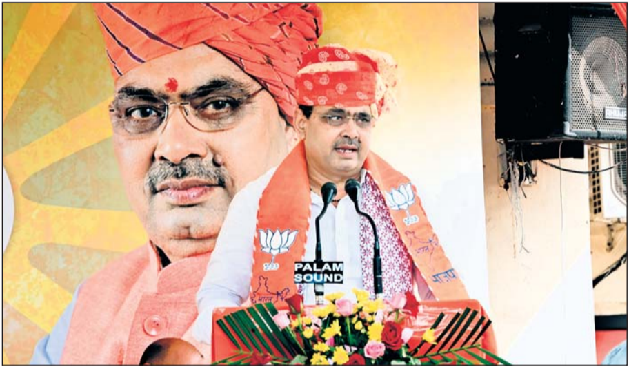
जापान और उत्तर कोरिया की यात्रा के बाद वापस लौटने पर जयपुर एयरपोर्ट से लेकर भाजपा प्रदेश कार्यालय तक मु. मंत्री भजनलाल शर्मा का भव्य स्वागत किया गया। भाजपा प्रदेश मुख्यालय में मु. मंत्री ने कार्यकर्ताओं को संबोधित करते हुये कहा, जापान के निवेशकों ने राजस्थान में निवेश के विषय में बहुत ही पॉजिटिव प्रतिक्रिया दी है।

जयपुर, 14 सितंबर। राजस्थान में उद्योग-धंधों की अपार संभावनाओं के चलते निवेशकों को आमंत्रित करने दक्षिण कोरिया और जापान यात्रा पर गए मुख्यमंत्री भजनलाल शर्मा के जयपुर लौटने पर आज एयरपोर्ट से लेकर भाजपा प्रदेश कार्यालय तक उनका भव्य स्वागत किया गया। लोक कलाकारों