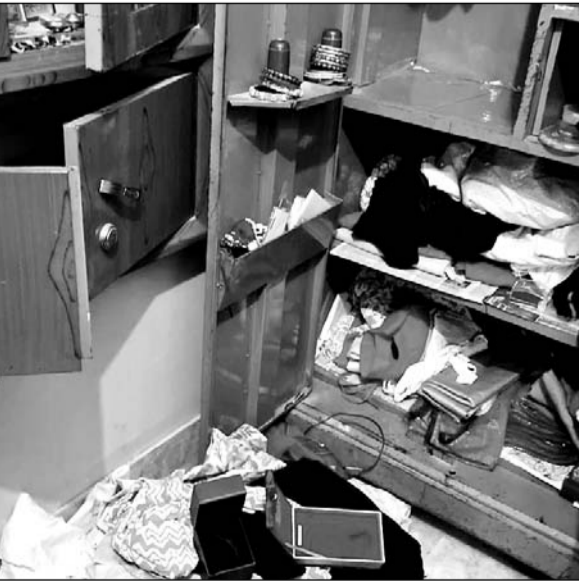
चोरी की वारदात के बाद सामान बिखरा पड़ा है।

जानकारी के अनुसार शुकुवार की रात्रि में कस्बे के वार्ड 7 में दो सगे भाइयों के बंद मकानों के ताले तोड़कर चोरों ने