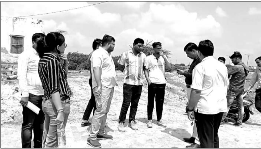
हाईकोर्ट कमिश्नर की टीम शनिवार को सुबह खारिया तालाब पहुंच जायजा लिया।

टीम ने संपूर्ण खारिया तालाब का किया भौतिक निरीक्षण, संपूर्ण निरीक्षण की हुई फोटोग्राफी व वीडियोग्राफी