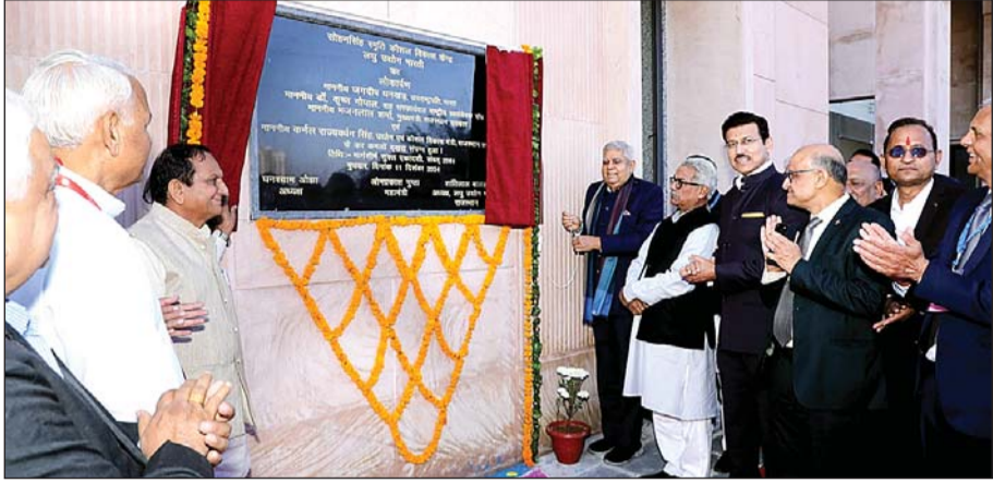
उपराष्ट्रपति जगदीप धनखड़ ने बुधवार को जयपुर में अपैरल पार्क रीको औद्योगिक क्षेत्र में लघु उद्योग भारती की ओर से नव निर्मित सोहन सिंह स्मृति कौशल विकास केंद्र का लोकार्पण किया।

जयपुर ज्ञान और कौशल के भरोसे ही विकसित भारत का संकल्प सार्थक होगा। कौशल से व्यक्ति को सामर्थ्य और सम्मान दोनों ही मिलते हैं। ये कहना है उपराष्ट्रपति जगदीप धनखड़ का। वे आज जयपुर में अपैरल पार्क रीको औद्योगिक क्षेत्र में लघु उद्योग भारती की ओर से नव निर्मित सोहन सिंह स्मृति कौशल विकास केंद्र के लोकार्पण समारोह को सम्बोधित कर रहे थे। उन्होंने कहा कि विकसित भारत का रास्ता ग्रामीण परिवेश और लघु उद्योग से होकर जाता है, ऐसे कौशल केंद्रों से जाता है। क्योंकि विकसित भारत की जो चुनौती है, वह हमारी प्रति व्यक्ति आय है और उसमें आठ गुना बढ़ोतरी होना आवश्यक है। यह बात ठीक है, चाहे जल हो, चाहे थल हो, चाहे आकाश हो, चाहे अंतरिक्ष हो भारत बड़ी छलांग लगा रहा है। संस्थागत ढांचा विश्व स्तरीय बन रहा है। पर इन सबके बाद भी एक चीज जो हमारे भीतर है राष्ट्रवाद, राष्ट्र प्रेम, हम भारतीय हैं भारतीयता हमारी पहचान है।