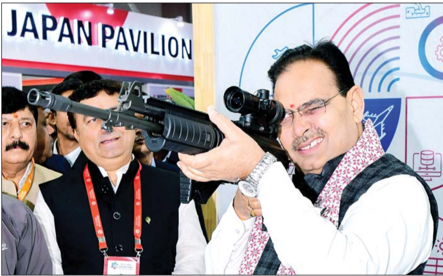
राज्जिंग राजस्थान ग्लोबल इन्वेस्टमेंट समिट के समापन पर मुख्यमंत्री भजनलाल शर्मा ने विभिन्न कंपनियों और उपक्रमों के एग्जिक्यूटिव बूथों का जायजा लिया। उन्होंने "बिल्डिंग अ सिक्वोर नेशन" बूथ पर आधुनिक हथियारों का निरीक्षण किया।

राजस्थान समिट में हुए एम.ओ.यू. को धरातल पर उतारने के लिए पूरी शक्ति के साथ काम करेंगे। अगले वर्ष 11