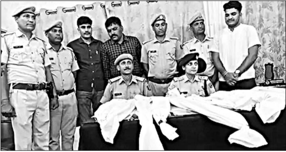
उनियारा पुलिस टीम ने भारी मात्रा में अवैध हथियार, बारूद और छर्रे बरामद किये।

टोंक, (निर्सं)। जिला पुलिस अधीक्षक के निर्देशन में अवैध हथियारों के खिलाफ चलाए जा रहे अभियान के तहत उनियारा वृद्धाधिकारी के नेतृत्व में उनियारा पुलिस टीम ने कार्यवाही करते हुए भारी मात्रा में अवैध हथियार, बारूद और छर्रे बरामद कर पांच आरोपियों को गिरफ्तार किया है।