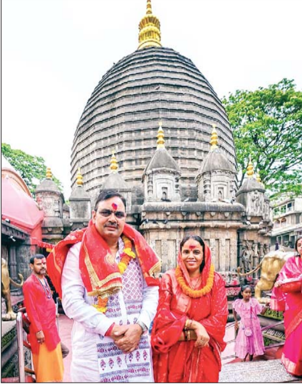
मुख्यमंत्री भजनलाल शर्मा ने मंगलवार को असम के गुवाहाटी में माँ कामाख्या मंदिर में सपत्नीक दर्शन किए।

इस अवसर पर केन्द्रीय गृह मंत्री अमित शाह, केन्द्रीय रक्षा मंत्री राजनाथ सिंह, केन्द्रीय मंत्रिमण्डल के सदस्यों सहित, विभिन्न राज्यों के मुख्यमंत्री, उपमुख्यमंत्री, मंत्रांगण एवं अन्य जनप्रतिनिधिगण उपस्थित रहे।