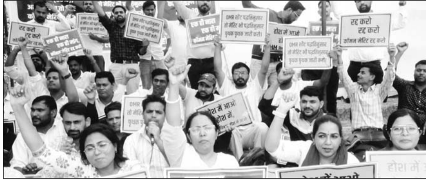
होम्योपैथी और यूनानी डॉक्टरों ने जयपुर के शहीद स्मारक पर धरना-प्रदर्शन किया।

जयपुर। राष्ट्रीय स्वास्थ्य मिशन (एनएचएम) की आयुष मेडिकल ऑफिसर भर्ती में कंगल अनियमितताओं के विरोध में मंगलवार को बड़ी संख्या में होम्योपैथी और यूनानी डॉक्टरों ने जयपुर के शहीद स्मारक पर धरना-प्रदर्शन किया। अभ्यर्थियों ने भर्ती प्रक्रिया में पारदर्शिता की कमी और तकनीकी त्रुटियों का आरोप लगाते हुए सरकार से निष्पक्ष समाधान की मांग उठाई। धरना दे रहे अभ्यर्थियों ने चेतावनी दी कि यदि सरकार ने जल्द सकारात्मक निर्णय नहीं लिया तो आंदोलन को और तेज किया जाएगा। उन्होंने कहा कि पहले चरण में आमरण अनशन शुरू किया जाएगा और आवश्यकता पड़ने पर न्यायालय की शरण भी ली जाएगी। साथ ही प्रदेशभर में जिला स्तर पर भी विरोध-प्रदर्शन आयोजित किए जाएंगे।