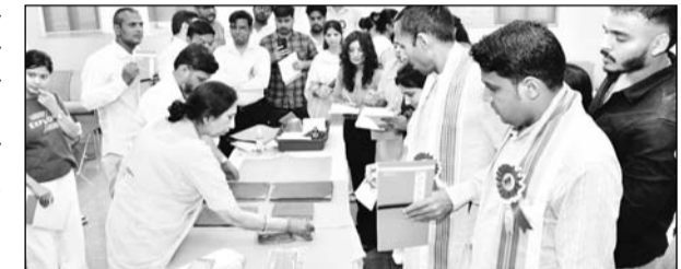
'पांडुलिपियों का निवारण एवं संरक्षण' विषय पर पांच दिवसीय कार्यशाला का आयोजन हुआ।

हरिद्वार में किया जा रहा है। इस मिशन का उद्देश्य भारत की विशाल एवं अप्रमूल्य पांडुलिपि विरासत का संरक्षण, दस्तावेजीकरण तथा डिजिटलीकरण करना है, ताकि यह प्राचीन ज्ञान-संपदा भावी पीढ़ियों के लिए सुरक्षित रह सके। कार्यशाला का आयोजन पांडुलिपि संरक्षण के प्रति जागरूकता उत्पन्न करने तथा संरक्षण एवं भंडारण