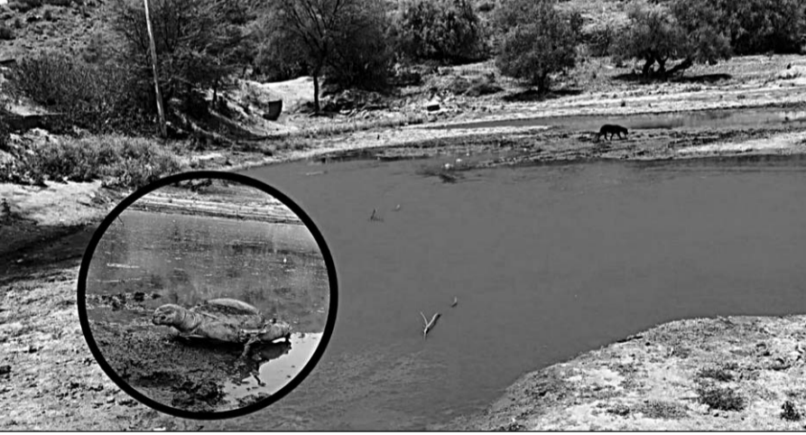
अलवर के ग्राम चौमू में स्थित घाटा एनीकट में कुछ दिनों से पानी रंग बललता दिख रहा है।