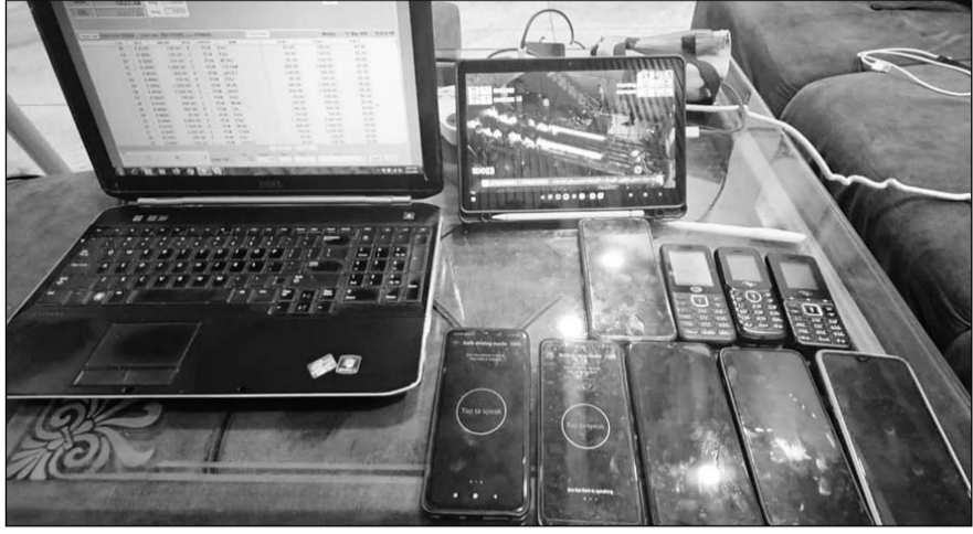
पुलिस ने लैपटॉप, टैबलेट, एलईडी टीवी, 9 मोबाइल और डायरियां जब्त की।

पुलिस से प्राप्त जानकारी के अनुसार आईपीएल क्रिकेट मैचों पर चल रहे ऑनलाइन सट्टे के मामले डीएसटी ने कार्यवाही करते हुए करीब एक करोड़ रुपये से ज्यादा के हार-जीत के हिसाब का खुलासा किया है।