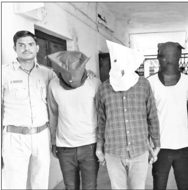
क्रिश्चियनगंज थाना पुलिस ने आरोपियों को बापदा गिरफ्तार किया।

पूर्व में दो आरोपियों को पुलिस पहले ही गिरफ्तार कर चुकी है