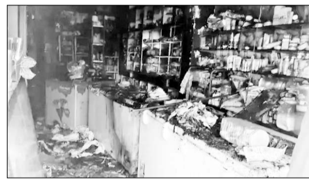
बूंदी में प्रोविजन स्टोर पर आग लगने से सामान जलकर राख हो गया।

रात्रि को शहर के रजत गृह गेट नंबर 2 पर स्थित जैन बेकर्स एवं पिकी प्रोविजन स्टोर पर आग लगने से लाखों