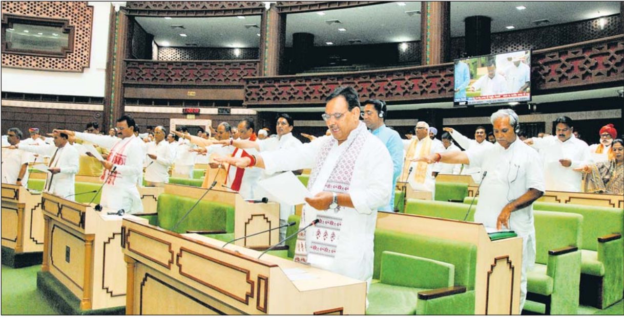
विधानसभा में बुधवार को अन्तरराष्ट्रीय प्लास्टिक बैग मुक्त दिवस के अवसर पर सदस्यों ने मुख्यमंत्री भजनलाल शर्मा के नेतृत्व में प्लास्टिक बैग के इस्तेमाल को हतोत्साहित करने तथा आमजन को भी इस हेतु जागरूक करने का संकल्प लिया। विधानसभा अध्यक्ष वासुदेव देवनानी ने सदस्यों को यह संकल्प दिलाने के लिए सभी संवेदनशील होकर पर्यावरण संरक्षण की दिशा में काम करें। प्लास्टिक बैग के स्थान पर पर्यावरण अनुकूल विकल्पों जैसे कपड़े के बने थैले अथवा बायोडीग्रेडेबल बैग का इस्तेमाल करें। उन्होंने सभी सदस्यों से प्लास्टिक बैग का न्यूनतम प्रयोग, इसके उचित निस्सारण के लिए संवेदनशील होने तथा अपने आस-पास के लोगों को भी प्लास्टिक बैग के कम से कम उपयोग और पर्यावरण पर प्लास्टिक के दुष्प्रभाव के प्रति जागरूक करने का आह्वान किया।