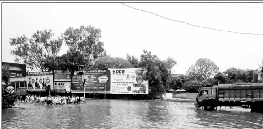
भिवाड़ी में सड़कों से काला और प्रदूषित पानी हुआ गायाब।

खैरथल-तिजारा जिले में सरकार की मंशा अनुसार जिला कलेक्टर डॉ. अर्तिका शुक्ला ने कुछ ही महीनों में जल जीवन मिशन के कार्यों की नियमित समीक्षा एवं मार्गदर्शन के चलते कार्य की प्रगति में पंख लग गए और जो जिला राजस्थान में जल 33 वें स्थान से 9 वें पायदान पर और 9 वें पायदान से तीसरे पायदान पर पहुंच गया है। अब जिला कलेक्टर और विभाग के प्रयास रहे हैं कि जिले के स्थान पर आये। कार्य की प्रगति को देखते हुए जिला कलेक्टर ने विभाग के अधिकारियों द्वारा किए जा रहे कार्यों की प्रशंसा कर बधाई दी है।