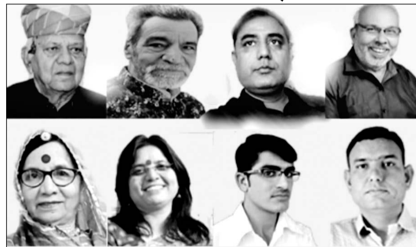
सम्मानित होने वाले साहित्यकार।