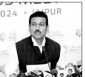
डूंगू विजनेस' के तहत व्यवसाय करने की लागत में कमी लाना और लावफोताशाही को कम करने का निरंतर प्रयास कर रही है, ताकि उद्योग जगत को प्रदेश में काम करने में आसानी हो।

जयपुर। मुख्यमंत्री भजन लाल शर्मा के नेतृत्व में इस वर्ष दिसंबर में जयपुर में आयोजित होने वाले 'राइजिंग राजस्थान' ग्लोबल इन्वेस्टमेंट समिट 2024 से पहले उद्योग एवं वाणिज्य मंत्री कर्नल राज्यवर्धन राठौड़ ने आज मीडिया को संबोधित किया। आज आयोजित प्रेस कॉन्फ्रेंस में माननीय मंत्री कर्नल राठौड़ ने कहा कि सरकार अगले पाँच वर्षों में राज्य के सकल घरेलू उत्पाद को मौजूदा 15 लाख करोड़ रुपये से दोगुना करके 30 लाख करोड़ रुपये तक पहुंचाने का लक्ष्य लेकर चल रही है और 'राइजिंग राजस्थान' ग्लोबल इन्वेस्टमेंट समिट 2024 के जरिए प्रदेश में निवेश जुटाना सरकार की सर्वोच्च प्राथमिकता है। कर्नल राठौड़ ने यह भी कहा कि सरकार 'इज ऑफ