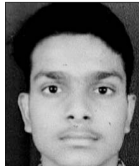
मृतक चचेरे भाई।