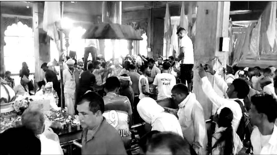
बाबा भर्तृहरिनाथ के मेले में पहुंचे श्रद्धालुओं ने मन्नत मांगी।

हर साल भाद्र पक्ष की अष्टमी के दिन यहां लक्ष्मी मेले का आयोजन किया जाता है जिससे माधोगढ़ ग्राम पंचायत द्वारा आयोजित कवाया जाता है। यहां पर उल्लेखनीय है कि बाबा भर्तृहरि का मेला सधन जंगल में आयोजित होता है और लाखों की संख्या में भक्त पहुंचते हैं लेकिन जिला प्रशासन और पुलिस की सूझबूझ के चलते अपराधी मेले में कम ही पहुंचते हैं, फिर भी छुटपुट