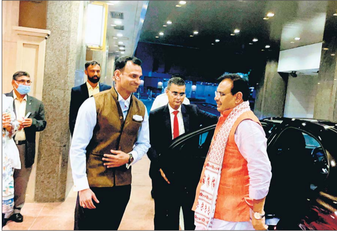
मुख्यमंत्री भजनलाल शर्मा के नेतृत्व में प्रदेश सरकार का प्रतिनिधिमंडल मंगलवार को सियोल (कोरिया) पहुंचा। सियोल में कोरियन स्टोन एसोसिएशन के प्रतिनिधियों ने मुख्यमंत्री का स्वागत किया। मुख्यमंत्री की कोरियन स्टोन एसोसिएशन के व्यापारियों एवं प्रतिनिधियों के साथ राजुड टैबल वार्ता हुई।