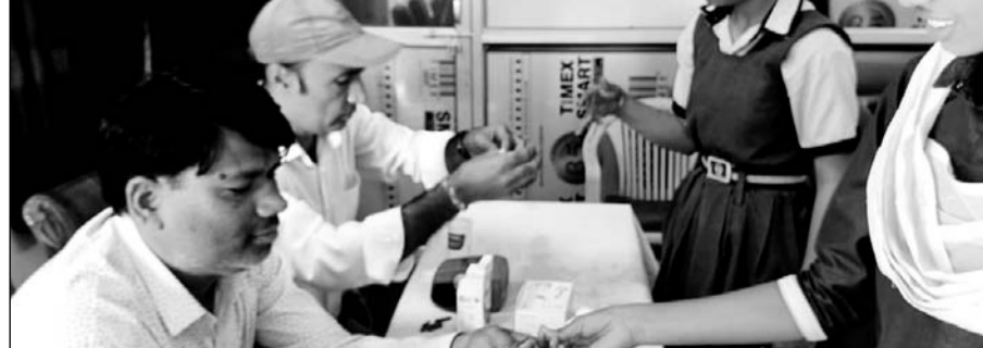
गंगापुर सिटी में हिमोग्लोबिन की जांच करते चिकित्सककर्मी।