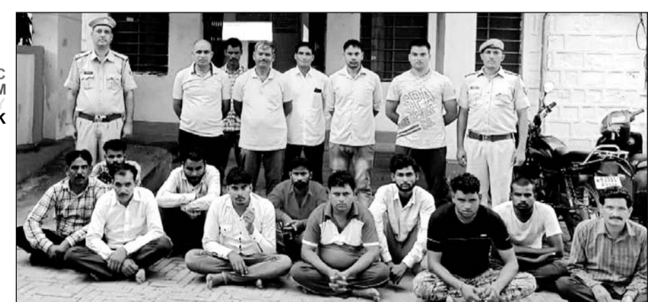
धौलपुर जिले के बाड़ी उपखंड की कोतवाली थाना पुलिस ने जुआ के अड्डे पर कार्रवाई की।