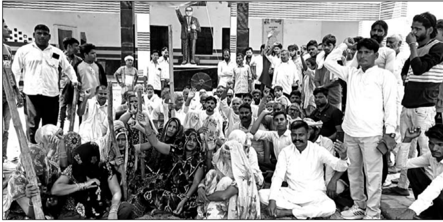
समाज के लोगों का धरना जारी रहा।

कामों (निस)। कस्बे के जुहड़ा रोड स्थित अंबेडकर पार्क में संविधान निर्माता बाबा साहेब भीमराव अंबेडकर की 19 दिवस के बाद पुनः रविवार देर रात्रि समाज कंटकों द्वारा मूर्ति को खंडित किए जाने के बाद समाचार लिखे जाने तक आरोपियों का कोई सुराग नहीं लगा। जिसे लेकर समाज के लोगों का धरना जारी रहा। जहां कामें क्षेत्र से आई जाटव समाज की महिलाओं ने धरने में शामिल होकर सरकार व प्रशासन पर गंभीर आरोप लगाते हुए कहा कि पत्नी की सरकार द्वारा कानून व्यवस्था चारों तरफ फेल नजर आ रही है। गुस्ताई महिलाओं ने राजस्थान सरकार