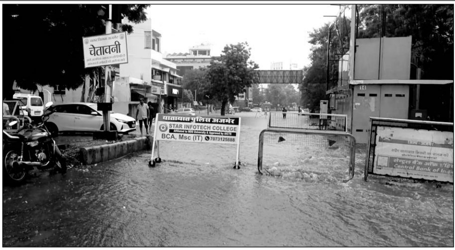
अजमेर में फिर से हुई बरसात से कई जगहों पर जलभराव हो गया।

अजमेर, (कासं)। अजमेर शहर में तीन दिन बाद मंगलवार को फिर से हुई तेज बारिश के बाद स्मार्ट सिटी अजमेर की जानमाल की सुरक्षा का पूरा जिम्मा अब रेत से भरे कट्टों पर आ गया है, लेकिन बरसात इतनी तेज थी कि हाथीभाटा पावर हाउस वाली रोड पर लगाए गए रेत के कट्टे भी बरसाती पानी को नहीं रोक पाए और पानी कट्टों के ऊपर से होता हुआ निकल गया, जिसके कारण हाथीभाटा पावर हाउस में कमर तक पानी भर गया तो वही आनासागर स्कूप चैनल से चल रही चादर से बेकाबू हो रहे पानी को थामे रखने के लिए केसरबाग पुलिस चौकी से महावीर सिकल तक के रास्ते पर आवागमन रोक दिया गया।