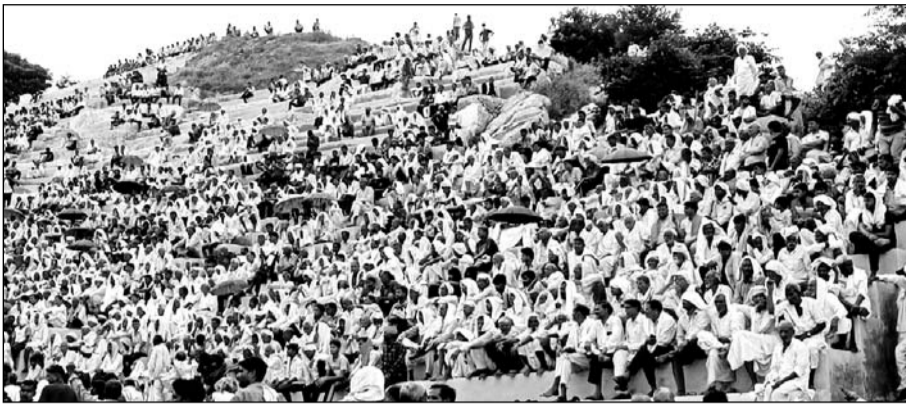
विशाल कुशती दंगल का आयोजन करीरी में हुआ।

का आयोजन होता है जो 12 बजे बाद शुरू हो जाता है। जिसमें राजस्थान सहित हरियाणा, उत्तर प्रदेश, पंजाब मध्य प्रदेश व दिल्ली से पहलवान पहुंचकर कुशती दंगल में भाग लेते हैं। 101 रुपये से शुरू हुई कुशती लाखों रुपये की इनाम राशि पर पहुंच जाती है।