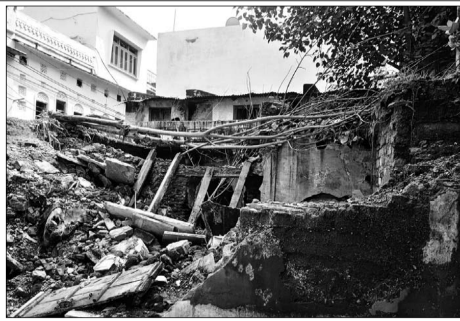
देवली शहर के बीचों-बीच जर्जर अवस्था में खड़े भवन हादसे को न्योता दे रहे हैं।