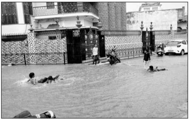
चूरू में सवा घंटे तक मूसलाधार बारिश हुई।

चूरू, (निसं)। मंगलवार को चूरू में मेघ जमकर मेहरबान हुआ। यहां करीब सवा घंटे तक मूसलाधार बारिश हुई, जिससे शहर के निचले इलाकों सहित मुख्य मार्ग जलमग्न हो गए। मौसम विभाग के अनुसार मंगलवार को 70 एमएम (करीब तीन इंच बारिश) बारिश दर्ज की गई। बारिश से मौसम सुहावना हो गया। बारिश से लोहिया कॉलेज,