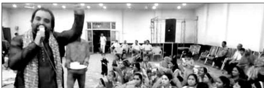
करौली में मां भगवती के जागरण में भजन गूंजे।

करौली (निस.)। गत रात्रि को करौली इन मैरिज गार्डन गुलाब बाग में मां भगवती के जागरण का आयोजन किया गया जिसमें हिंडौन भक्त मंडल के लोगों ने उन्होंने बताया कि खनन क्षेत्र में लगभग 80-90 फीट गहरी खाई खोदी गई है जिसे भरा तक नहीं गया है जिसमें पशुओं एवं बच्चों के गिरने का खतरा बना रहता है उन्होंने बताया कि पूर्व में कई बार पशु गिरकर अपनी जान गवा चुके हैं यही नहीं स्टोन क्रेशर से उड़ने वाली धूल के कारण कई लोग सिलिकोसिस बीमारी की चपेट में आकर अपनी जान भी गवा चुके हैं। उन्होंने ज्ञापन के माध्यम से मांग की है कि उक्त क्रेशर पर संपादन लेकर उचित कार्यवाही करें।