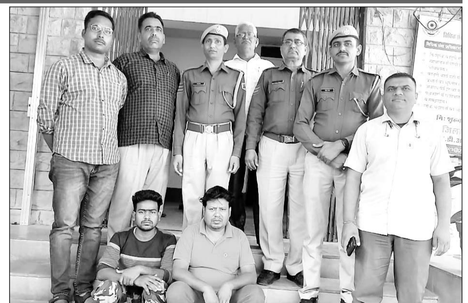
बाड़मेर में कोतवाली पुलिस ने सोना चोरी के मामले में दो आरोपियों को गिरफ्तार किया।