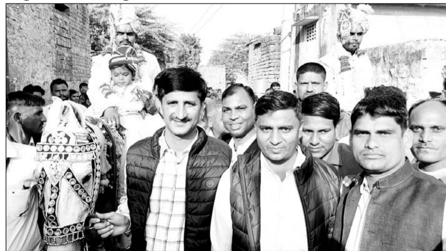
पंचायत कैरोडी में निकासी निकालते लोग।