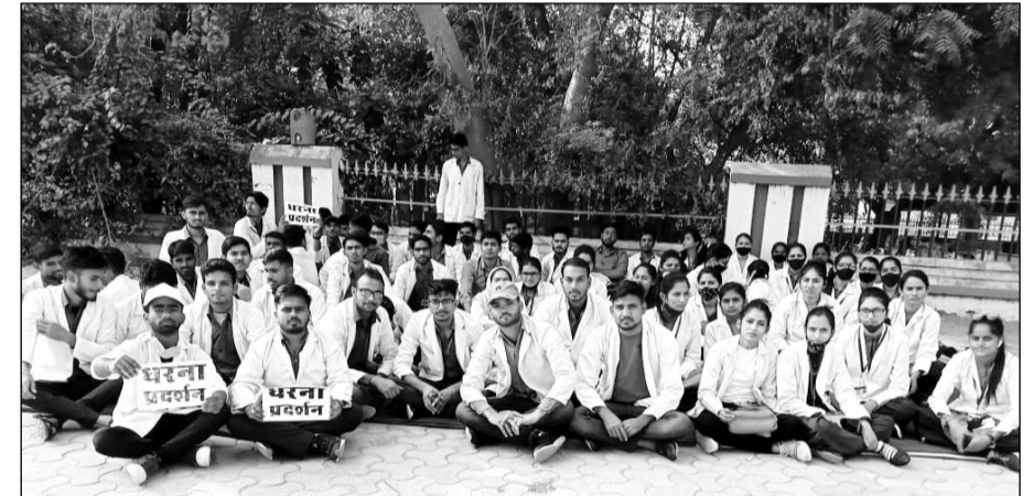
चुरू नर्सिंग कॉलेज के विद्यार्थी अपनी मांगों को लेकर धरने बैठे।

राज्य सरकार के मंत्रियों, विधायकों को कई बार अवगत करवाने के बावजूद आज तक किसी के कानों में जूँ तक नहीं रेंगी। इन परेशानियों को देखते हुये विद्यार्थियों को