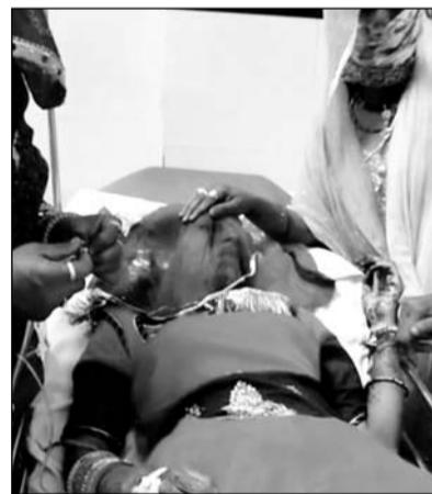
घायल दुल्हन का अस्पताल में उपचार किया।