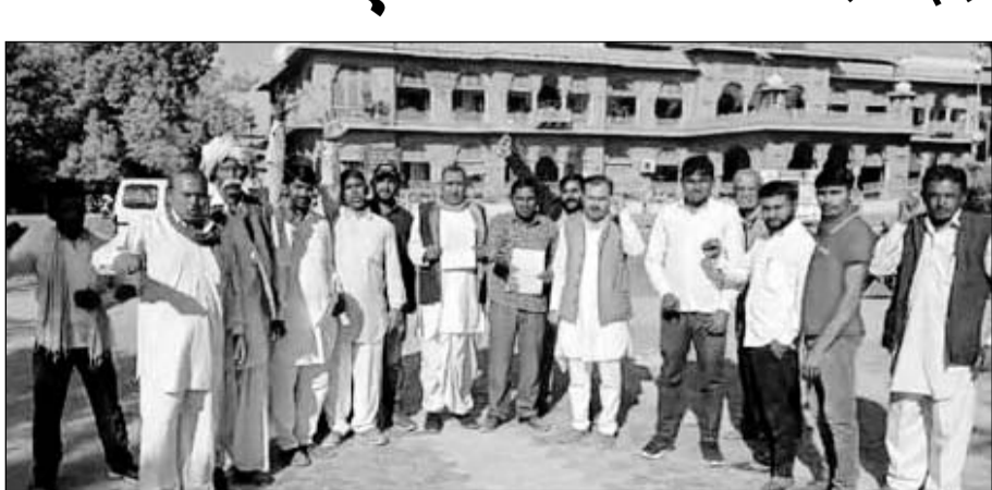
राजकीय उच्च माध्यमिक विद्यालय सुई में शिक्षक लगाने की मांग को लेकर लूणकरनसर के ग्रामीणों ने कलेक्ट्रेट पर प्रदर्शन किया।

बीकानेर, (कासं)। शिक्षा मंत्री के गृह जिले में शिक्षकों के रिक्त पदों को भरने के लिये लगातार आन्दोलन हो रहे हैं। शुक्रवार को भी लूणकरनसर तहसील के वांशियों ने शिक्षकों के पदों को भरने के लिये कलेक्ट्रेट पर प्रदर्शन कर प्रशासन को खुली चेतावनी दी।