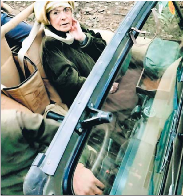
सोनिया गांधी अपना 76वां जन्म दिन मनाते 37 साल बाद अपने बच्चों प्रियंका गांधी और राहुल गांधी के साथ रणथम्भौर आई हैं। सोनिया गांधी 1985 में अपने पति राजीव गांधी के साथ रणथम्भौर घूमने आई थीं।

37 साल पहले सोनिया गांधी अपने पति राजीव गांधी के साथ रणथम्भौर आई थी। उस समय उनके साथ उनके परिवारिक मित्र अमितभा बच्चन भी थे। करीब 37 साल बाद सोनिया गांधी अपने बच्चों प्रियंका गांधी और राहुल गांधी के साथ रणथम्भौर आई हैं, जहां उनका जन्मदिन मनाया गया। सोनिया,