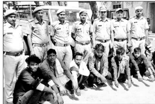
पुलिस ने गूगल गोंद का परिवहन करने के आरोपियों को गिरफ्तार किया।