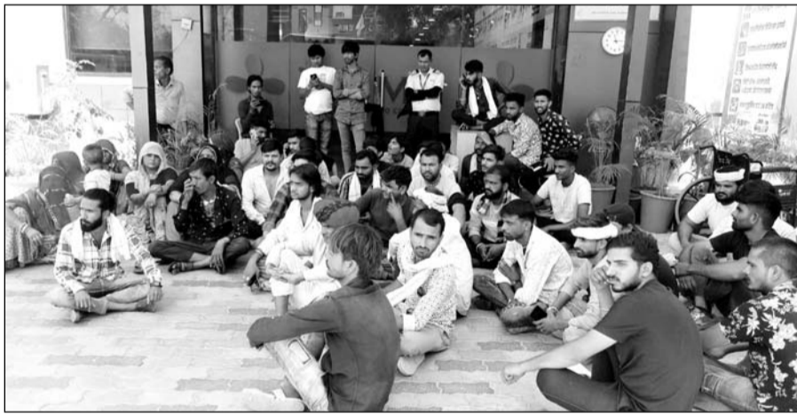
महिला मरीज की मौत के बाद हॉस्पिटल के बाहर मुआवजे की मांग को लेकर परिजनों ने हंगामा किया।

एलर्जी की समस्या के चलते महिला हॉस्पिटल आई थी