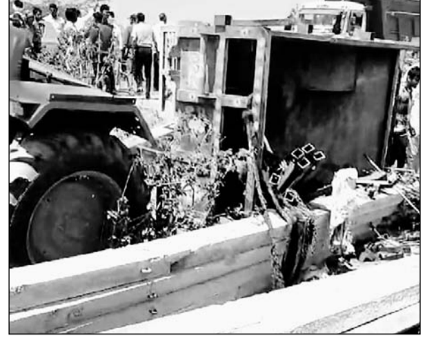
बिजली के पोल से भरी ट्रैक्टर-ट्रॉली सड़क किनारे पलट गई।

सरवाड़, (निर्स)। अजमेर-कोटा राजमार्ग पर प्रतापपुरा के पास गुरुवार को बिजली के पोल से भरी ट्रैक्टर-ट्रॉली अनियंत्रित होकर सड़क किनारे पलटी खा गई। हादसे में ट्रैक्टर में सवार