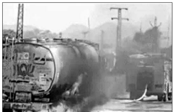
घटना की गंभीरता को देखते हुए पुलिस ने तुरंत हाइवे पर यातायात रोक दिया और वैकल्पिक मार्गों पर डायवर्ट कर ट्रैफिक व्यवस्था को नियंत्रित किया। हादसे के दौरान पुलिस की बार-बार चेतावनी के बावजूद कुछ लोग अपनी जान जोखिम में डालते हुए सुलगते टैंकर के बेहद करीब से दुपहिया वाहनों पर निकालते हुए नजर आए। इस लापरवाही के चलते हाइवे के दोनों ओर करीब डेढ़ से दो किलोमीटर तक लंबा जाम लग गया, जिससे यातायात पूरी तरह प्रभावित रहा।

■ चालक और खलासी ने टैंकर को सड़क किनारे खड़ा किया और सुरक्षित बाहर निकल गए