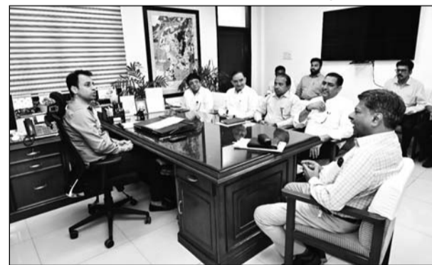
अधिकारियों के साथ औपचारिक बैठक लेकर ली विभिन्न परियोजनाओं की जानकारी।