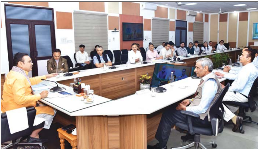
मुख्यमंत्री भजनलाल शर्मा ने गुरुवार को मुख्यमंत्री निवास पर "माय भारत डिजिटल प्लेटफॉर्म" के तहत प्रदेश में हो रही गतिविधियों की समीक्षा की।

मुख्यमंत्री ने अधिकारियों को निर्देश दिए कि युवाओं की अधिक से अधिक सहभागिता सुनिश्चित करते हुए नशा मुक्ति, फिटनेस और सामाजिक जागरूकता अभियानों के माध्यम से