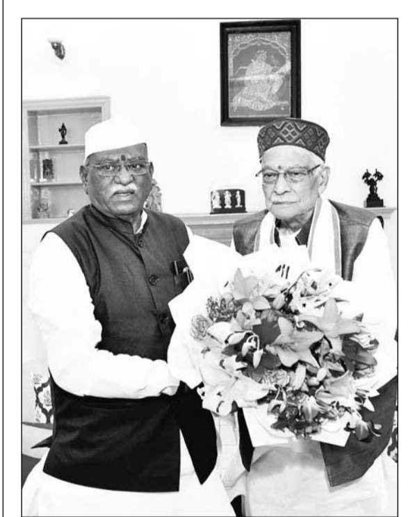
राज्यपाल हरिभाऊ किसनराव बागडे ने शनिवार को दिल्ली में पूर्व केंद्रीय मंत्री मुरली मनोहर जोशी के आवास पहुंचकर उनसे मुलाकात की। उन्होंने उनसे विभिन्न विषयों पर संवाद किया। राज्यपाल बागडे की जोशी से यह शिष्टाचार भेंट थी।

जयपुर, (का.सं.)। राज्यपाल हरिभाऊ किसनराव बागडे ने शुक्रवार और शनिवार को राष्ट्रपति भवन में राष्ट्रपति द्रौपदी मुर्मु की अध्यक्षता में आयोजित राज्यपालों के सम्मेलन में भाग लिया। बागडे राष्ट्रपति भवन में आयोजित इस सम्मेलन में एक भारत श्रेष्ठ भारत, 'एक वृक्ष मां के नाम' और प्राकृतिक खेती अभियान, राज्यपालों का जनता से सतत संपर्क, राज्यपालों की भूमिका और विभिन्न केंद्रीय एजेंसियों के बीच बेहतर समन्वय स्थापित करने में राज्यपालों की भूमिका जैसे विषयों के विभिन्न सत्रों में शामिल हुए। उल्लेखनीय है कि इस सम्मेलन में राष्ट्रपति द्रौपदी मुर्मु, उपराष्ट्रपति जगदीप धनखड़, प्रधानमंत्री नरेंद्र मोदी, केंद्रीय गृह मंत्री अमित शाह आदि ने संबोधित किया।