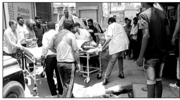
घायल लोगों को एंबुलेंस की सहायता से अस्पताल पहुंचाया।

कार में सवार लोग अमृतसर पंजाब से श्याम बाबा के दर्शनों के लिए खादूश्यामजी आ रहे थे