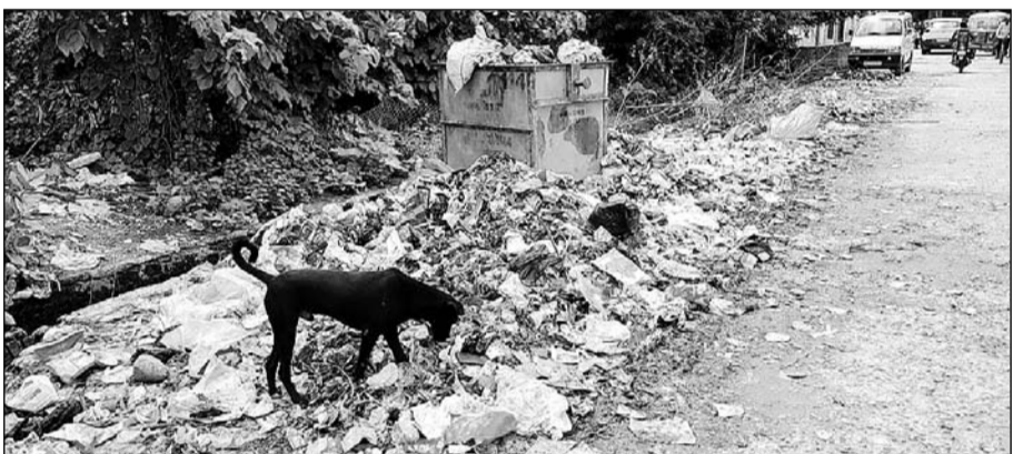
हड़ताल को आज 10 दिन हो गए हैं। जिस कारण धौलपुर शहर से कचरा नहीं उठाया जा रहा है।

गए हैं। बरसात का मौसम होने के कारण ये कचरा सड़ गया है और बुरी तरह दुर्गंध फैल रही है। जिस कारण लोगों का यहां से निकलना भी मुश्किल हो रहा है। पूरे मामले में बड़ा सवाल जिम्मेदारों