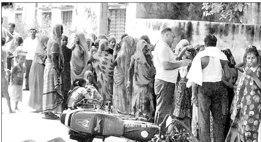
टक्कर से महिला की मौके पर ही मौत हो गई।

धौलपुर। जिले के मनियां थाना क्षेत्र में बाइक सवार एक महिला को अवैध चम्बल बजरी से भरे ट्रैक्टर ट्राली ने टक्कर मार दी। जिसके चलते मौके पर ही महिला की तड़पते हुए दर्दनाक मौत हो गई। वहीं बाइक चालक भी गंभीर रूप से घायल हो गया। घटना शनिवार दोपहर मनियां क्षेत्र के गांव किशनलाल के पुरा के पास की है, जहां अपनी बेटी से मिलकर वापस अपने घर लौट रही थी। तभी किशनलाल का पुरा रुंद का पुरा के पास बजरी से भरे ट्रैक्टर ट्राली ने बाइक को टक्कर मार दी। जिससे मौके पर ही महिला की