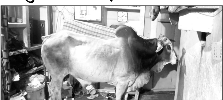
दो सांडों की हुई भयंकर लड़ाई में एक सांड छत के कमरे में घुसा

नदबई (निस)। शहर में नगर पालिका की अनदेखी से आबारा सांडों का आतंक लगातार बढ़ता जा रहा है। लोग अब घरों में भी सुरक्षित नहीं हैं। शहर में आबारा सांड बाजारों से लेकर मुख्य चौराहों और गलियों में दिनभर उतार मचाते हैं। पिछले 8 दिनों में आबारा सांड के हमले से 3 लोग गंभीर रूप से घायल भी हो चुके हैं। लेकिन फिर भी नगर पालिका प्रशासन जगान नहीं है। शुरुवात रात को शहर में एक अनोखा नजारा देखने को मिला। गली में 2 सांडों की भयंकर लड़ाई हो गई। लड़ते लड़ते दो सांडों में से एक सांड भागता हुआ एक घर की छत पर बने कमरे में पहुंच गया और कमरे में जाकर खड़ा हो गया घटना की सूचना पर नया के सफाई निरीक्षक अपनी टीम के साथ तुरंत मौके पर पहुंचे और आसपास के लोगों को मदद से सांड का रस्क्यू कर सकुशल उतारा।