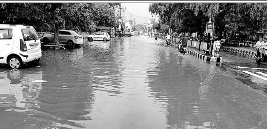
जालोर में बारिश के बाद कलेक्ट्रेट गेट के आगे पानी भर गया।

जालोर शहर के कई निचले इलाकों में बारिश के चलते पानी नजर आने लगा