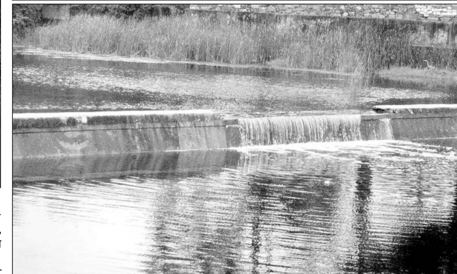
राजसमंद में मोही कस्बे के बनास नदी एनीकट पर चादर चलने से बहता पानी।

जिले में केचमेंट सहित कई जगहों पर अच्छी बारिश, झीलों में पानी की आवक शुरू होने की आस बंधी