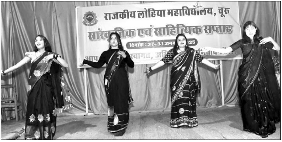
लोहिया महाविद्यालय में चल रहे सांस्कृतिक, साहित्यिक एवं खेलकूद सप्ताह में विद्यार्थियों ने विभिन्न प्रतियोगिताओं का आयोजन हुआ।

■ लोहिया महाविद्यालय में सांस्कृतिक सप्ताह का हुआ समापन