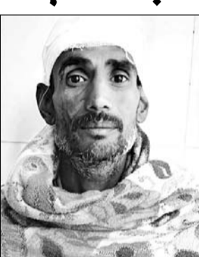
हमले में घायल युवक।