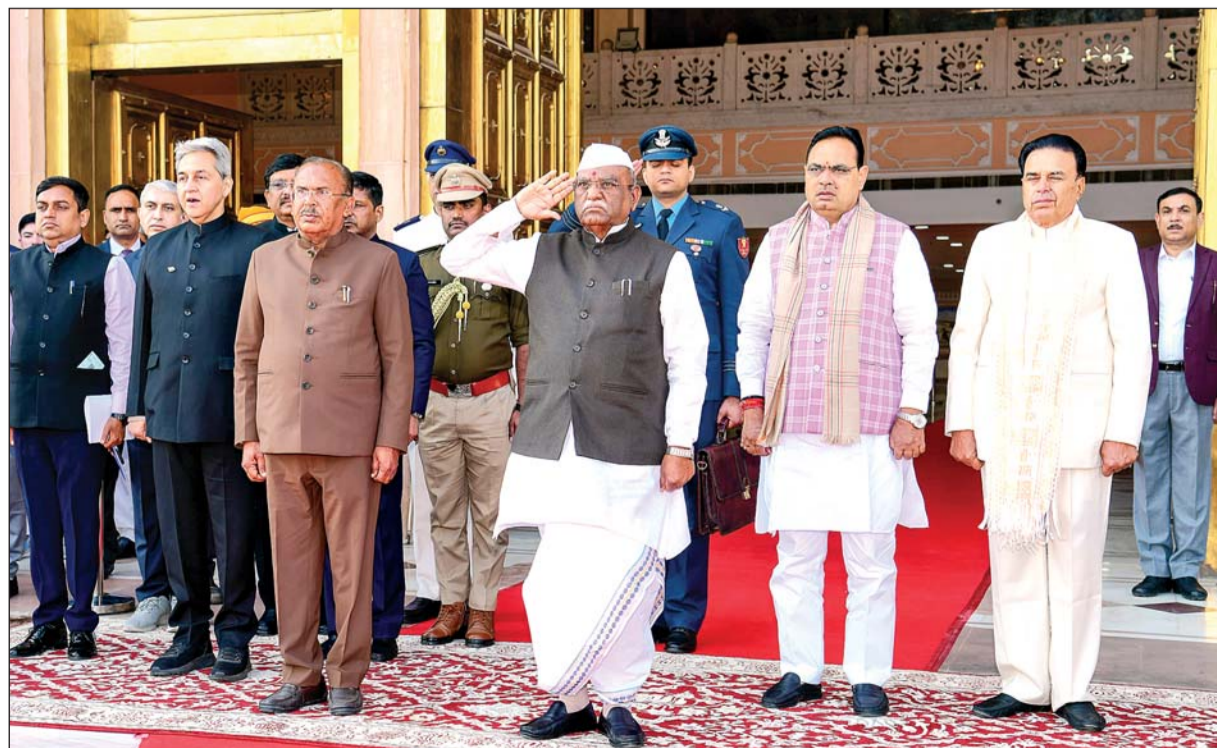
राज्यपाल हरिभाऊ बागड़े ने 16वीं विधानसभा के तीसरे सत्र के प्रथम दिन करीब 1 घंटे 26 मिनट अभिभाषण पढ़ा। उन्होंने पिछली कांग्रेस सरकार को पेपरलीक, जल जीवन मिशन घोटाले, थर्मल प्लांट्स में कोयले की कमी, राजस्थान में बिजली संकट सहित कई मुद्दों पर घेरा।

वसुंधरा राजे के नेतृत्व वाली सरकार ने शुरू किया था। दुर्भाग्य से, विगत सरकार के समय राजनीतिक लाभ के कारण इस परियोजना को अटकया जाता रहा। हमारी सरकार ने इसे राम जल सेतु परियोजना का नाम दिया। मध्य प्रदेश के साथ इस परियोजना को लेकर एमओयू (शेष अंतिम पृष्ठ पर)