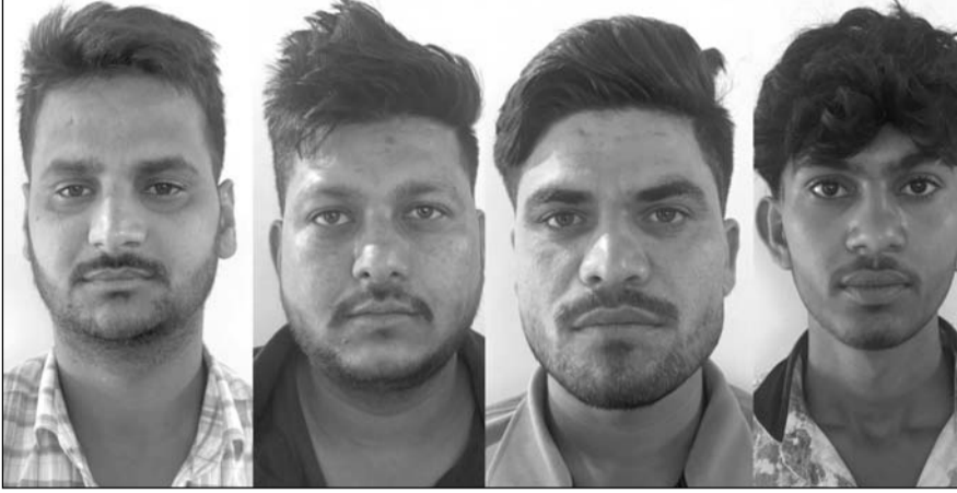
बरोनी पुलिस ने अपहरण करने के आरोपियों को गिरफ्तार किया।