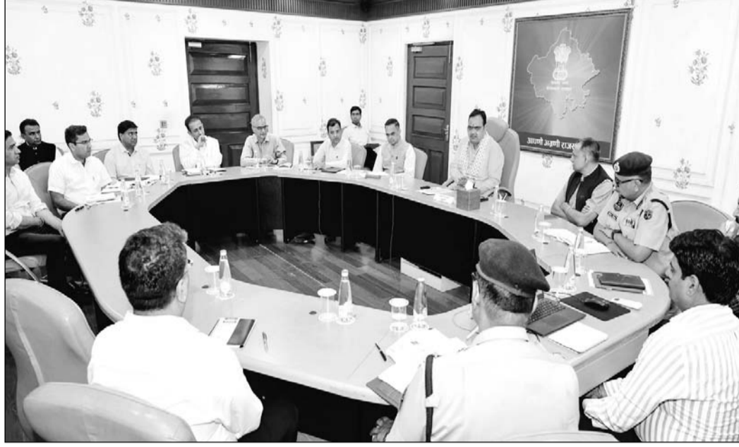
मुख्यमंत्री भजनलाल शर्मा ने गुरुवार को जयपुर शहर के यातायात सुधार के लिए अधिकारियों की उच्चस्तरीय बैठक ली।

-कार्यालय संवाददाता- जयपुर। मुख्यमंत्री भजनलाल शर्मा ने जयपुर शहर की यातायात व्यवस्था के रीयल टाइम मैनेजमेंट के लिए नया इंटीग्रेटेड कमाण्ड सेंटर स्थापित करने की कार्ययोजना बनाने के लिए जेडीए, परिवहन, ट्रैफिक पुलिस और नगर निगम को आपसी समन्वय से काम करने के विशेष दिशा-निर्देश दिए हैं। उन्होंने कहा कि यातायात प्रबंधन एवं सुरक्षा की दृष्टि से इस सेंटर को मॉडल सेंटर भी बनाया जाए। शर्मा गुरुवार को मुख्यमंत्री कार्यालय में जयपुर शहर के यातायात सुधार के लिए आयोजित बैठक की अध्यक्षता कर रहे थे। उन्होंने कहा कि, जयपुर शहर में यातायात प्रबंधन एवं सुधार के लिए प्रगतिरिक्त विभिन्न जेडीए प्रोजेक्ट्स को समय-समय पर पूरा करें। इस काम में लापरवाही बरतने वाले जिम्मेदार अधिकारी तथा निर्माणकर्ता के विरुद्ध परफॉर्मस एवं लिक्विडिटी पैनल्टी की कार्यवाही की जाए। यातायात को सुगम एवं सुरक्षित बनाने की कार्ययोजना को जेडीए एवं यातायात पुलिस संबंधित विभागों से समन्वय स्थापित कर शीघ्र लागू करें। उन्होंने जेडीए की सीबीआई फाटक, सालिग्रामपुरा फाटक एवं सिविल लाइन फाटक आरओबी, गोपालपुरा एलिबेटेड रोड, सांगानेर एलिबेटेड रोड के काम को गति प्रदान करने एवं पूर्ण गुणवत्ता से पूरा करने के लिए निर्देशित किया। साथ ही, उन्होंने जेलएन मार्ग पर यातायात प्रबंधन का प्रभावी प्लान बनाने के भी निर्देश दिए।