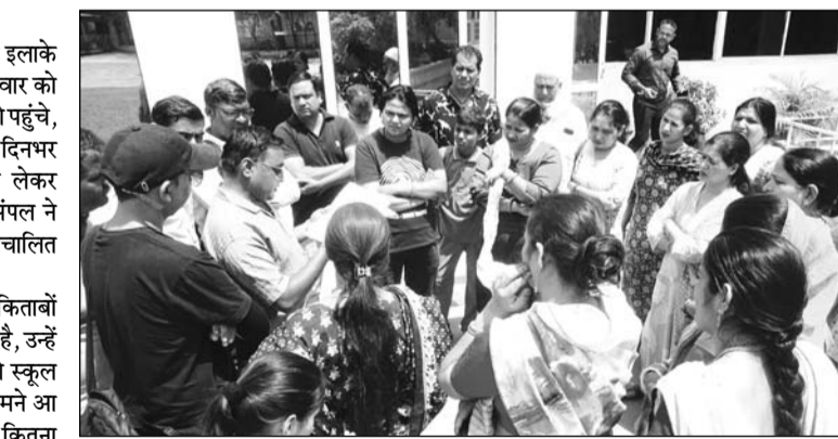
राजधानी जयपुर के श्याम नगर इलाके में “ट्री हाऊस हाई स्कूल” तीसरे दिन गुरुवार को भी बंद रहा, जिसे लेकर अभिभावकों ने कड़वी नाराजगी जताई।