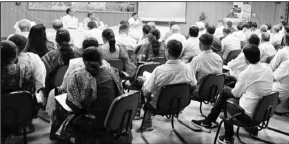
राजस्थान कृषि विश्वविद्यालय बीकानेर में जर्क कार्यशाला का आयोजन किया गया।

के बीकानेर चरु जैसलमेर के कृषि ए उधानिकी आत्मा के वरिष्ठ अधिकारी व विश्वविद्यालय तथा कृषि विज्ञान केन्द्र के कृषि वैज्ञानिकों ने भाग