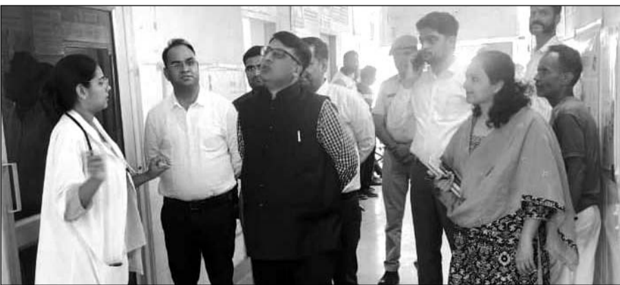
जिला कलेक्टर निशांत जैन ने सेरुणा के प्राथमिक स्वास्थ्य केन्द्र का किया निरीक्षण।

जिला कलेक्टर ने सेरुणा में प्राथमिक स्वास्थ्य केन्द्र का निरीक्षण किया। यहां दवाइयों की उपलब्धता, स्टाफ की उपस्थिति के बारे में जाना। मरीजों से व्यवस्था संबंधी फीडबैक लिया तथा परिसर में साफ-सफाई रखने के निर्देश दिए। उन्होंने यहां बाई, लैब तथा मुख्यमंत्री नि:शुल्क दवा वितरण केन्द्र की व्यवस्थाएं देखीं। उन्होंने सेरुणा में संचालित सार्वजनिक पुस्तकालय का निरीक्षण किया तथा यहां विभिन्न प्रतीकाओं की तैयारी कर रहे युवाओं को बेहतर वातावरण उपलब्ध करवाने को