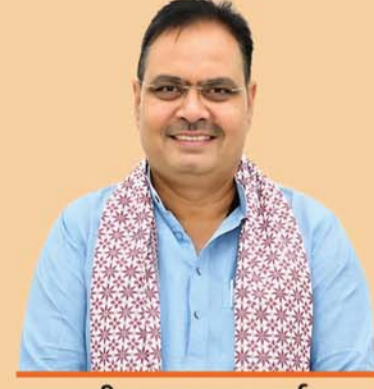
श्री भजनलाल शर्मा माननीय मुख्यमंत्री