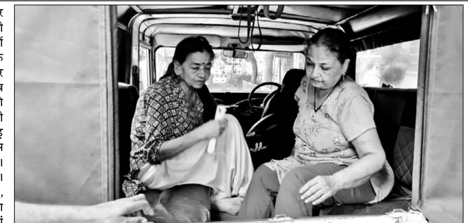
पुलिस ने दोनों महिलाओं को बदमाशों के चंगुल से छुड़वाया।

अजमेर, (कास)। अजमेर में शनिवार की सुबह दिल्ली नम्बर की एसयूवी वाहन में करीब तीन से चार बदमाशों द्वारा दो महिलाओं का अपहरण करके ले जाने का मामला प्रकाश में आने पर पुलिस महकमे में अफरा-तफरी मच गई। जिला पुलिस कंट्रोल रूम को सूचना मिलने पर कंट्रोल रूम प्रभावी ने तुरंत जनाना अस्पताल कायड एमडीएस यूनिवर्सिटी तथा आसपास के इलाके में नाकाबंदी करवा दी। पुलिस को भी दौड़ाया गया। अपहरणकर्ता शांतिर बदमाश थे, जिसके चलते पुलिस को पीछा करता देख उन्होंने गाड़ी को तेज गति में यहां से वहां दौड़ाना शुरू किया, आखिर में कायड गांव में तीन थायों की पुलिस ने घेराबंदी करके गाड़ी को रुकवाया और अपहरण की गई महिलाओं को बदमाशों के चंगुल से छुड़कर सुरक्षित अपने निगरानी में लिया।