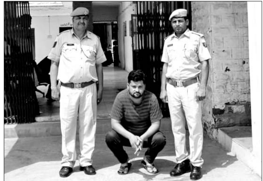
पुलिस ने विधवा महिला को स्लो पॉइजन देने के मामले में आरोपी को गिरफ्तार किया।