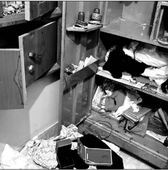
चोरी की वारदात के बाद सामान बिखरा पड़ा है।

जानकारी के अनुसार शुरुवार की रात्रि में कस्बे के वार्ड 7 में दो सगे भाइयों के बंद मकानों के ताले तोड़कर चोरों ने