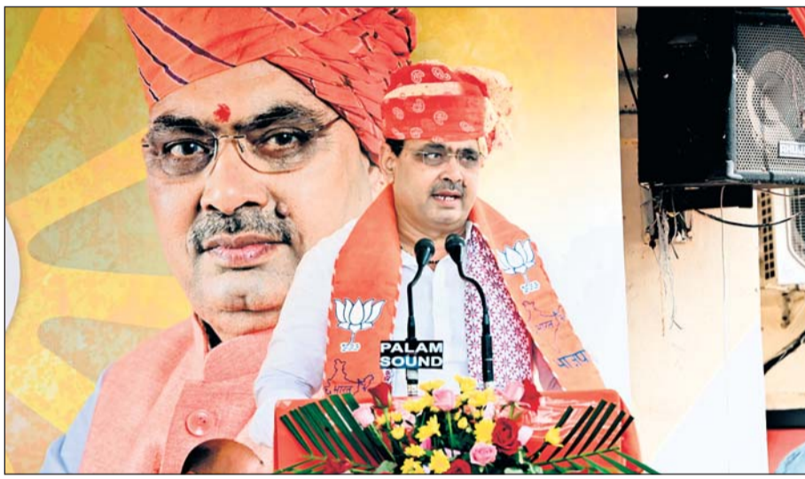
जापान और उत्तर कोरिया की यात्रा के बाद वापस लौटने पर जयपुर एयरपोर्ट से लेकर भाजपा प्रदेश कार्यालय तक मु. मंत्री भजनलाल शर्मा का भव्य स्वागत किया गया। भाजपा प्रदेश मुख्यालय में मु. मंत्री ने कार्यकर्ताओं को संबोधित करते हुये कहा, जापान के निवेशकों ने राजस्थान में निवेश के विषय में बहुत ही पॉजिटिव प्रतिक्रिया दी है।

और भाजपा कार्यकर्ताओं ने ढोल नगादों, बैंड-बाजों के साथ पुष्प वर्षा के बीच भाजपा प्रदेश कार्यालय में मुख्यमंत्री भजनलाल शर्मा का अभिनंदन किया। भाजपा के कार्यकर्ताओं का अपार प्रेम, स्नेह और भरोसा देखते हुए मुख्यमंत्री भजनलाल शर्मा ने सभी को धन्यवाद देते हुए यह विश्वास दिलाया कि भाजपा की सरकार प्रदेश के विकास की दिशा में नए आयाम