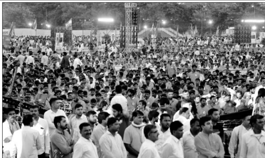
कार्यक्रम में आसपास के जिलों से हजारों की संख्या में युवा पहुंचे।

चिचौड़गढ़/जयपुर। भाजपा प्रदेश अध्यक्ष सीपी जोशी के लोकसभा क्षेत्र चिचौड़गढ़ में नव मतदाताओं के भव्य और विशाल अभिनंदन का कार्यक्रम आयोजित हुआ, जिसमें हजारों नव मतदाताओं का अभिनंदन किया गया। कार्यक्रम को लेकर प्रधानमंत्री नरेंद्र मोदी की नीति, रीति, राष्ट्रवादी सोच, विकास कार्य और योजनाओं से