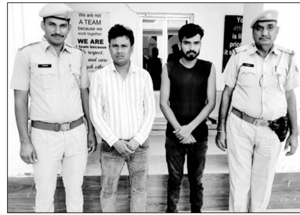
सिटी थाना पुलिस ने गबन के मामले में दो जनों का गिरफ्तार किया।