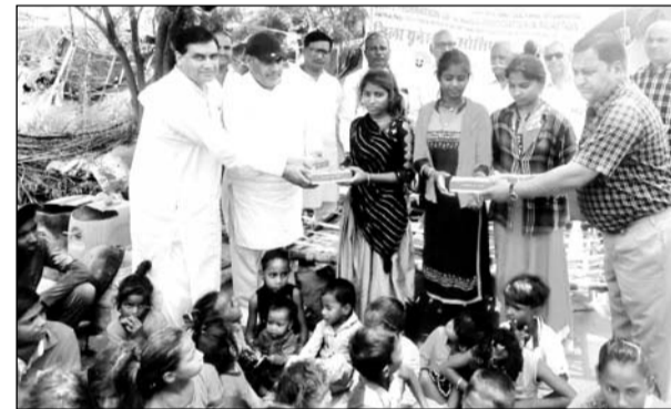
भारतीय यूनेस्को क्लब के सदस्यों ने बच्चियों से राखी बंधवाई।

भीलवाड़ा, (निर्स)। स्टेट फेडरेशन ऑफ यूनेस्को एसोसिएशन इन राजस्थान में जुटे हैं, वहीं यूनेस्को एसोसिएशन के तत्वावधान में भारत के राष्ट्रीय पर्व रक्षाबंधन के अवसर पर भारतीय यूनेस्को क्लब महासंघ के राष्ट्रीय उपाध्यक्ष गोपाल लाल माली के सानिध्य में यूनेस्को क्लब के सदस्यों ने नए अंदाज में रक्षाबंधन त्योहार मनाया। यूनेस्को क्लब के सदस्यों ने झोपड़ियों में रह रही बच्चियों से राखी बंधवाकर शगुन के तौर पर सभी बच्चियों को सौ-सौ रूपये व एक-एक मिठाई का डिब्बा व राखियां सहित अन्य सामग्री दी। एक तरफ जहां खुद के घरों को संवारने व अपने बच्चों के लिए मिठाई की व्यवस्था में जुटे हैं, वहीं यूनेस्को सदस्यों ने झुग्गी झोपड़ियों के गरीब महिलाओं व बच्चों के साथ रक्षाबंधन त्योहार मनाया। राष्ट्रीय उपाध्यक्ष माली ने कहा कि आज भी कच्ची बस्तियों के मौलिक सुविधाएं उनके परिवार को नहीं मिल पा रही हैं। इन सब बातों को दृष्टिगत