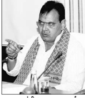
मुख्यमंत्री भजनलाल शर्मा

-कार्यालय संवाददाता- जयपुर। मुख्यमंत्री भजनलाल शर्मा के निर्देश पर पुलिस मुख्यालय से अतिरिक्त महानिदेशक (एडीजी) स्तर के वरिष्ठ पुलिस अधिकारियों को अपनी रैंज के पुलिस जिलों की विजिट के दौरान वहां कमजोर वर्गों, महिला व बच्चों के विरुद्ध अपराध एवं साइबर सुरक्षा से मामलों पर नियंत्रण के लिए किए जा रहे प्रयासों के साथ ही इनके पेंडिंग प्रकरणों की समीक्षा के लिए पाबंद किया गया है। इसके अलावा सभी रैंज प्रभारी एडीजी मादक पदार्थों से संबंधित मामलों की स्थिति एवं अन्य गंभीर प्रकृति के अपराधों पर नियंत्रण की समीक्षा कर पेंडिंग प्रकरणों के बारे में अपनी रिपोर्ट पुलिस मुख्यालय को प्रस्तुत करेंगे।