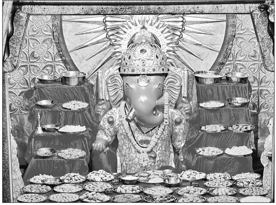
गणेश जन्मोत्सव समारोह के तहत दूसरे दिन रविवार को छप्पन भोग की झांकी सजाई।