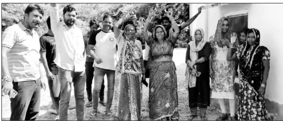
बड़ा मोहल्ला के लोगों ने विरोध प्रदर्शन कर टूटी सड़कों को ठीक करवाने, वाडों में नियमित रूप से सफाई करने की मांग की है।