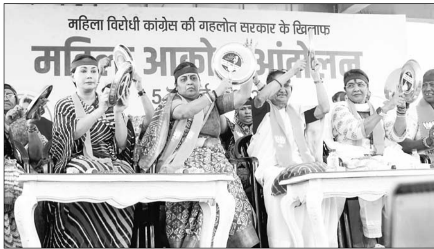
भाजपा प्रदेश कार्यालय के बाहर सभा आयोजित की गई जिसे महिला नेत्रियों ने संबोधित किया।

अकर्मण्यता से प्रदेश महिला अपराध में देश के शीर्ष राज्यों में शुमार हो गया है। महिलाएं ना घर में, ना खेत में, ना सड़कों पर, ना एंगुलेंस में, ना अस्पतालों में, ना विद्यालय में, ना पुलिस थाने में, प्रदेश में किसी भी स्थान पर सुरक्षित नहीं है। सड़कों पर पति के सामने सामूहिक दुष्कर्म किया जाता है,