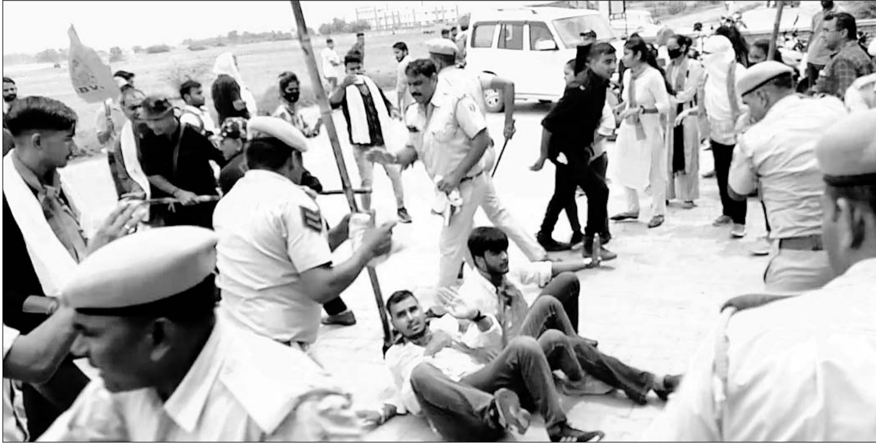
महाराजा सूरजमल ब्रज विश्वविद्यालय में प्रदर्शन कर रहे छात्रों पर पुलिस ने बल का प्रयोग किया।

महाराजा सूरजमल ब्रज विश्वविद्यालय में फीस वृद्धि को लेकर प्रदर्शन कर रहे थे छात्र