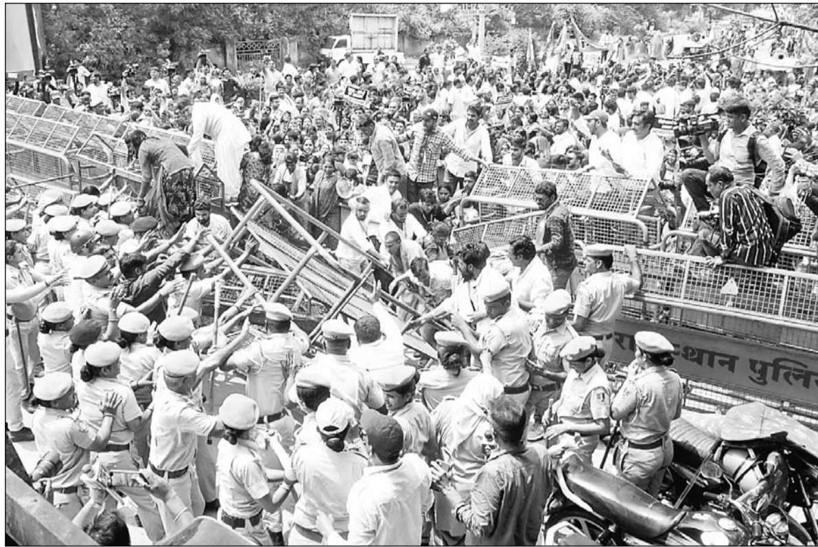
प्रदेश में महिलाओं पर बढ़ रहे अत्याचारों के खिलाफ जयपुर में भाजपा महिला मोर्चा की आक्रोश सभा आयोजित हुई। इसमें महिलाओं ने थाली नाद कर मुख्यमंत्री आवास की तरफ कूच कर प्रदर्शन किया।

जयपुर प्रदेश में महिलाओं पर बढ़ रहे अत्याचारों के खिलाफ भाजपा महिला मोर्चा की आक्रोश सभा आयोजित हुई। जिसमें महिलाओं ने थाली नाद कर मुख्यमंत्री आवास की तरफ कूच कर प्रदर्शन किया। इस दौरान भाजपा की प्रमुख महिला नेताओं ने महिलाओं को संबोधित किया। इसके बाद बड़ी संख्या में महिलाओं ने सीएम आवास की ओर कूच किया। सीएम आवास की ओर जा रही महिलाओं और पुलिस के बीच बैरिकेडिंग तोड़ने को लेकर जमकर झड़प हुई। जिसमें महिला मोर्चा की नेताओं सहित करीब दर्जन भर से ज्यादा महिलाएं घायल हुईं। इसके अलावा प्रदर्शन के दौरान महिलाओं