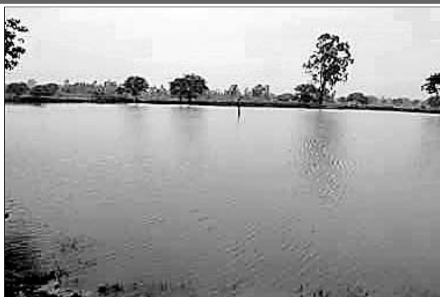
सादुलपुर क्षेत्र के बरसात से भाकरा गांव की रोही में भरा बरसात का पानी।