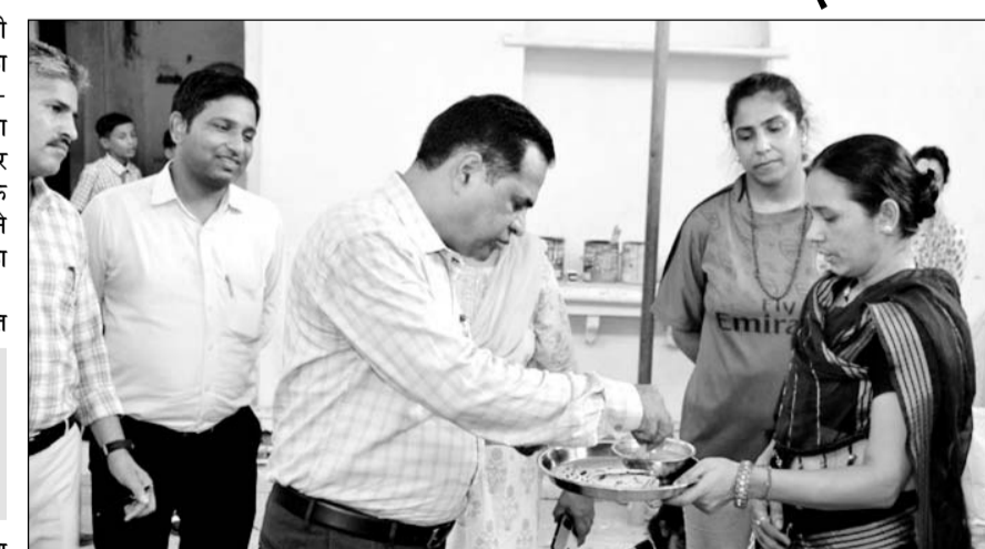
कोटा जिला कलेक्टर ने स्कूलों में मिड-डे-मील का आकस्मिक निरीक्षण किया।

कोटा, (निसं)। जिला कलेक्टर ओपी बुनकर ने बुधवार को विद्यालयों का आकस्मिक निरीक्षण कर मिड-डे-मील, बाल गोपाल दूध वितरण योजना एवं शैक्षणिक गुणवत्ता की जांच कर संबंधित अधिकारियों को आवश्यक निर्देश प्रदान किए। जिला कलेक्टर ने इस दौरान शिक्षक बनकर बच्चों का शैक्षिक स्तर भी परखा।