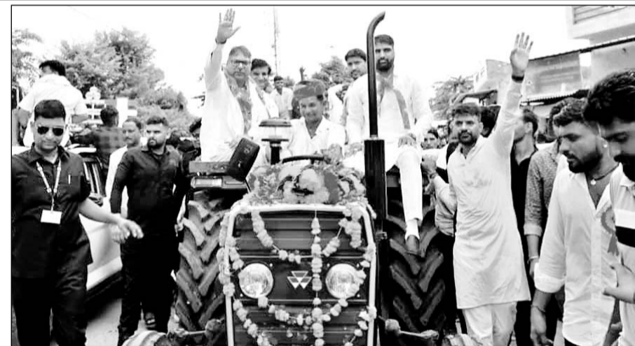
भाजपा पूर्व प्रदेशाध्यक्ष डॉ. सतीश पूनिया का परबतसर के गांव पीह में लोगों ने स्वागत किया।

डॉ. पूनिया ने गौशाला भूमि पूजन जनसभा को संबोधित करते हुए कहा कि इस विशाल जनसभा में और गौशाला भूमि पूजन में गांव ढाणियों से पधारी