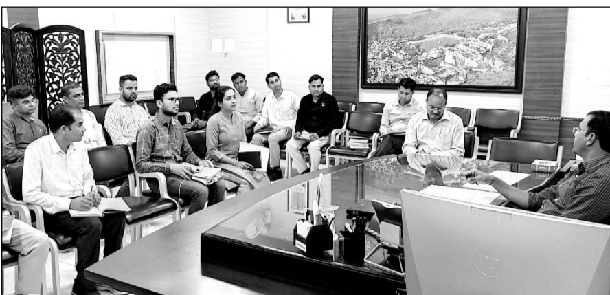
जिला कलेक्टर डॉ. रविन्द्र गोस्वामी ने 'सिंगल यूज प्लास्टिक प्रतिबंध की सख्ती को लेकर बैठक ली।

बैठक में जिला कलेक्टर ने निर्देश दिए कि जिले में होने वाले किसी भी सरकारी आयोजन में सिंगल यूज प्लास्टिक का उपयोग नहीं किया जावे। उन्होंने निर्देश दिए कि सरकारी आयोजनों में सिंगल यूज प्लास्टिक के प्रतिबंधों की सख्ती से पालना सुनिश्चित करवाई जाए। इसके अलावा विभिन्न कार्यों के लिए जारी होने वाली निविदा की शर्तों में इसका उल्लेख किया जावे। जिला कलेक्टर ने नगर परिषद आयुक्त को निर्देश दिए कि शहर के मैरिज गार्डनों में शादी समारोह के दौरान