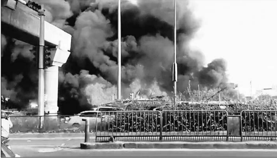
मानसरोवर मेट्रो स्टेशन के पास बांस व बेंत से बनी 40 से ज्यादा झुगियां-झोपड़ियों में बुधवार शाम भीषण आग लग गई। आग की लपटें और धुएं का गुब्बारा करीब 10 किलोमीटर दूर तक ताण्डव बयां करता दिखा। आग से उनमें रहने वाले परिवारों में भद्रगड़ के साथ ही चौख-पुकार मच गई।

जयपुर (का.सं.)। मानसरोवर मेट्रो स्टेशन के पास बांस व बेंत से बनी 40 से ज्यादा झुगियां-झोपड़ियों में बुधवार शाम भीषण आग लग गई। सिविल डिफेंस और अग्निशमन कर्मचारियों ने आग में फंसे 15 महिलाओं और बच्चों को सुरक्षित बाहर निकालकर उनकी जान बचाई। 20 दमकलों ने 40 से ज्यादा फेरे लगाकर करीब 2 घंटे में पर काबू पाया। आग की लपटें और धुएं का गुब्बारा करीब 10 किलोमीटर तक दूर तक ताण्डव बयां करता दिखा। एक साथ करीब चालीस झुगियों में लगी आग से उनमें रहने वाले परिवारों में भद्रगड़ के साथ ही चौख-पुकार मच गई। हादसे में लाखों रुपए के घरेलू सामान सहित अन्य माल जलकर राख हो गया। पुलिस ने मामला दर्ज कर हादसे के कारणों की पड़ताल शुरू कर दी है।