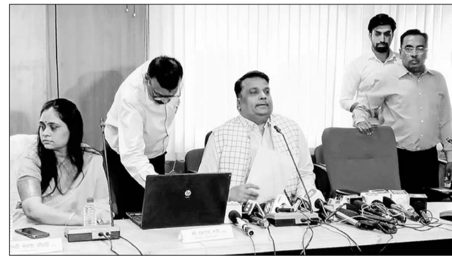
बोर्ड प्रशासक ने एल.एन. मंत्री ने बटन दबाकर परिणाम घोषित किया।

कोरोना के चलते बिना परीक्षा लिए ही परिणाम जारी किया था। कोविड दौर में जारी परिणाम से यूं तो प्रतिभाशाली विद्यार्थियों को बहुत निराशा हुई थी। इस बार जब बोर्ड ने परीक्षा आयोजित की और विद्यार्थियों ने शालाओं में जाकर पढ़ाई की तो माना जा रहा था