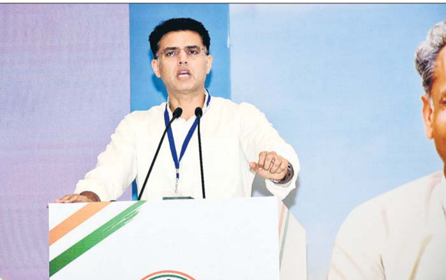
पूर्व उपमुख्यमंत्री एवं टॉक विधायक सचिन पायलट ने बुधवार को जयपुर में आयोजित कांग्रेस के “एक्शन टेकन कैम्प” को संबोधित किया।

इससे पहले सुबह भी सचिन पायलट ने मुख्यमंत्री अशोक गहलोत पर तंज कसते हुए राजस्थान में सरकार