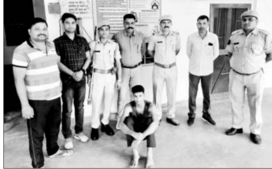
सीसीटीवी फुटेज के आधार पर ट्रक यूनिवर्न गंगापुरसिटी से दस्तयाब किया।

आरोपी को कोर्ट में तपतीश के बाद जेल भेजा