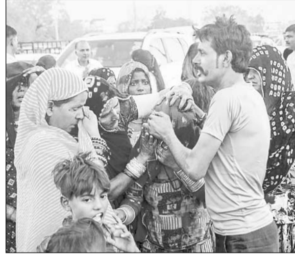
20 दमकलों ने 40 से ज्यादा फेरे लगाकर आग पर काबू पाया, सिविल डिफेंस टीम ने भी लोगों को बचाने में मदद की