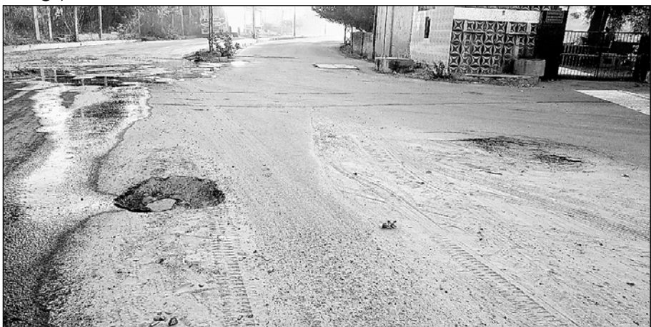
सांभर के गौरव पथ पर पिछले 6 माह से गहरे गड्ढे दुर्घटना को न्योता दे रहे हैं।

सांभरझील, (निस)। पर्यटक नगरी का दर्जा प्राप्त सांभर उपखंड मुख्यालय के प्रमुख रास्ते वाहन चालकों व राहगीरों के लिए बेहद कठिन साबित हो रहे हैं। विगत 20 दशकों में पालिका प्रशासन की ओर से लाखों रुपए खर्च कर सीसी सड़कें बनाई जा चुकी हैं लेकिन देखने में प्रायः आया है कि जब भी सड़कें क्षतिग्रस्त हो जाती हैं तो उन्हें ठीक करवाने के लिए कोई ठोस कदम नहीं उठाए जाते हैं। सड़कों की खस्ताहाल व्यवस्था को दुरुस्त करवाने के लिए जनप्रतिनिधियों की भूमिका भी निष्क्रिय बनी हुई है। टूटी फूटी सड़कों से गुजरने वाले वाहन चालकों के लिए यह सफर आसान नहीं है। इसकी वजह से अनेक दफा दुर्घटना के मामले भी