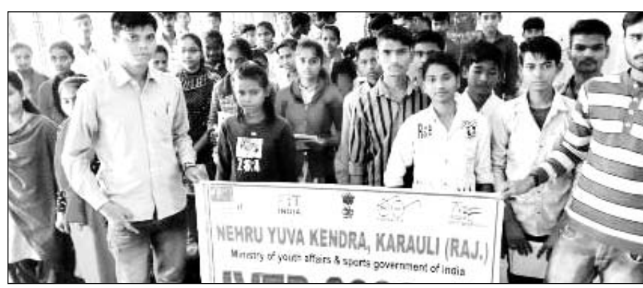
करौली में नेहरू युवा केन्द्र द्वारा आईवीईपी कार्यक्रम चलाया जायेगा।

करौली (निस)। युवा कार्यक्रम एवं खेल मंत्रालय भारत सरकार के नेहरू युवा केंद्र करौली द्वारा इंटरसिव वॉलंटियर इनरोलमेंट प्रोग्राम चलाया जा रहा है। इस कार्यक्रम के अंतर्गत 15 से 29 साल के युवाओं का 3 साल के लिए पंजीयन किया जाएगा। जिसमें