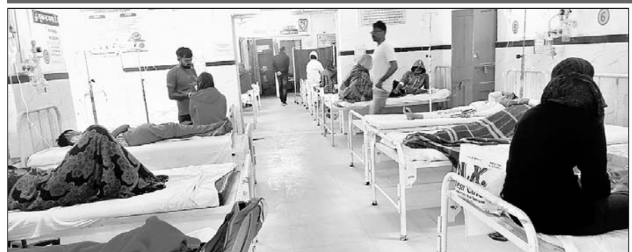
पावटा अस्पताल में भर्ती मरीज।

अस्पतालों में बुखार के मरीजों की भारी भीड़