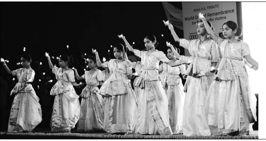
यू.एन. वर्ल्ड डे ऑफ रिमिम्बर्स फ्रॉर रोड ट्राफिक विक्टिम्स के अवसर पर रविवार शाम को जयपुर शहर की मुस्कान फाउंडेशन फॉर रोड सेफ्टी की ओर से जवाहर कला केंद्र के मध्यवर्ती में सड़क दुर्घटनाओं में जान गवां चुके लोगों को याद करते हुए उन्हें श्रद्धांजलि अर्पित की गई।

जयपुर। यूएन वर्ल्ड डे ऑफ रिमिम्बर्स फ्रॉर रोड ट्राफिक विक्टिम्स के अवसर पर रविवार शाम को जयपुर शहर की मुस्कान फाउंडेशन फॉर रोड सेफ्टी द्वारा जवाहर कला केंद्र (जेकेके) के मध्यवर्ती में सड़क दुर्घटनाओं में जान गवां चुके लोगों को याद करते हुए उन्हें श्रद्धांजलि अर्पित की गई। इस अवसर पर कमिश्नर ऑफ पुलिस, आईपीएस, बीजू जॉर्ज जोसेफ मुख्य अतिथि के रूप में उपस्थित रहे। उन्होंने कहा कि छोटे-छोटे ट्रैफिक नियमों का पालन करके हम बड़े हादसों को रोक सकते हैं। इसके लिए जन जागरूकता बहुत आवश्यक है। सिविल लाईस विधायक, गोपाल शर्मा ने कहा कि आमजन को हेल्मेट लगाना, ट्रैफिक लाईट का पालन करना और वाहनों की ओवरलोडिंग को रोकने जैसे ट्रैफिक नियमों का सख्ती से पालन करना चाहिए। इससे आए दिन होने वाली सड़क दुर्घटनाओं में भारी कमी आएगी। इस अवसर पर जयपुर सिटीजन फोरम के चेयरमैन राजीव अरोड़ा, पूर्व डीजीपी एवं मुस्कान