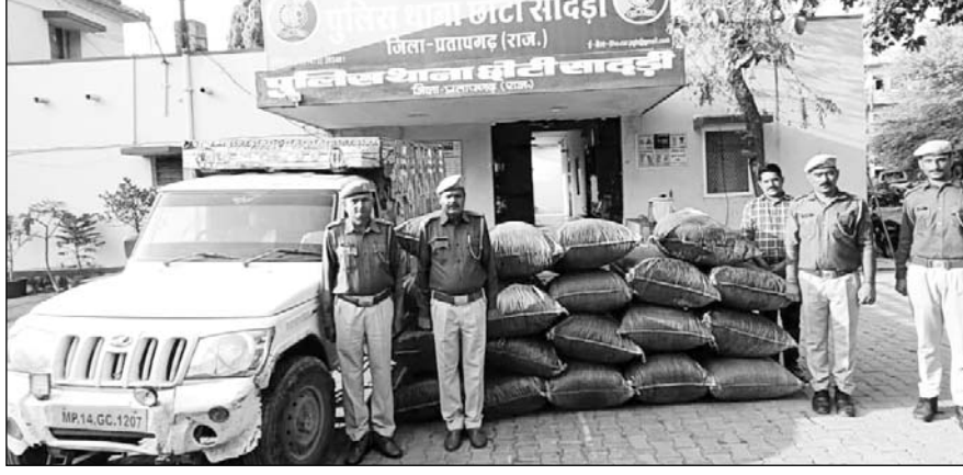
छोटी सादड़ी थाना पुलिस की टीम ने 325 किलो डोडा-चूरा जब्त किया।