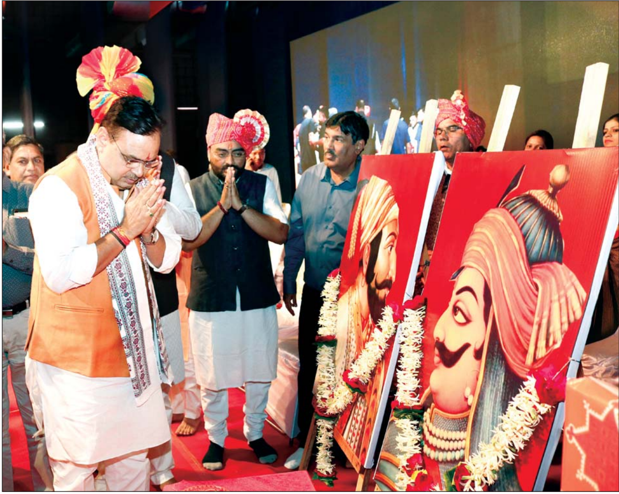
महाराष्ट्र में चुनाव प्रचार के दौरान राजस्थान के मुख्यमंत्री भजनलाल शर्मा ने प्रवासी राजस्थानी सम्मेलनों में भाग लिया। प्रवासी राजस्थानियों ने उनका भावभंगी स्वागत किया।