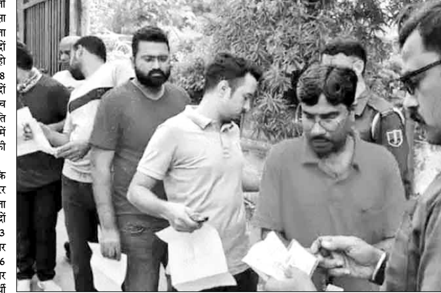
परीक्षा केंद्र पर जांच के बाद परीक्षा देने जाते अभ्यर्थी।