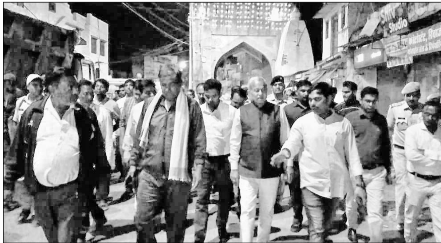
व्यापारियों व सफाईकर्मियों के सवालों से बचने के लिए मंत्री गर्ग ने रात में शहर का निरीक्षण किया।

देने के लिए हल निकालना चाहिए। मंत्री सुभाष गर्ग ना जाने क्यों नगर निगम की समस्या से भाग रहे हैं। न्यायपालिका द्वारा सफाईकर्मियों को आंदोलन व धरना प्रदर्शन नहीं करने के लिए पाबंद करना भी दुर्भाग्यपूर्ण है। यह भी देखने योग्य बात है कि न्यायपालिका को प्रभावशाली व्यक्तियों के प्रभाव में ना आकर मानवीय व लोकतांत्रिक पहलु को ध्यान में रखना चाहिए। मंत्री सुभाष गर्ग को यह बताना चाहिए कि वह जनविरोधी नीतियों को लागू करने वाली कंपनी और व्यक्तियों के पक्ष में क्यों हैं। जनता से सामना दिन में क्यों नहीं करते। मंत्री डॉ. सुभाष गर्ग का सफाई कंपनी से ऐसा क्या लगाव है कि जनता व सफाईकर्मियों का नुकसान कर रहे हैं।