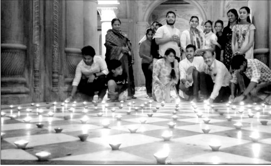
भरतपुर में गंगा महारानी मंदिर पर महाआरती के साथ भव्य सजावट की।

भरतपुर (निस)। पर्यटन एवं देवस्थान विभाग के द्वारा गुरुवार को गंगा महारानी मंदिर पर महाआरती, भव्य सजावट एवं भजन संध्या कार्यक्रम का आयोजन किया गया।