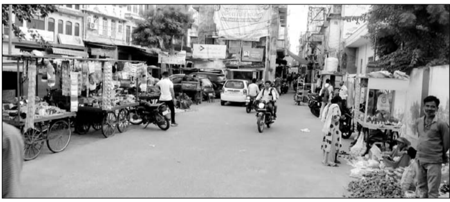
ग्राहकों के इंतजार में खाली पड़ा फुलेरा का बाजार।

फुलेरा, (निर्स)। फुलेरा कस्बे के बाजारों में दीपावली के त्यौहारी सीजन के बावजूद भी भीड़ गायब है। गौरतलब है कि पिछले कुछ वर्षों पूर्व बाजारों में ग्राहकों की भीड़ लग जाती थी परन्तु धीरे-धीरे कम होते होते अब तो मानो की बाजार से ग्राहकों की भीड़ गायब हो गई। इसका मुख्य कारण है कोरोना काल व ऑनलाइन खरीददारी हैं। बड़े ब्रांडों वाली कंपनियों ने ई-कॉमर्स कम्पनियों को माल सप्लाई कर ग्राहकों को होम डिलीवरी करना शुरू कर दी है। ग्राहकों को ऑनलाइन खरीदारी के दुष्परिणाम समझ में आने लगे हैं। ई-कॉमर्स कंपनियों प्रोजेक्ट की एमआरपी को बढ़ा चढ़ा कर बताती है। फिर इस पर डिस्काउंट देकर ग्राहकों को लुभाती है। अधिकतर ऑन-लाइन खरीददारी में खराब प्रोडक्ट को वापस करने का विकल्प भी नहीं होता। फिर भी ग्राहक ज्यादा से ज्यादा ऑनलाइन खरीददारी करने में ही विश्वास करते हैं।