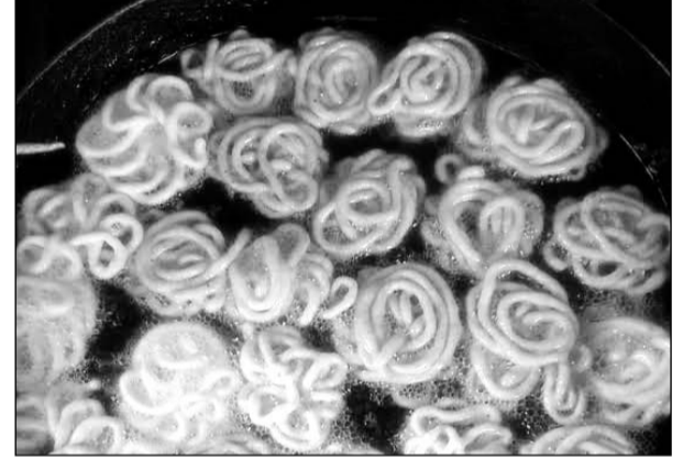
भीलवाड़ा जिले की प्रसिद्ध मिठाई "मुरका"।

■ दिवाली के सिर्फ 20 दिन ही बनती है ये मिठाई, लाखों का कारोबार