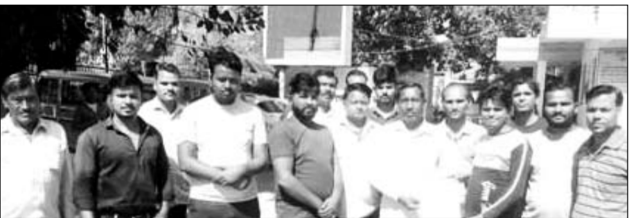
भाजपा कार्यकर्ताओं ने गंगापुर सिटी में पेयजल समस्या के समाधान को लेकर कलेक्टर के नाम एडीएम सवाईमाधोपुर को ज्ञापन दिया।

करोली (नि.स.)। आगामी 2 दिन बाद शुरू होने वाले पांच दिवसीय दीपोत्सव पर्व पर इस बार उप जिला कलेक्टर कार्यालय में कार्यरत लिपिक की हठधर्मिता के कारण शहर में आतिशबाजी नहीं हो पाएगी इसके चलते पटाखा व्यापारियों ने लिपिक जिला कलेक्टर को ज्ञापन पेशकर शिकायत की है।