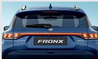
NEXTre' Rear Combination Lights