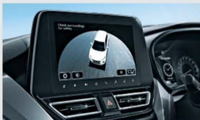
360 View Camera