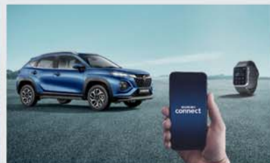
In-Built Suzuki Connect