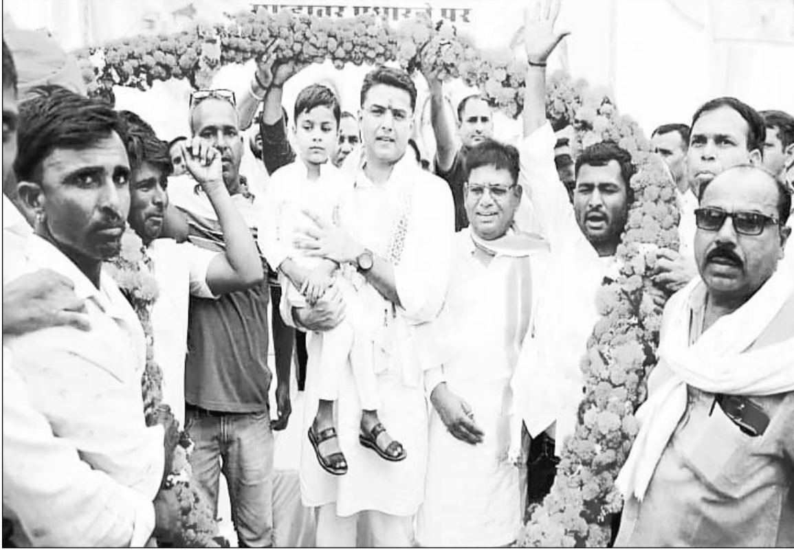
पूर्व उपमुख्यमंत्री पायलट अपने विधानसभा क्षेत्र टोंक की गाँव, टाणियों में घूमकर जमकर पसीना बहा रहे हैं। बुधवार को पायलट ने पांच गाँवों, भांची, मण्डावरा, हथौना पराना और परानी का दौरा किया। पायलट एक के बाद एक विभिन्न गाँवों में गए और वहाँ 13.16 करोड़ रुपये के 50 से अधिक विकास कार्यों का लोकार्पण एवं शिलान्यास किया।