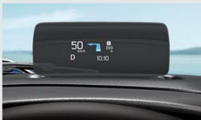
Head Up Display