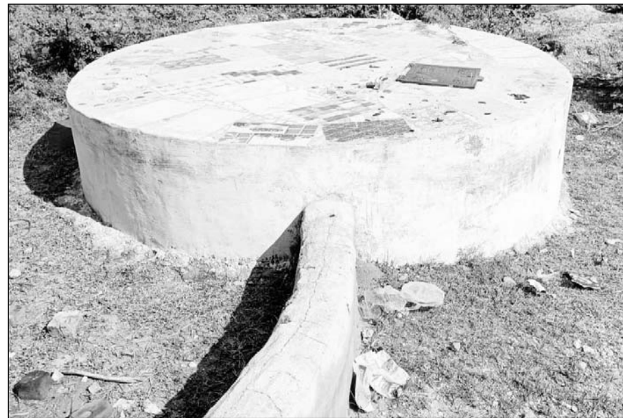
तेलाप गांव में निर्धारित मापदण्ड के अनुरूप कुण्ड नहीं बनाये गये।