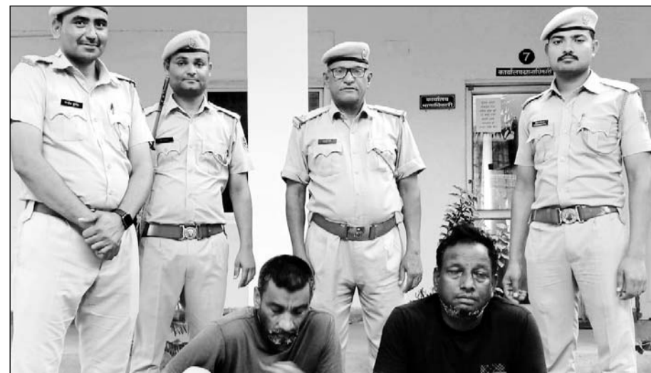
दौसा में सदर थाना पुलिस ने अंतर्राज्यीय गिरोह के दो शांतिर बदमाशों को गिरफ्तार किया।

दौसा, (निर्स)। जिले की थाना सदर पुलिस ने सूने मकानों में चोरी करने वाले अंतर्राज्यीय गिरोह का पर्दाफाश कर दो शांतिर बदमाशों को गिरफ्तार किया है। प्रारंभिक पूछताछ में इन्होंने जयपुर, भीलवाड़ा दूदू और दौसा शहर और कस्बों में चोरी की वारदात करना स्वीकार किया है।