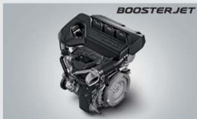
1.0L Turbo Boosterjet Engine with Progressive Smart Hybrid