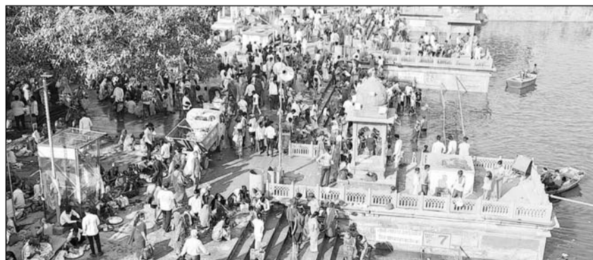
महिलाओं और बालिकाओं ने तीर्थराज मचकुंड में स्नान करने के बाद विशेष पूजा-अर्चना की।

धौलपुर, (निर्स)। तीर्थराज मचकुंड धौलपुर पर प्रतिवर्ष देवछठ के मौके पर लगने वाले लक्ष्मी मेले की शुरुआत ऋषि पंचमी पर शाही स्नान के साथ हुई। सभी तीर्थों का भांजा कहे जाने वाले मचकुंड सरोवर पर ग्वालियर, मुर्ना, अयोध्या, वृन्दावन, मथुरा और अन्य जिलों से आए हुए संतों के शाही स्नान के बाद ही श्रद्धालुओं ने सरोवर में डुबकी लगाई। ऋषि पंचमी पर बुधवार सुबह महिलाओं और बालिकाओं ने तीर्थराज मचकुंड में