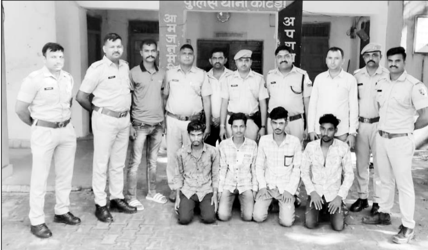
पुलिस ने वारदात का खुलासा करते हुए मास्टरमाइंड सहित चार जनों को गिरफ्तार किया।

कर्मचारी द्वारा बताए हुए और सीसीटीवी फुटेज के आधार पर तलाश