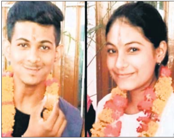
मांडल विद्यालय के उत्कृष्ट परिणामों पर शिक्षाविदों ने विद्यार्थियों को बधाई दे उज्ज्वल भविष्य की कामना की।