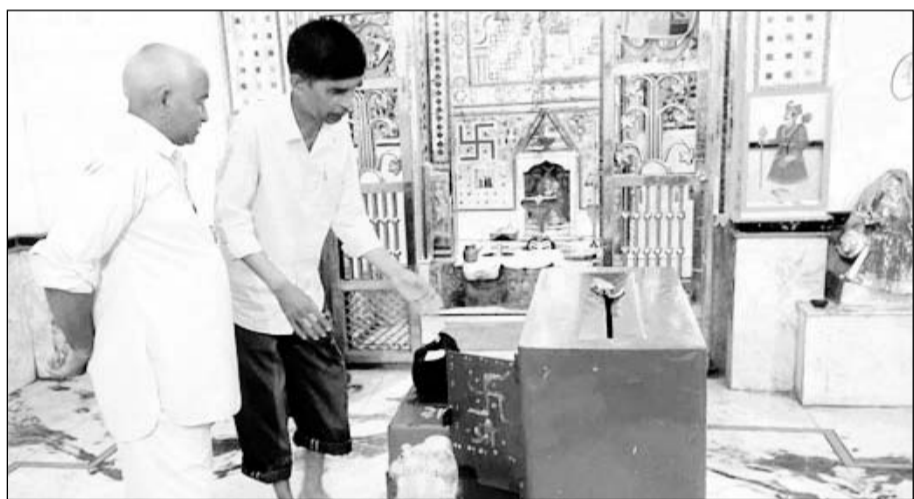
आसपुर क्षेत्र के कतिसौर स्थित कटकेश्वर महादेव में चोरी के बाद पुजारी ने जानकारी दी।

डूंगरपुर, (नि.सं.)। आसपुर पुलिस थाना क्षेत्र के कतिसौर कस्बे में स्थित कटकेश्वर महादेव मंदिर के दसवीं बार शुकुवार फिर ताले टूटे, लेकिन इस बार दानपेटी के ताले नहीं टूटने से चोरी को अंजाम नहीं दे सके।