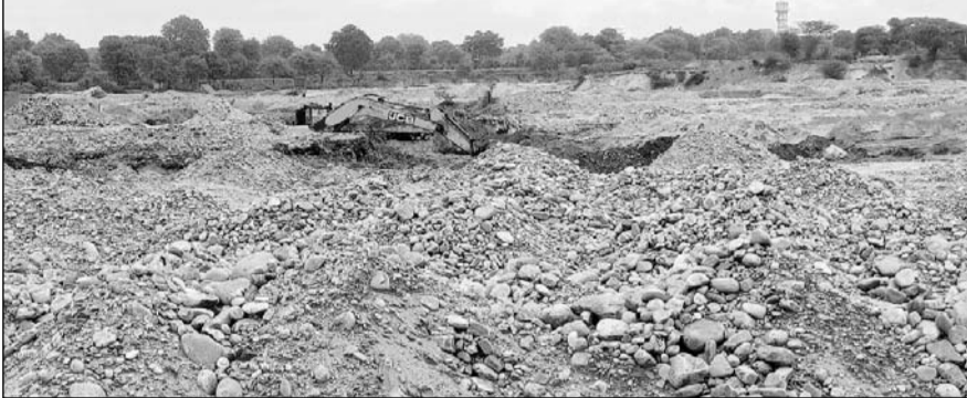
राजसमंद में अवैध बजरी खनन पर मोही बनास नदी पेटे में की गई कार्रवाई में कांकरोली पुलिस ने डम्पर व फोकलेन मशीन को जब्त कर लिया।

राजसमंद, (निर्स)। मोही स्थित बनास नदी पेटे में अवैध खनन करने वाले बजरी माफियाओं के खिलाफ डीएसटी, डीएसबी की सूचना पर देर रात जिला पुलिस और खनन विभाग ने संयुक्त कार्रवाई करते हुए 6 डंपर सहित मशीनों और कई वाहन को जब्त किया है। अवैध खनन के खिलाफ हुई अचानक कार्रवाई से बजरी माफियों में हड़कंप मच गया और डम्पर व टेक्टरों में भरी बजरी को बिखेर कर मौके से भाग निकले।