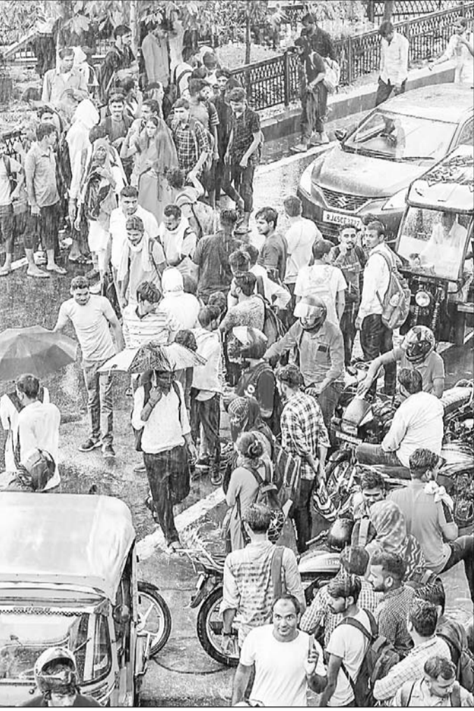
रीट परीक्षा से पहले शुक्रवार को राजधानी जयपुर में युवाओं का रैला उमड़ा। बारिश के कारण लोग एक दिन पहले ही परीक्षा केन्द्रों के नजदीक ठहरने का इंतजाम करते दिखे, ताकि सुबह तय समय पर पहुंच सकें।

परीक्षा सुबह 10 से साढ़े 12 व दोपहर 3 से शाम साढ़े 5 बजे तक दो पारी में करवाई जायेगी