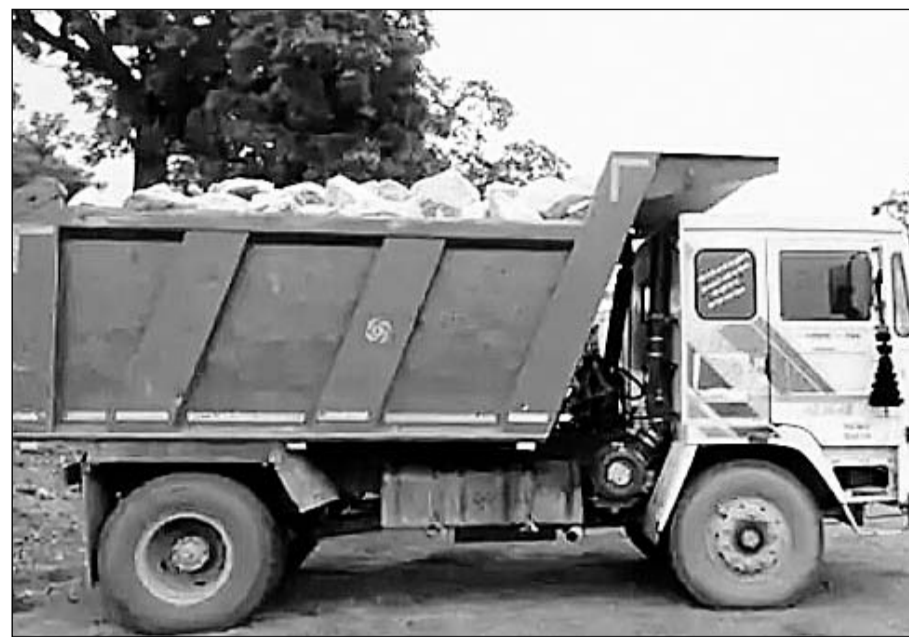
प्रशासन ने केसरपुरा गांव में दबिश देकर अवैध खनन से भरा डम्पर जब्त किया।

डंपर, पोकलेन जब्त, 3 लोगों को हिरासत में लिया