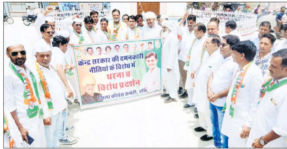
गांधी पार्क टोंक में धरना देकर घंटाघर चौराहे तक पैदल मार्च निकाला तथा केन्द्र सरकार के विरुद्ध प्रदर्शन किया।