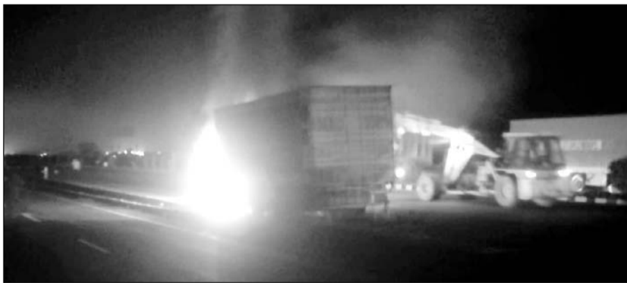
बान्दनवाड़ा कस्बे में हाइवे पर टुक में आग लगने के बाद केबिन से उठती लपटें।