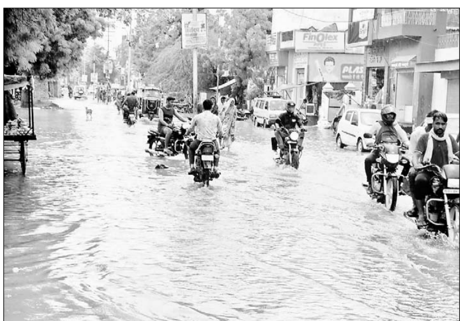
नगर परिषद क्षेत्र चूरू में 29.1 एम.एम बारिश होने से सड़कों पर भारी मात्रा में पानी एकत्रित हो गया।

चूरू, (कासं)। नगर परिषद क्षेत्र चूरू में शुकुवार को एक बार फिर इन्द्र देवता मेहरबान हो गये।