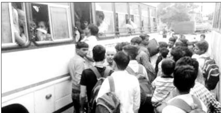
करौली के रोडवेज बस स्टैंड पर बसों में बैठने की मशक्कत करते रीट परीक्षा के अभ्यर्थी।

करौली, (निर्स)। रीट परीक्षा 23 व 24 जुलाई को आयोजित होने वाली है। इस संबंध में करौली जिले से बाहर जाने वाले एवं करौली जिले में आने वाले परीक्षार्थियों के लिए परिवहन, कानून व अन्य समस्त प्रबंधन व्यवस्था परीक्षा संचालन हेतु सुनिश्चित करने के लिये समस्त तैयारियां पूर्ण करने के लिये संबंधित अधिकारियों को निर्देश जारी कर दिये गये हैं। अतिरिक्त जिला कलेक्टर ने बताया कि परीक्षार्थियों को परीक्षा केन्द्रों पर