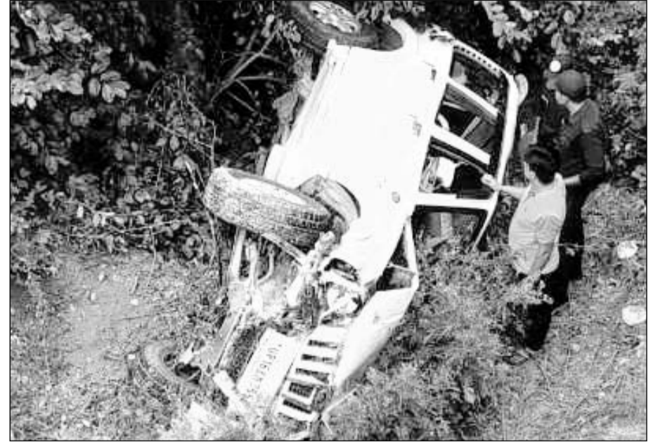
करौली सरमुथरा सड़क मार्ग स्थित कुदना के नाले में श्रद्धालुओं से भरी स्कार्पियो गिरी।

करौली, (निर्स)। कैलादेवी मन्दिर से दर्शन कर लौट रहे श्रद्धालुओं से भरी स्कार्पियो कार चालक को नौद आने के कारण हाइवे से नीचे गहरे नाले में गिर गई जिससे स्कार्पियो में सवार 6 लोग घायल हो गए। उन्हें उपचार के लिए करौली हॉस्पिटल में भर्ती कराया है।