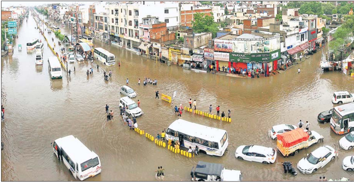
जयपुर में शुक्रवार शाम को करीब घंटे भर झमाझम बारिश हुई। इससे सीकर रोड पर देहर के बालाजी में छह लेन की सड़क दरिया बनकर बहती दिखाई। करीब तीन फिट की ऊंचाई तक सड़क पर पानी भर जाने के कारण चौपटिया वाहनों से लेकर पैदल जाने वालों को भी काफी परेशानी झेलनी पड़ी। इस दौरान रोडवेज बस समेत कई वाहन पानी के बीच में ही जाकर फंस गये जिन्हें आसपास के लोगों ने धक्का देकर बाहर निकलवाया। वहीं अंबावाड़ी में देर रात तक लंबा ट्रैफिक जाम लगा रहा।