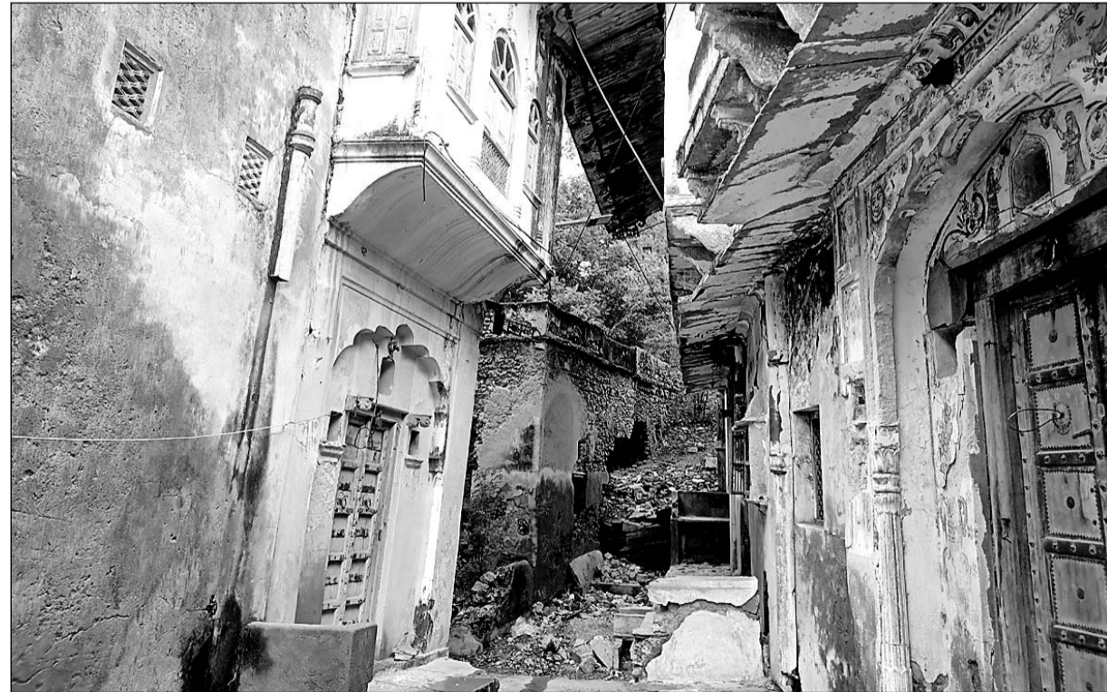
सांभर में भोजशाला के पास जर्जर अवस्था में झुकी दो हवेलियां।