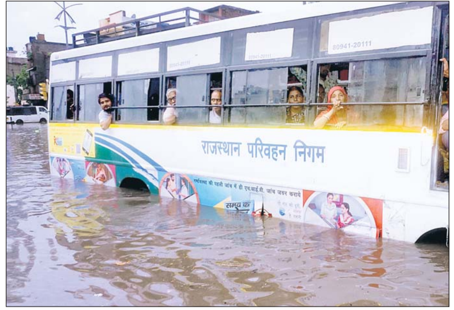
जयपुर में शुक्रवार रात को अंबावाड़ी में देर रात तक लंबा ट्रैफिक जाम लगा रहा।