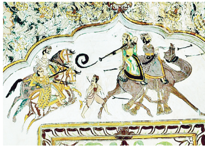
Fresco Art prevalent in Dhola Maru.

Artists and art experts participated and shed light on the diverse art forms of Rajasthan in two virtual sessions on Facebook recently.