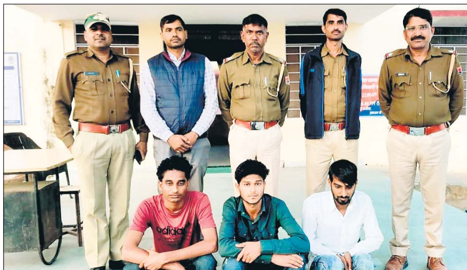
मारपीट कर लड़के का अपहरण करने के आरोपियों को पुलिस ने गिरफ्तार किया।