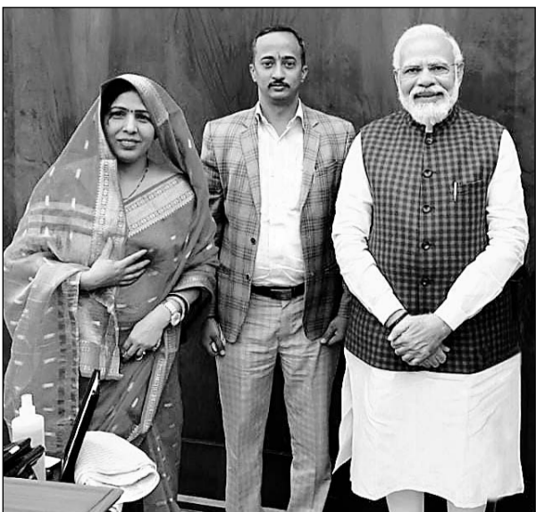
पीएम मोदी से मिली भरतपुर सांसद रंजीता कोली।

भरतपुर, (निसं)। भरतपुर सांसद रंजीता कोली ने पीएम से मुलाकात कर प्रधानमंत्री आवास योजना में हुए फर्जी डॉ. के घोटाळे व रीट परीक्षा 2021 धांधली के मामले की सीबीआई जांच कराने की मांग की। 8 फरवरी को भरतपुर सांसद रंजीता कोली ने पीएम से मुलाकात कर राजस्थान में रीट परीक्षा 2021 धांधली के मामले से भी प्रधानमंत्री को अवगत करवाया। सांसद ने कहा कि विधानसभा कार्या की पंचायत समिति कार्या, पहाड़ी में प्रधानमंत्री आवास योजना में बहुत बड़ा