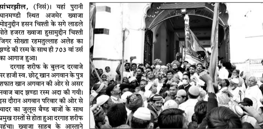
सांभर में मंगलवार को दरगाह शरीफ के बुलंद दरवाजे पर झण्डे की रस्म के साथ उर्स का आगाज हुआ।