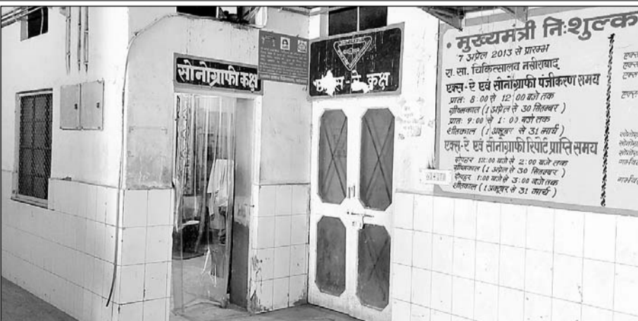
नसीराबाद अस्पताल में बंद पड़ा सोनोग्राफी कक्ष।