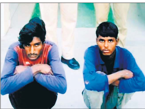
पुलिस की गिरफ्त में चोरी की आरोपी।