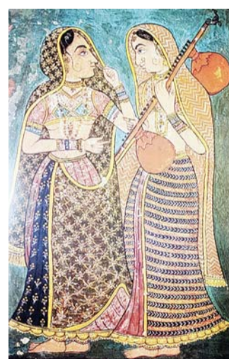
Bundi style of Fresco