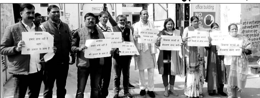
अलवर नगर परिषद के भाजपा पार्षदों ने विरोध प्रदर्शन किया।