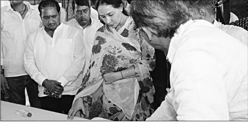
उपमुख्यमंत्री दिया कुमारी ने हॉस्पिटल का निरीक्षण कर निर्माण कार्य की प्रगति का जायजा लिया।

जयपुर। उपमुख्यमंत्री दिया कुमारी ने बुधवार को 'प्रगति पथ यात्रा' कार्यक्रम के अंतर्गत विद्याधर नगर विधानसभा क्षेत्र में निर्माणाधीन सैटेलाइट हॉस्पिटल का निरीक्षण कर निर्माण कार्य की प्रगति का जायजा लिया। इस दौरान उन्होंने संबंधित अधिकारियों को निर्माण कार्य में