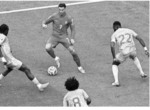
योन वीसा ने हेडर के जरिए गोल पर पहुंचा दिया। अब सभी की नजरें दूसरे हाफ पर होंगी।

हुआस्टन, 17 जून। पुर्तगाल और डीआर कॉन्गो के बीच मुकाबला शुरुआत से ही रोमांचक स्थिति में बना हुआ है। जोआओ नेव्स ने छठवें मिनट में ही हेडर के जरिए गोल दागकर पुर्तगाल को 1-0 की बढ़त दिला दी थी। पुर्तगाल और कॉन्गो के बीच जारी मुकाबले में 24 मिनट का खेल पूरा हो चुका है और पहला हाइड्रेशन ब्रेक लिया गया है। पुर्तगाल ने छठवें मिनट में जोआओ नेव्स के गोल की मदद से 1-0 की बढ़त बना रखी है। हाफ-टाइम तक पुर्तगाल और कॉन्गो 1-1 की बराबरी पर है। मुकाबले की शुरुआत में पुर्तगाल के लिए छठवें मिनट में ही जोआओ नेव्स ने हेडर के जरिए गोल दागा। इसके बाद 45 प्लस 5 मिनट में