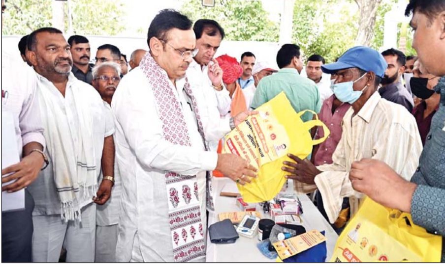
मुख्यमंत्री भजनलाल शर्मा ने बुधवार को उदयपुर में शहरी सेवा शिविर का अवलोकन किया। इस अवसर पर उन्होंने विभिन्न योजनाओं के लाभार्थियों को सहायता प्रदान की।

मुख्यमंत्री भजनलाल शर्मा ने आमजन से अपील की कि वे जरूरतमंद लोगों को शिविर में पहुँचाने में सहयोग करें, ताकि पात्र व्यक्ति को योजनाओं और सेवाओं का लाभ मिलना सुनिश्चित हो।