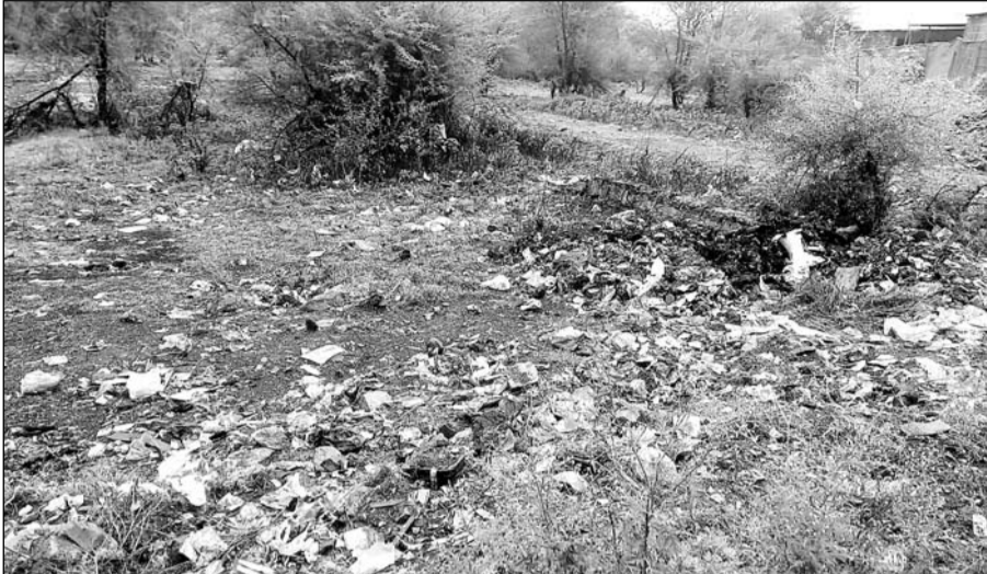
रुन्डेला तालाब कचरे और गंदगी से अटा पड़ा।

प्लास्टिक फैला हुआ था तथा आमजन कचरा न उठने की शिकायत कर रहा था। स्वच्छ भारत मिशन (ग्रामीण) की बैठकों में दिए गये निर्देशों में स्पष्ट है कि कहीं भी खुल्ले में कचरा एवं प्लास्टिक नहीं होना चाहिए तथा तालाब, झीलों में अवरुद्ध नालों को साफ सफाई अतिक्रमणों को अविलम्ब हटवाया जाये जिससे तालाब एवं झीलों में पानी भर सके। उपरोक्त तालाब को साफ सफाई का कार्य युडीए की परिधि में आना बताया गया तथा कचरा उठाने का कार्य भी युडीए के द्वारा पिछले पांच वर्षों से