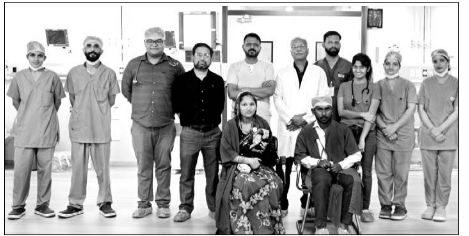
पिम्स हॉस्पिटल उमरड़ा में नवजात की गंभीर बीमारी की सफल सर्जरी हुई।