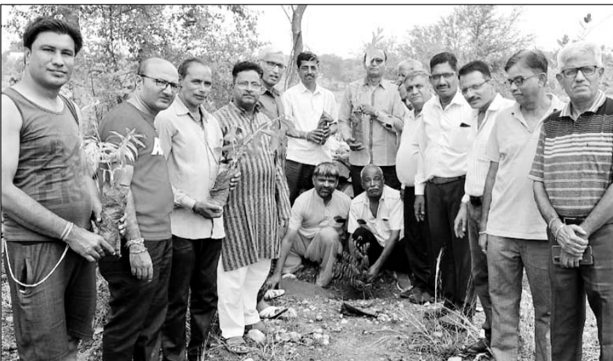
कल्लाजी धाम व भैरव मंदिर परिसर में पौधारोपण करते विप्र फाउंडेशन ग्राम इकाई आसोडा के पदाधिकारी।