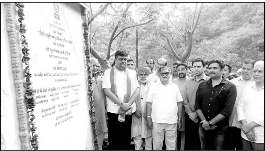
उदयपुर के अंबेरी में बटरफ्लाई पार्क, चिल्ड्रन एडवेंचर जोन, इको टूरिज्म एडवेंचर जोन के शुभारंभ करते असम राज्यपाल गुलाबचंद कटारिया।