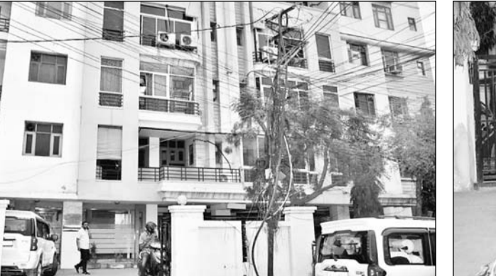
राजधानी के विधायकपुरी इलाके में गोपालबाड़ी में गोपाल टावर अपार्टमेंट के चौथे फ्लोर पर हथियारबंद बदमाशों द्वारा बिजनेसमैन के बेटे को फ्लैट में बंधक बनाकर 75 लाख रुपए लूट की सूचना मिलने पर पुलिस ने मौके पर पहुंच कर जांच पड़ताल की।

जयपुर। राजधानी के विधायकपुरी इलाके में गोपालबाड़ी में गोपाल टावर अपार्टमेंट के चौथे फ्लोर पर हथियारबंद बदमाशों ने बिजनेसमैन के बेटे को फ्लैट में बंधक बनाकर 75 लाख रुपए लूट की घटना झूठ निकली है। वारदातों को परिवार के लोगों ने रुपए चोरी कर लूट की कहानी गढ़ दी थी।