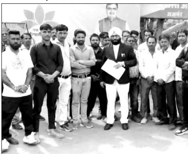
कलेक्ट्रेट पर पीड़ित लोगों ने प्रदर्शन किया।