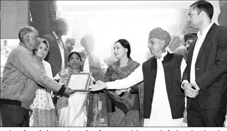
स्वामित्व योजना के जिला स्तरीय कार्यक्रम में उप मुख्यमंत्री दिया कुमारी, केंद्रीय कृषि मंत्री भारगीरथ चौधरी एवं विधायक अनिता भदेल ने लाभार्थियों को पट्टे वितरित किए।

उप मुख्यमंत्री दिया कुमारी ने कहा कि प्रधानमंत्री नरेंद्र मोदी द्वारा प्रधानमंत्री स्वामित्व योजना के तहत देश में वचुंअली माध्यम से पट्टों का वितरण किया जा रहा है। ग्रामीण क्षेत्रों में बहुत से ऐसे लोग हैं, जिनकी जमीन किसी भी सरकारी आंकड़ों में दर्ज नहीं थी। इस कारण जमीन को लेकर आपसी झगड़ा या कब्जा होने का