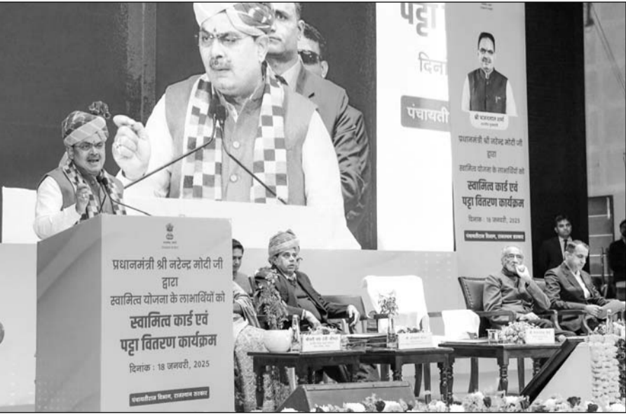
प्रधानमंत्री नरेन्द्र मोदी ने शनिवार को नई दिल्ली से वीडियो कॉन्फ्रेंसिंग के जरिये स्वामित्व कार्ड व पट्टा वितरण कार्यक्रम में मुख्यमंत्री भजनलाल से संबोधित किया।